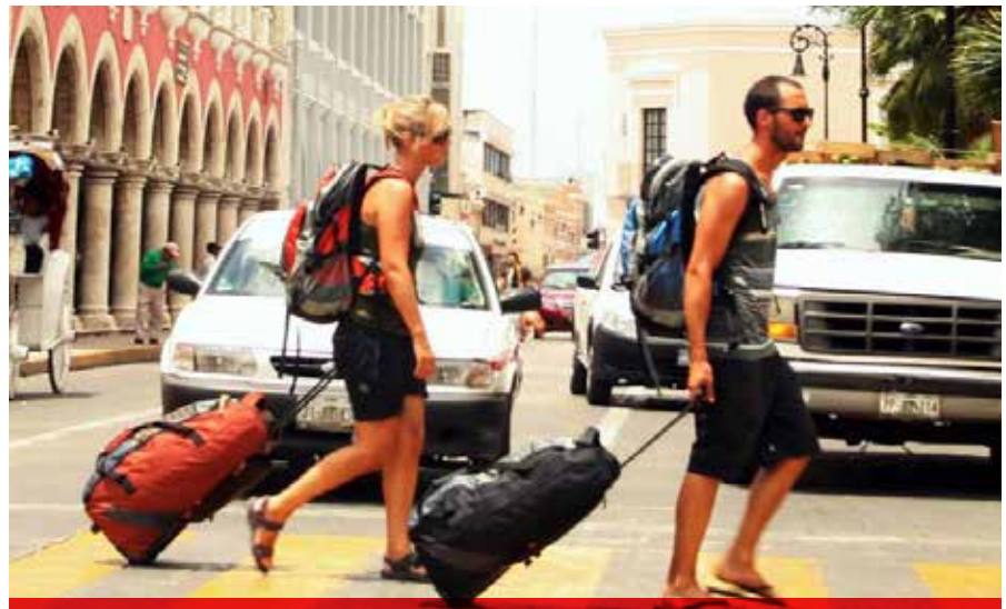
Los cuatro principales destinos de Yucatán, Mérida, Chichén Itzá, Valladolid y Uxmal, lograron un crecimiento de 12% en este indicador.

Por ello, con el apoyo de la SRE y en coordinación con los gobiernos de Baja California Sur y Quintana Roo, se sostuvieron encuentros con autoridades del Departamento de Estado americano con la intención de entablar un diálogo y mejorar el entendimiento de las implicaciones para ambos países.