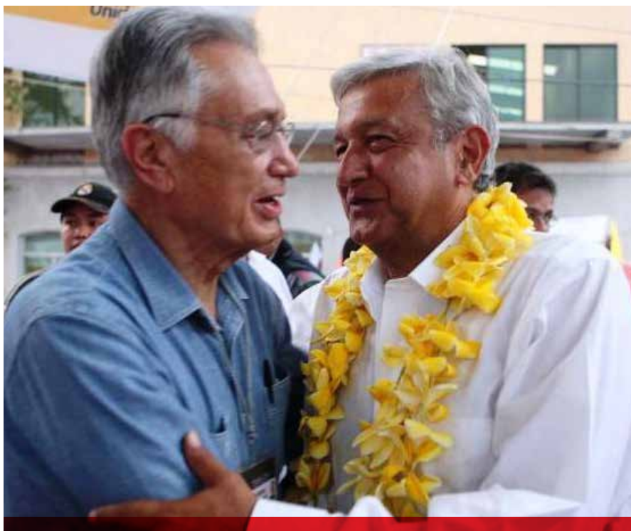
Manuel Bartlett Díaz con Andrés Manuel López Obrador

Sin embargo, el candidato que se vende como un político diferente debe acreditar con hechos que los es. No basta con decirlo sino tiene que demostrarlo y en eso ha quedado corto el candidato puntero