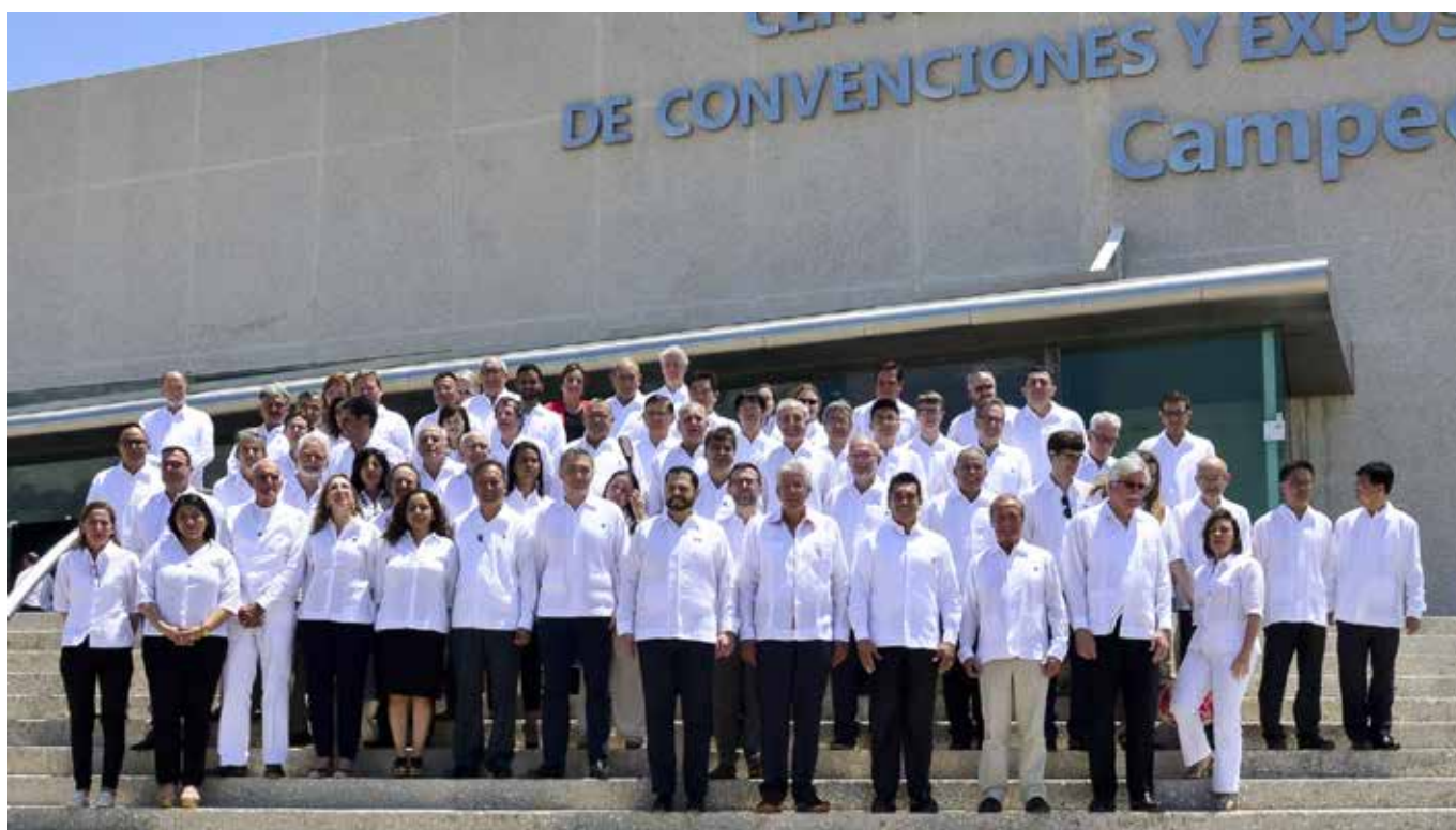
El secretario de Comunicaciones y Transportes, Gerardo Ruiz Esparza fue el encargado de inaugurar este evento que reunió a más de 80 participantes de más de 30 países, en la Ciudad de las Murallas.

Durante los días del encuentro, los expertos de países como España, Portugal, Estados Unidos, Eslovenia, Cuba, Italia, Japón, Reino Unido, intercambiarán conocimientos y experiencias en materia de infraestructura carretera, además dialogarán sobre resiliencia y medio ambiente, entre otros temas. R