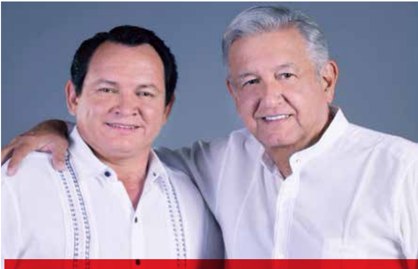
Pese a la llegada de Joaquín Díaz Mena a la contienda como candidato a gobernador por Morena, PES y PT, es un hecho que el bipartidismo PRI-PAN prevalecerá en Yucatán.