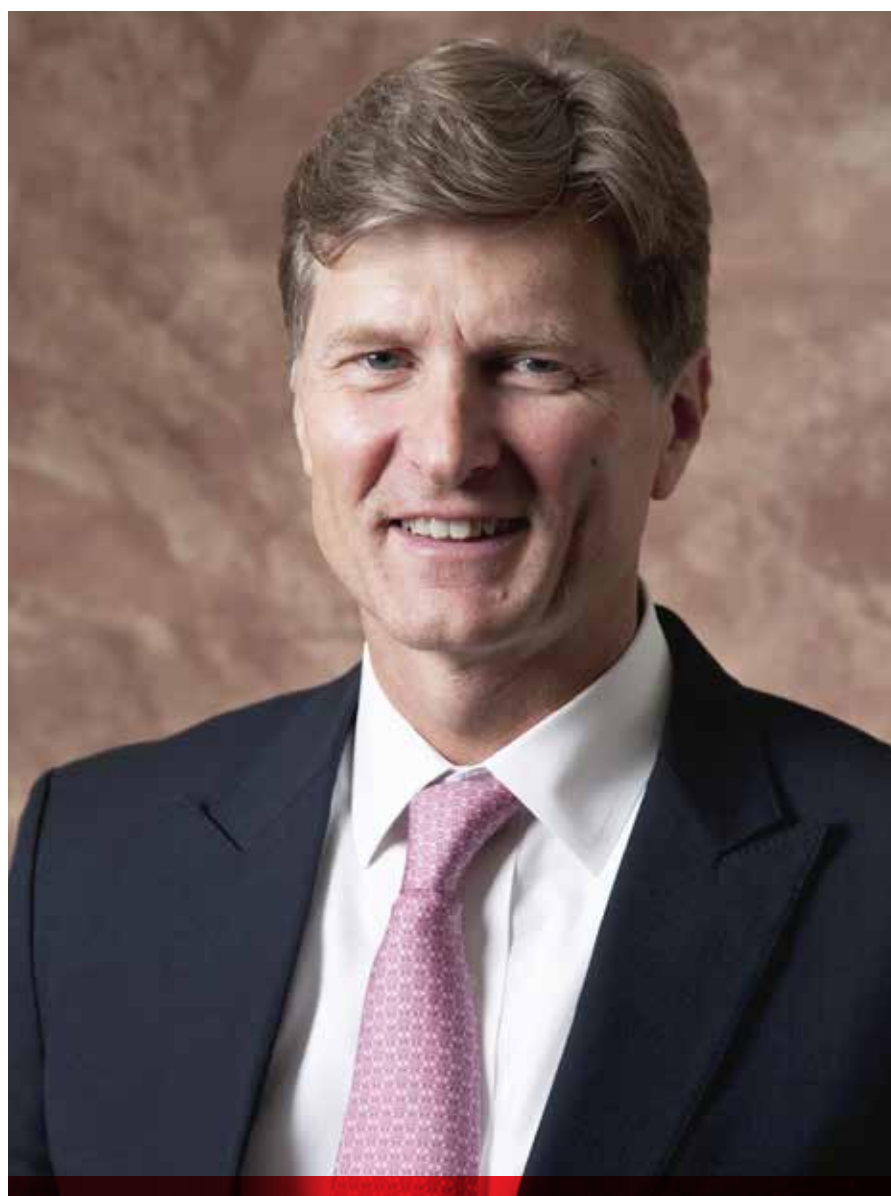
Enrique De la Madrid Cordero, titular de la Secretaría de Turismo.

No hay duda de que Yucatán es un estado que tiene condiciones ideales para seguir creciendo de manera acelerada en materia de turismo. Tiene una gran cantidad de activos que son susceptibles de apalancar para traer más turistas. Tiene ciudades coloniales, una gran riqueza arqueológica, hermosos litorales, una de las gastronomías más apreciadas del país, cada vez mayor conectividad aérea, zonas naturales protegidas, un clima que envidian en luchas latitudes, la amabilidad de su gente y, por si fuera poco, de los mejores índices en todos los indicadores de seguridad. |R▶