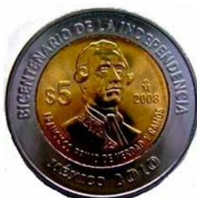
MONEDA DE CINCO PESOS, FRANCISCO PRIMO DE VERDAD Y RAMOS, CON PUNTO Y SIN PUNTOS

La colección completa de esta serie de personajes, es de muy bella manufactura, una gran colección conmemorativa al alcance de todos e históricamente muy acertada para recordar a aquellos que nos dieron la patria que actualmente tenemos. Como acervo numismático es de gran estimación y significado histórico.