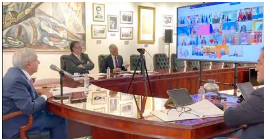
El presidente López Obrador participó en la cumbre virtual del G20.

- Coincido amigo editorialista, el presidente Andrés Manuel se mantuvo en su postura de líder moral lo cual es congruente con la imagen que se ha forjado, pero la propuesta sobre la ONU tomando control de los medicamentos es irreal, y dudo que se le dé seguimiento alguno. - comentó el político - De igual manera, me llama