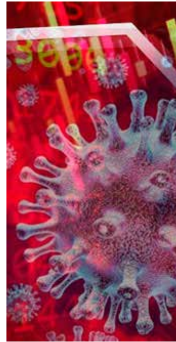
La crisis del Covid-19 y su impacto en la economía

El panorama ya era nebuloso antes del estallido. La economía cerró 2019 con un -0,1%, el primer retroceso anual en una década. Tanto la demanda interna —una de las grandes esperanzas de López Obrador— como el sector industrial llegan registrando caídas durante siete cuatrimestres consecutivos. “El golpe agarra a México en medio en unas situación de gran debilidad en términos de crecimiento y con una respuesta muy lenta por parte de las autoridades”, apunta el economista jefe de Goldman Sachs para América Latina, que ha rebajado recientemente su estimación, de un crecimiento del 0,6% a una caída del 1,6%. IR ▶