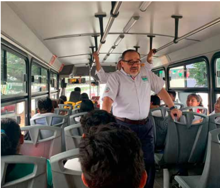
El Senador Jorge Carlos Ramírez Marín realiza una consulta sobre la legalización de la marihuana, tema trascendental que se analiza en el Senado de la República.

siguiente versaron sobre el tema de Desarrollo Social y Rural, y destacó la intervención del titular de la SEDESOL al ilustrar la situación de pobreza en el estado.