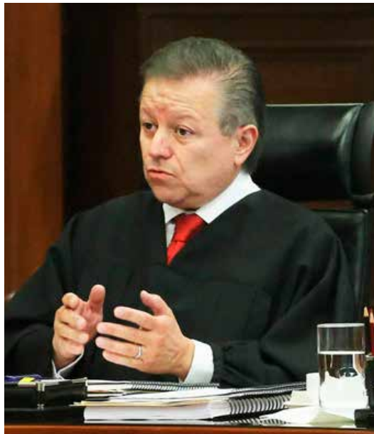
ARTURO FERNANDO ZALDÍVAR LELO DE LARREA, MINISTRO PRESIDENTE DE LA SUPREMA CORTE DE JUSTICIA DE LA NACIÓN.

Aunado a los débiles aprovechamientos en el espacio político por parte de los legisladores opositores del PRI,