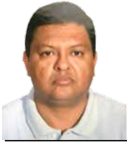
POR FRANCISCO LÓPEZ VARGAS