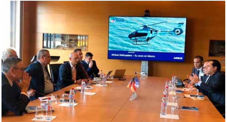
El interés de Airbus de dar un primer en materia aeroespacial en el sureste de México nace de la creciente demanda de pilotos de helicópteros en América Latina.

El Gobierno de Vila Dosal mantiene la visión seguir atrayendo inversiones que generen más fuentes de empleo y oportunidades a los yucatecos, lo que sólo puede ser posible si se traen empresas con grandes capitales como Airbus. R