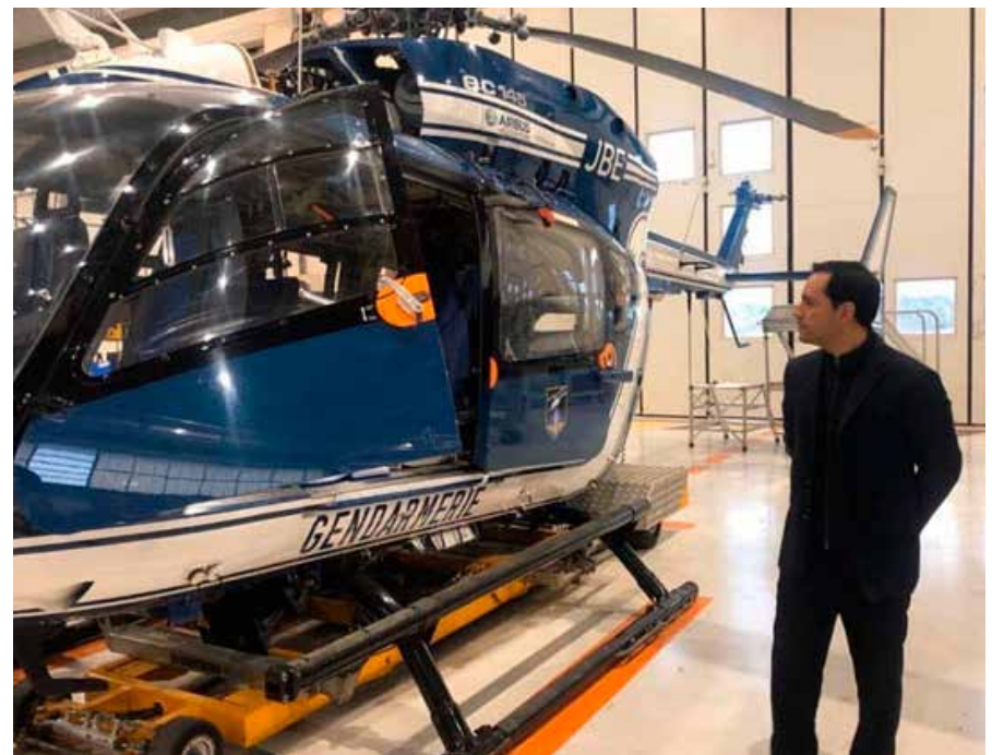
El Gobierno de Vila Dosal mantiene la visión seguir atrayendo inversiones que generen más fuentes de empleo y oportunidades a los yucatecos.