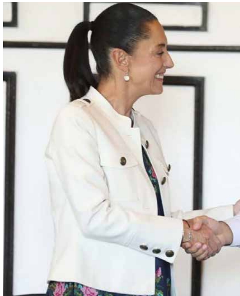
EL GOBERNADOR MAURICIO VILA DOSAL Y LA JEFA DE GOBIERNO DE LA CIUDAD DE MÉXICO, CLAUDIA SHEINBAUM PARDO.

Cabe resaltar que, en este escaparate, expositores de diversos municipios venden productos locales, como prendas, entre guayaberas, vestidos, huipiles y blusas, o gastronomía, con