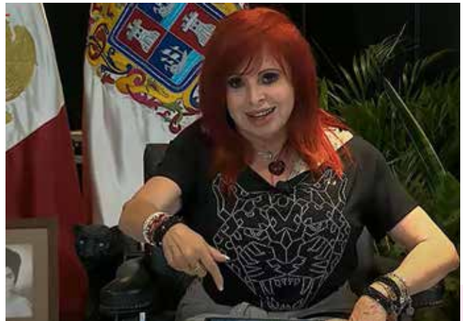
LA GOBERNADORA DE CAMPECHE, LAYDA SANSORES.

-Pues habrá que ver qué consecuencias tiene este aparente abuso por parte de la dirigencia nacional del PRI y, más importante, si Alejandro Moreno cumple su palabra y termina su dirigencia el 18 de agosto del próximo año. -concluyó la periodista- Por mientras, parece que la exgobernadora Dulce María Sauri y la senadora Beatriz Paredes tienen razón en cuanto a que lo sucedido generó tensiones innecesarias en el PRI cuando la prioridad debería ser Coahuila y Estado de México. R