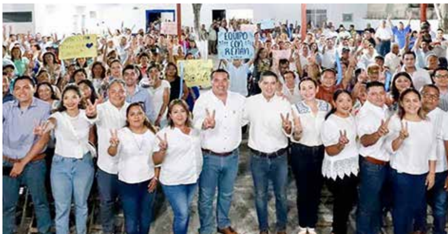
RENÁN BARRERA RECIBIÓ AMPLIO RESPALDO EN SU VISITA A TEKAX, DONDE CONVOCÓ A TRABAJAR UNIDOS PARA CUIDAR LA SEGURIDAD Y EL DESARROLLO DE YUCATÁN. LO ACOMPAÑA EL ALCALDE DIEGO ÁVILA.