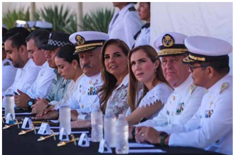
LA GOBERNADORA DE QUINTANA ROO PARTICIPÓ EN LA CEREMONIA CONMEMORATIVA DEL DÍA DE LA MARINA, EN LA NOVENA REGIÓN NAVAL.