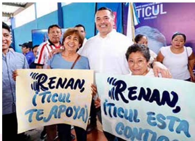
ELOCUENTES PANCARTAS DE MILITANTES DE TICUL EN LA QUE MANIFIESTAN SU APOYO AL ALCALDE MERIDANO, A QUEN RECIBIERON CON BATUCADA, PANCARTAS Y PORRAS.