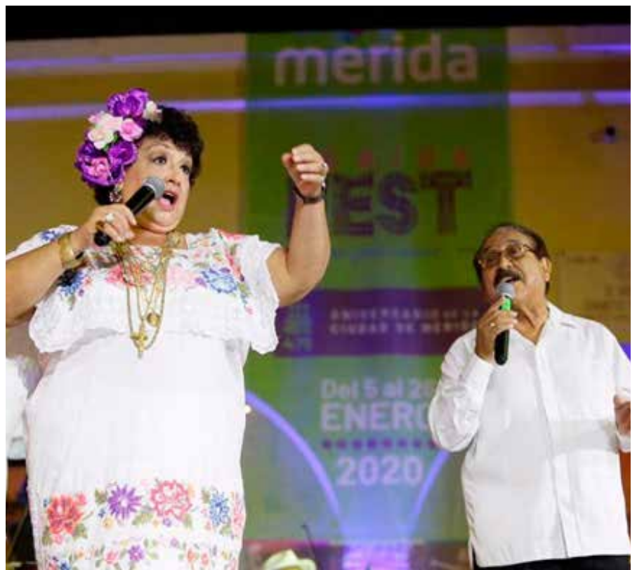
En el marco del 478 aniversario de la Mérida, este año el Festival de la Ciudad hace un reconocimiento a las mujeres y hombres así como a la inclusión de género presentes en este tipo de celebraciones y espectáculos.