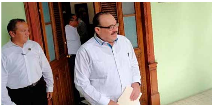
EL SENADOR JORGE CARLOS RAMÍREZ MARÍN.

Desde esa perspectiva, los agentes de los palacios se unieron a los comunes dictados que se van manejando. Unos aportan que fue la entrada triunfal del Senador Ramírez Marín por ayudar a su amigo, con una salida razonable, en sentido decidido para no perder más aceptación ciudadana. Aún más, con el anuncio de la marcha atrás de uno de los nuevos impuestos más polémicos dan alineación a esa supuesta sugerencia. Otros, explican que pudo tratarse de aprovechar la bajada momentánea de Mauricio Vila, para que con la cobertura de los medios el padrino de los