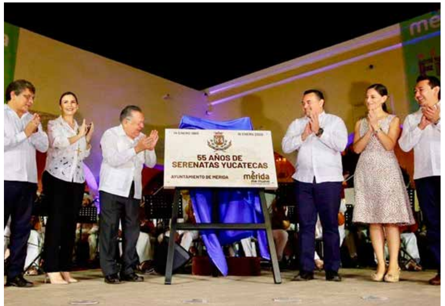
En el marco del evento también develó placa conmemorativa al 55 aniversario del programa “Serenatas de Santa Lucía”.

Como invitados especiales estuvieron Frederic Vacheron, representante de la Unesco en México y Fabrice Pastor, presidente de la Continental American Padel Federation (CAPF). R