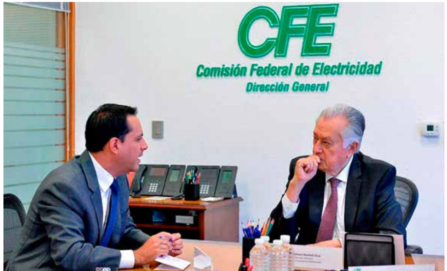
El gobernador Mauricio Vila Dosal con el titular de la CFE, Manuel Barlett.