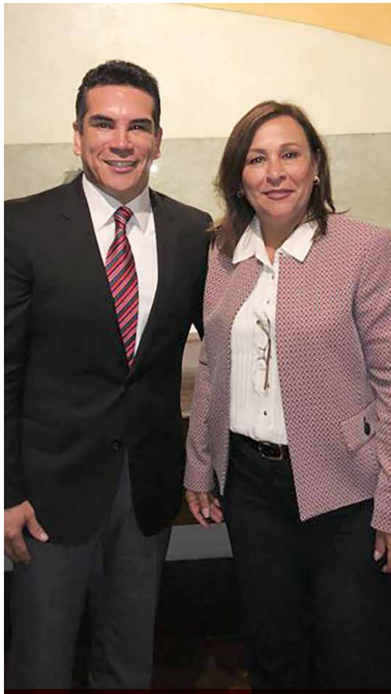
El titular del Ejecutivo estatal se reunió con la próxima secretaria de Energía, Rocío Nahle García.

En la reunión de trabajo también dieron seguimiento a los proyectos de exploración y extracción de hidrocarburos en la Sonda de Campeche, licitados en la Ronda 3.1. R