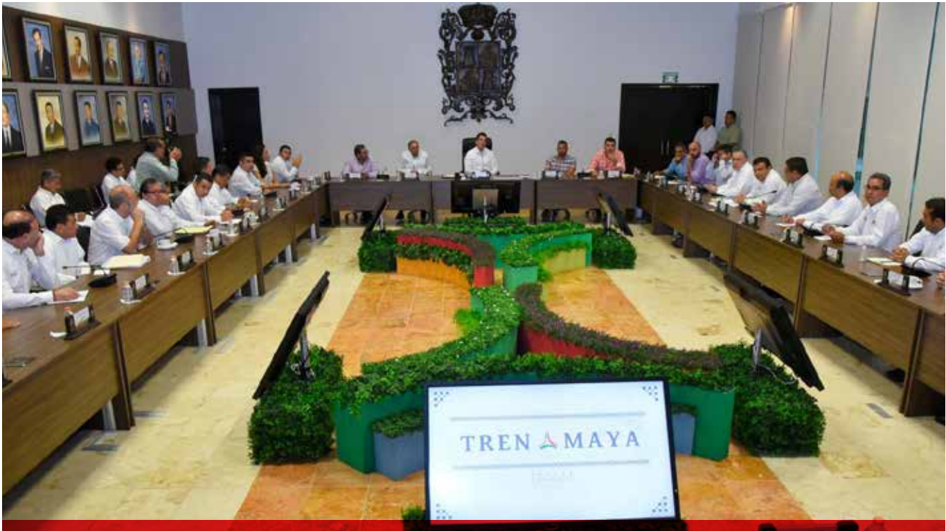
El gobernador Alejandro Moreno Cárdenas encabezó una reunión de trabajo con el equipo del próximo gobierno federal.