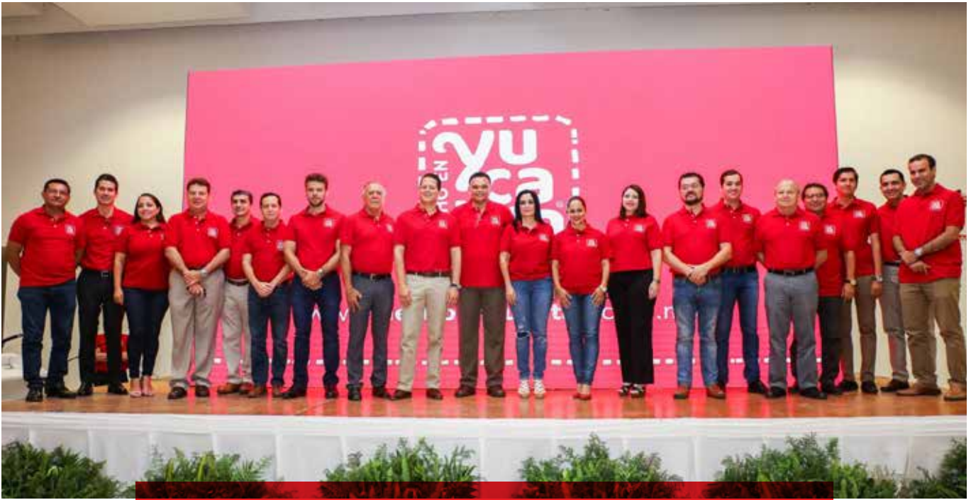
Empresarios yucatecos de los diferentes sectores productivos se sumaron a la campaña "Hecho en Yucatán".