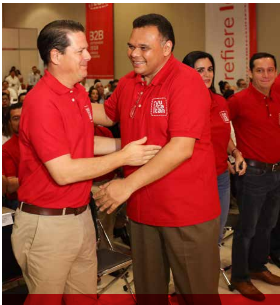
El presidente del Consejo Coordinador Empresarial y el gobernador Rolando Zapata Bello en la inauguración del evento Conexión B2B de la marca "Hecho en Yucatán".

Se trata –enfaticó el entrevistado–, de que esta campaña sea un trabajo permanente y vigente durante muchos años, no se trata de una campaña solo para la fotografía o de sexenio, sino que sea el sello de los productos hechos en Yucatán.