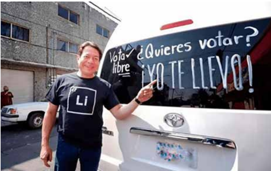
MARIO DELGADO, PRESIDENTE DE MORENA, OFRECIÓ LLEVAR A VOTAR A TODO AQUEL CIUDADANO QUE NO TUVIERA CÓMO LLEGAR A SU CASILLA.

porcentaje de participación necesario para validar la revocación con el fin de que solo se necesite el 30% o 20% del padrón ya que 40% es demasiado. -Esperemos que se estudie bien la propuesta del presidente pues parece que podría tener consecuencias negativas para la población. -expresó el escritor, y le preguntó al editorialista- ¿Cuál fue entonces la lectura de la oposición?