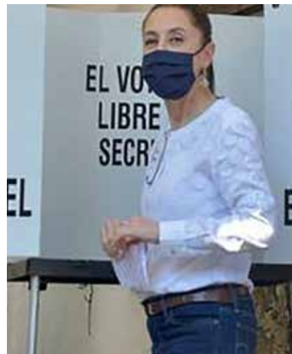
CLAUDIA SHEINBAUM, JEFA DE GOBIERNO DE LA CDMX.

-Puesto que quienes son oposición no están aglutinados en un grupo o partido, sino que tienen distintos perfiles e intereses, hubo diversas críticas. Sin embargo, el comentario más recurrente fue que ganó el abstencionismo activo, lo cual quiere decir que el 82% de los mexicanos inscritos en el padrón electoral que no participaron en la consulta lo hicieron con consciencia para no apoyar el ejercicio. -contestó el editorialista- Esto explica por qué la oposición se mostró un tanto fría ante el proceso y no organizó esfuerzos para propiciar que los ciudadanos fueran a las urnas a votar a favor de la revocación de López Obrador. Además, recordemos que la revocación de mandato debe nacer de la voluntad del pueblo y en