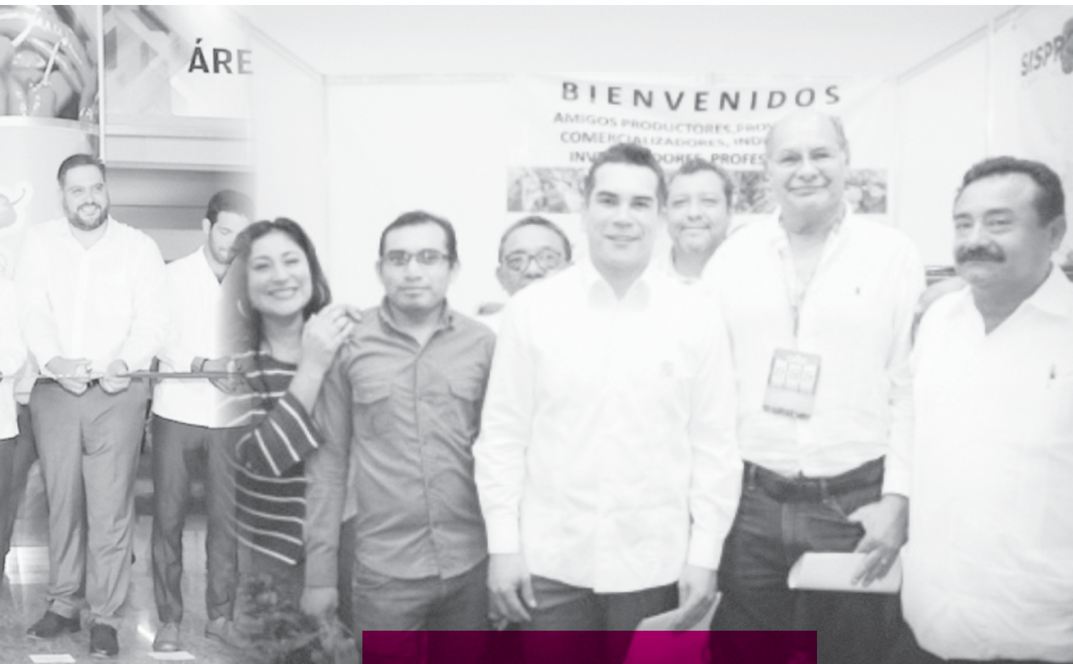
Productores de Jalisco e integrantes de la Conaproch entregaron un reconocimiento al mandatario estatal.

que lo hecho, mucho por lograr para los sectores productivos tal como apunta esta convención mundial", indicó.