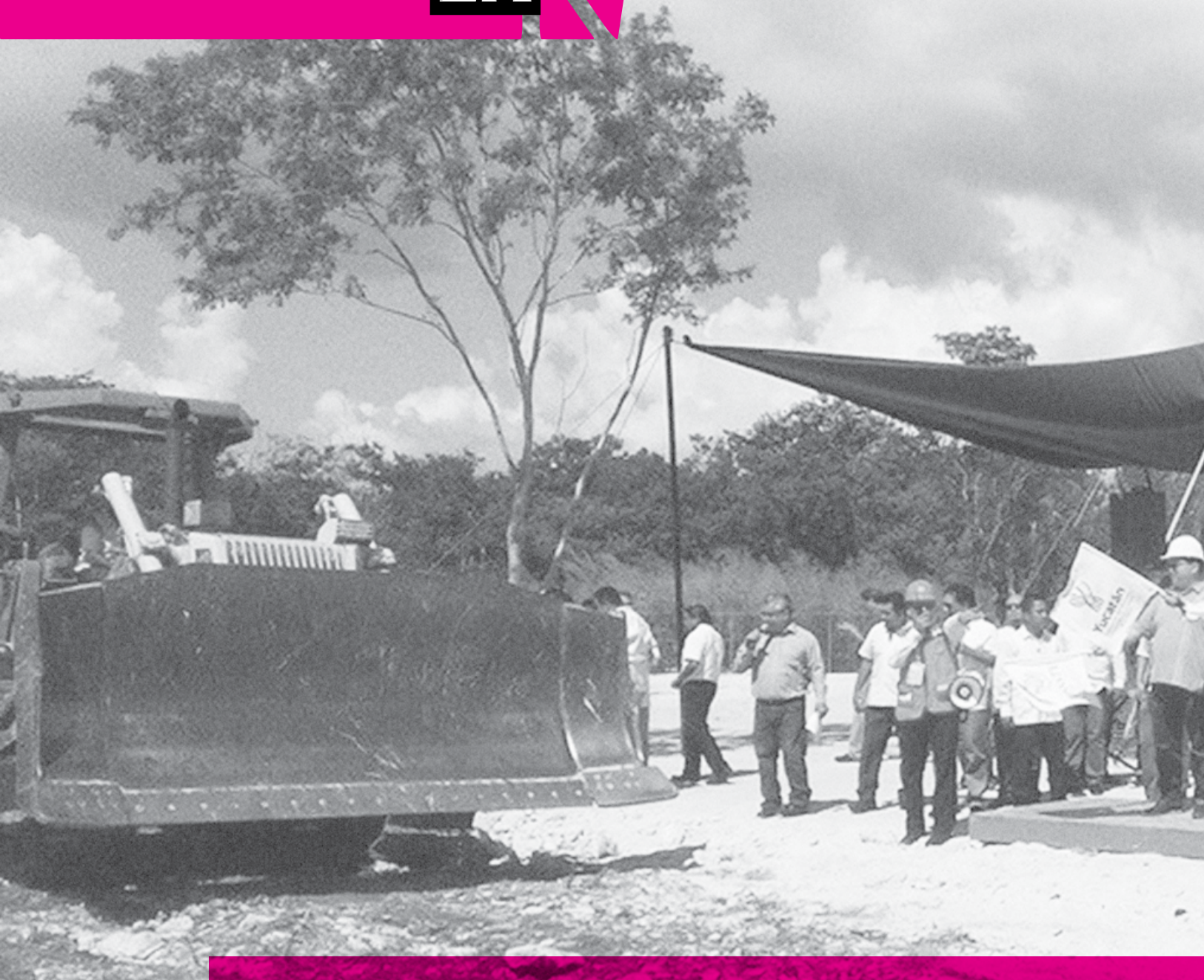
El director general del ISSSTE, José Reyes Baeza Terrazas, y el gobernador del estado, Rolando Zapata Bello,

instruyó a los funcionarios del Instituto a seguir reforzando el trabajo de reorganización interna administrativa que permita darle la funcionalidad y la viabilidad al nuevo hospital.