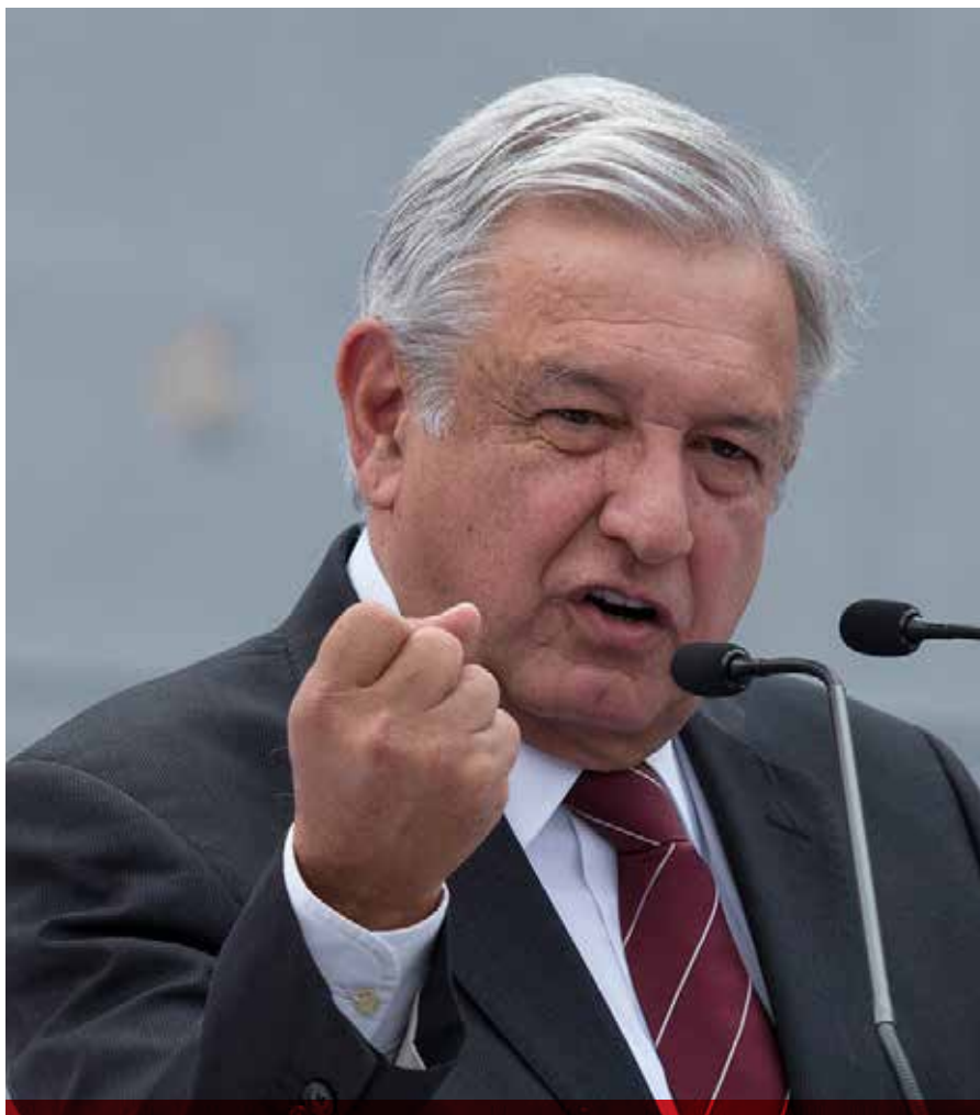
De cara al proceso electoral del próximo domingo 1 de julio, López Obrador ha polarizado la opinión ciudadana.

expansión. Quiere crecer, propagar su proyecto, multiplicar su influencia. No puede ser una asociación hermética, pero pierde sentido cuando arrolla los contornos indispensables. Como órganos del pluralismo, los partidos necesitan membranas que los separen de sus adversarios, que den sentido a la pertenencia y que sirvan de orientación a los votantes. La fervorosa convicción antipluralista del fundador de Morena ha sellado a la criatura. En la campaña del 2018, impulsado también por la enorme carga de oportunistas, Morena pretende presentarse como la síntesis política de México. La voz de la legitimidad histórica.