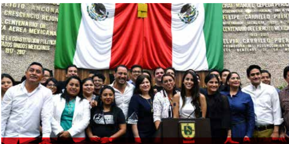
En sesión plenaria, diputados integrantes de las cinco fuerzas políticas de la LXI Legislatura aprobaron por unanimidad las modificaciones al Código Penal local.