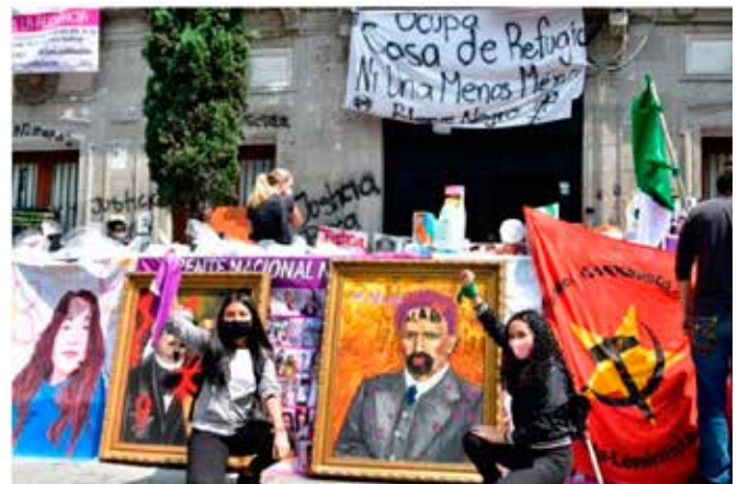
Varios colectivos tomaron las instalaciones de la Comisión Nacional de los Derechos Humanos (CNDH).

–La CNDH emitió un comunicado un par de días después para pedirle a los manifestantes que entregaran el edificio del Centro Histórico. Explicó que la titular del organismo, Rosario Piedra Ibarra, había recibido a las familias quejas a inicios de mes y la mayoría se mostraron satisfechas después del diálogo, quienes