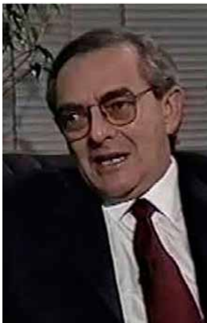
CARLOS CASTILLO PERAZA, A 20 AÑOS DE SU FALLECIMIENTO.

H ace 20 años falleció Carlos Castillo Peraza. Compañero en la redacción del Diario de Yucatán, Carlos fue quizá el político más aventajado en el siglo pasado.