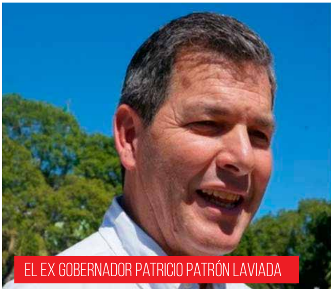
EL EX GOBERNADOR PATRICIO PATRÓN LAVIADA