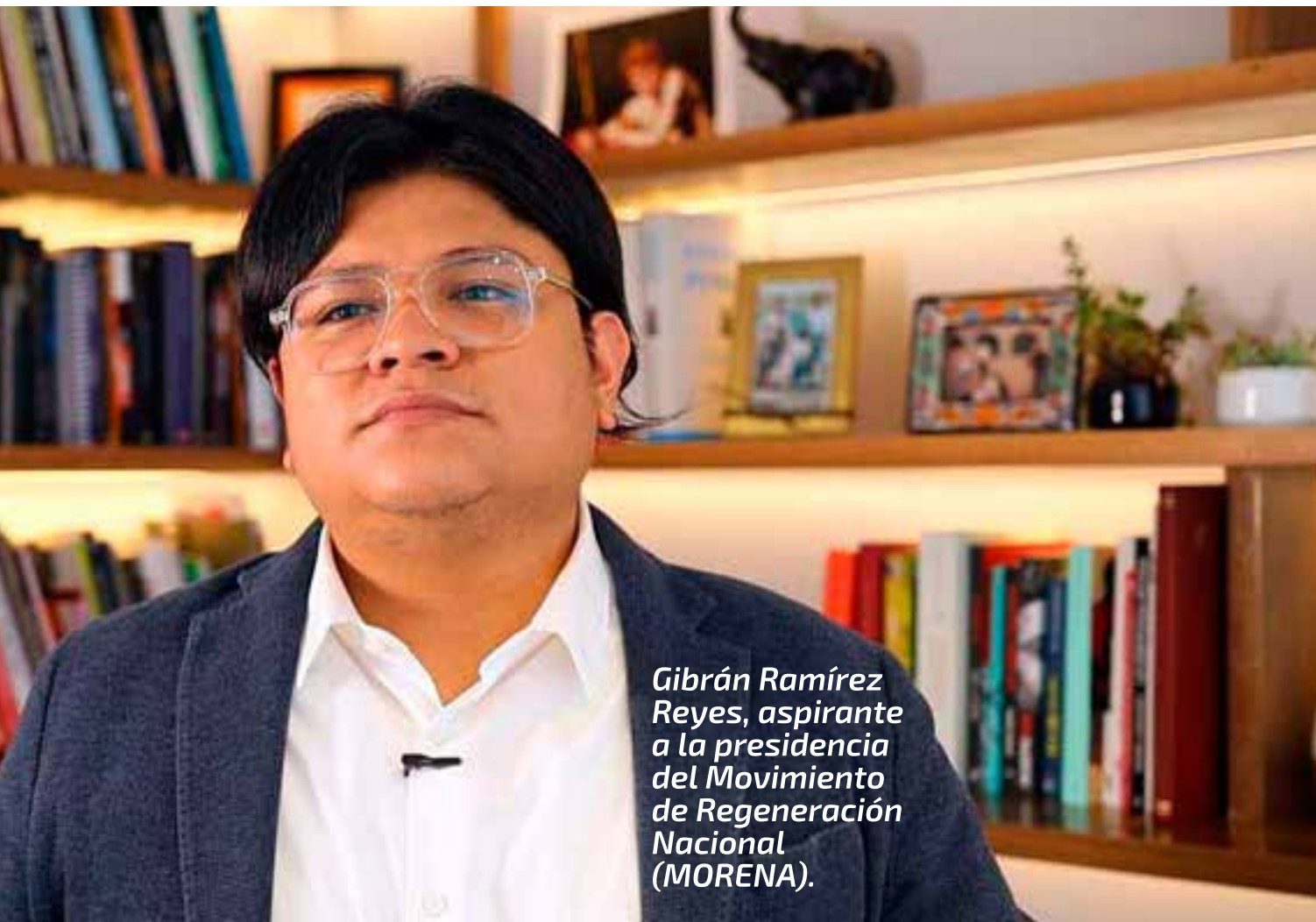
Gibrán Ramírez Reyes, aspirante a la presidencia del Movimiento de Regeneración Nacional (MORENA).