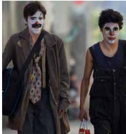
EL MOLOTECO Y EL CAGALERA DESPUÉS DE ASALTAR UNA PESERA.- FOTO: SALVADOR PEÑA L.

La gran Ciudad de México, es inmensamente urbana, complejamente selvática en asfalto y acero pero, paradójicamente, también es rural en amplias zonas de su inconmensurable geografía. Alcaldías como Milpa Alta, Tlahuac o Xochimilco, conservan amplios parajes de naturaleza bucólica, que parecen olvidar que están enclavados en el territorio de la urbe más grande del mundo. Rincones perdidos en la maraña citadina, que se tornan en campo sin salir de ella. Cuando pensamos en canales y trajineras, nos remitimos sin remedio a Xochimilco; pero Tlahuac también los tiene, y muy bellos por cierto. Y tal vez no sepamos que Milpa Alta, si tiene milpas, y si son altas, y de una rica variedad de cultivos hermanados con el maíz, junto a cuyas altas cañas, crecen como huéspedes, frijol, calabaza y chile, cultivos asimilados e inseparables, desde los lejanos tiempos de la madre