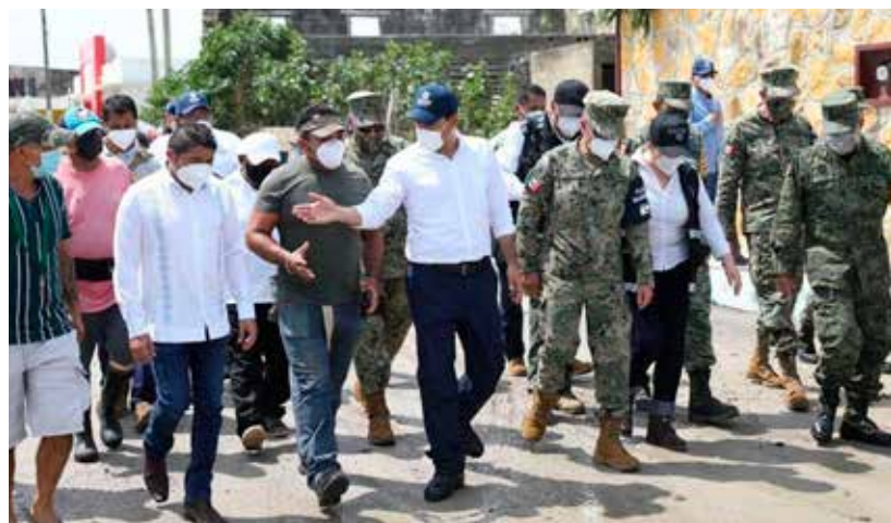
El Gobierno del Estado destaca buena respuesta de la población, ante los embates del huracán Delta.