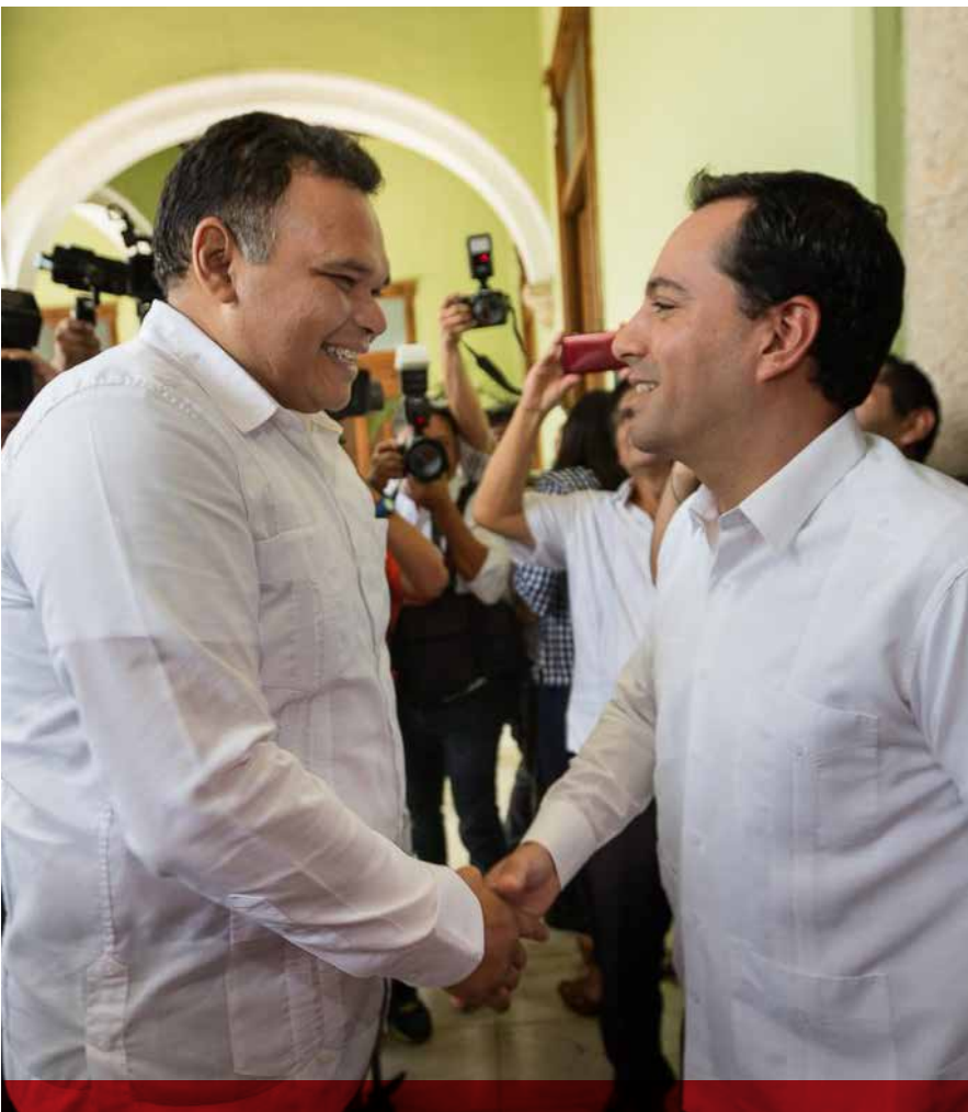
Rolando Zapata Bello y Mauricio Vila Dosal, gobernador en funciones y electo, respectivamente, se saludan de manera cordial antes del cambio de estafeta.

Un cambio de gobierno "aterciopelado", es decir, sin conflictos, es lo que se espera a partir del 1 de Septiembre cuando asuma el mandato constitucional, el panista y empresario Mauricio Vila Dosal, en tanto que este domingo, presentará el último informe de su administración, el priista, Rolando Zapata Bello.