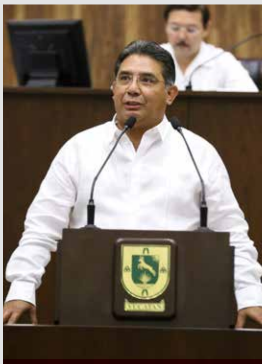
Alejandro Cuevas Mena, diputado del PRD.