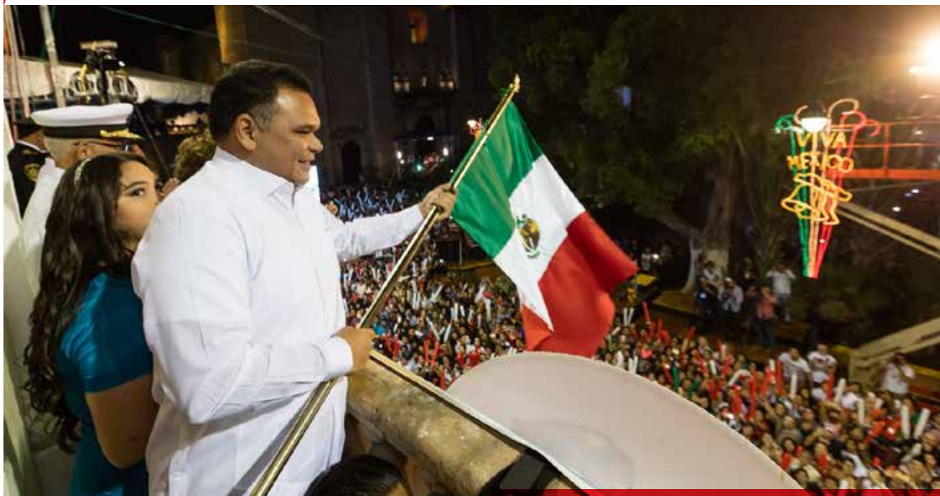
Rolando Zapata Bello, gobernador del Estado.