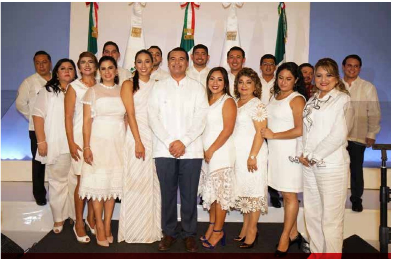
El nuevo edil convocó a su cuerpo edilicio, colaboradores y la ciudadanía en general, a trabajar por el bienestar y desarrollo de Mérida, para que ésta siga siendo un referente a nivel mundial.