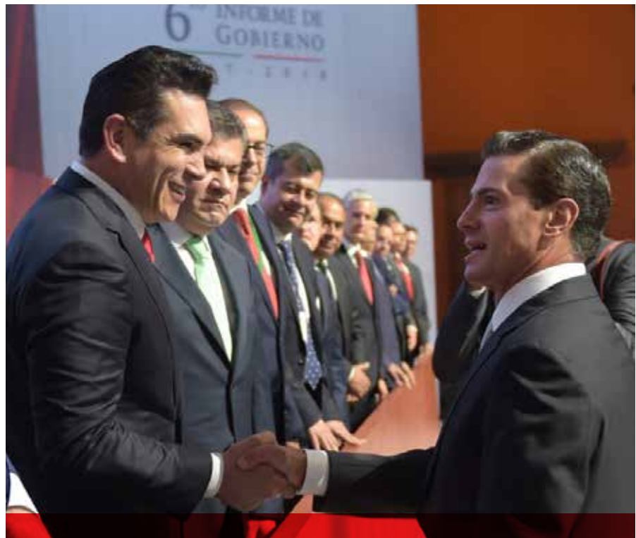
El gobernador Alejandro Moreno Cárdenas acompañó al presidente Enrique Peña Nieto durante el mensaje que envió a la nación.