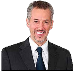
JOEL SALAS SUÁREZ Comisionado del INAI @joelsas

Uno de los mayores logros de la transparencia en México es la obligación de publicar por ley información específica que sirve para rendir cuentas sobre aspectos altamente sensibles. La actual ley general de la materia establece un número considerable de obligaciones de transparencia. Esta información es útil, pero poco consultada. Solo cinco obligaciones de transparencia concentran la mayor parte de las consultas: estructura orgánica, directorio de servidores públicos, remuneración mensual por puesto, concesiones, permisos o autorizaciones otorgados y contratos.