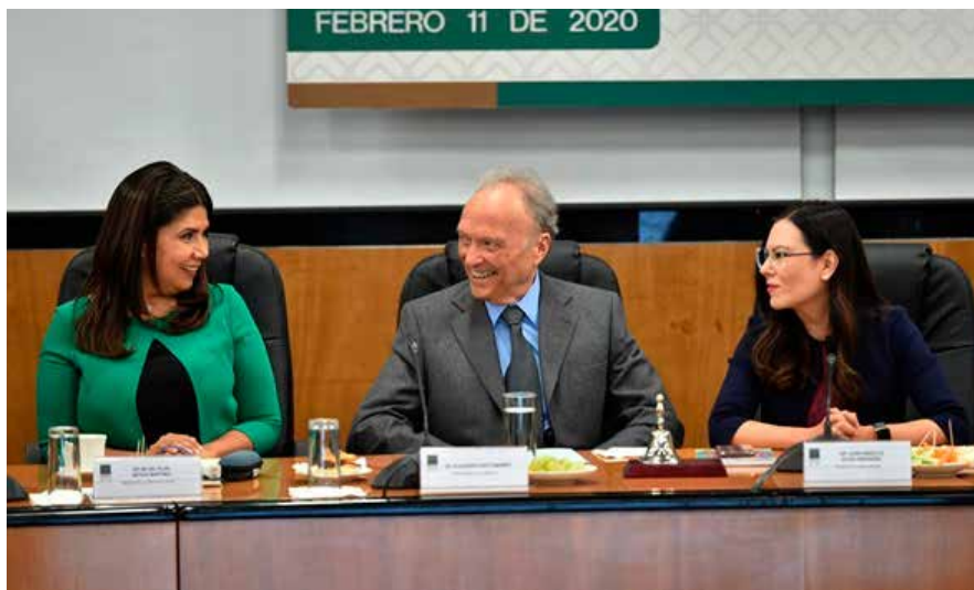
El Fiscal General de la República, Alejandro Gertz Manero, se reunió con diputadas para recabar opiniones sobre la reconstrucción del delito de feminicidio.

- Estoy de acuerdo en que el gobierno capitalino aparenta tener como prioridad este tema, pero el hecho que a nuestro presidente le dé pereza hablar de él, me pone a pensar sobre qué tanto seguimiento real se le dará al caso. - planteó el político - Él mismo dijo en su conferencia mañanera que no quería hablar del