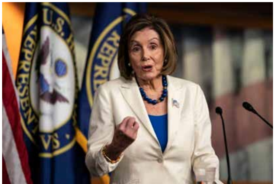
Nancy Pelosi, líder del Congreso norteamericano.

- La situación de Estados Unidos es muy interesante, porque las presiones para que se modificara el