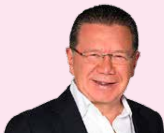
POR JORGE FERNÁNDEZ MENÉNDEZ

Si el fiscal Donoghue presenta pruebas diferentes a los dichos de esos narcotraficantes, si exhibe pruebas materiales de la presunta corrupción de García Luna, estaremos