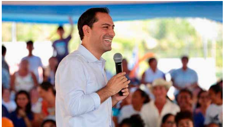
El gobernador de Yucatán, Mauricio Vila Dosal.

- Difícil creerle cuando durante su sexenio García fue considerado su "consentido" por los otros miembros de su gabinete. Según, el mismo