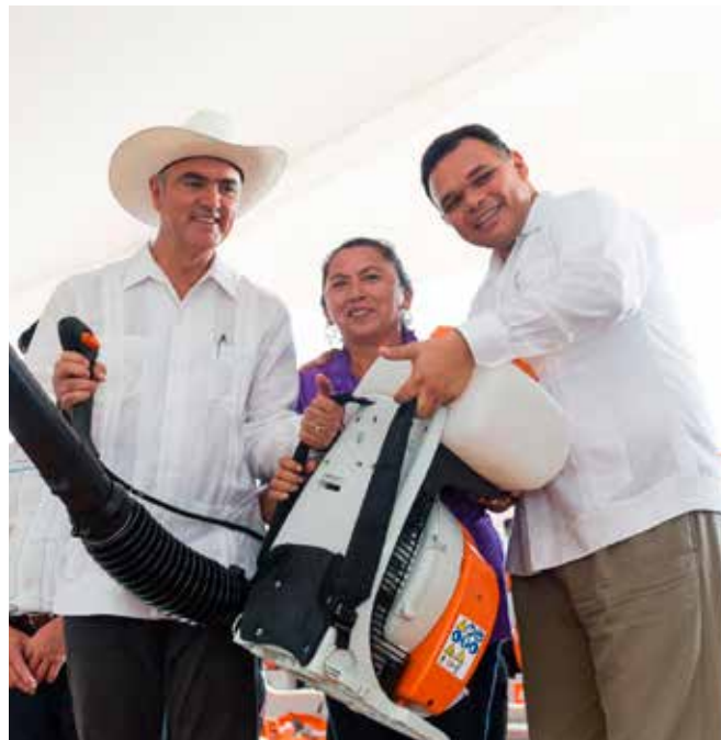
EL EX GOBERNADOR, ROLANDO ZAPATA BELLO.

Vaya, hasta los primeros lugares en encuestas son parecidos, como los mejores gobernantes del país. Los escudos representativos de sus gobiernos similares; el Escudo Yucatán en su continuidad como Yucatán Seguro. Varios altos funcionarios del PRI repitiendo o reacomodados como un buen número de operadores, ahora al servicio del gobierno panista. Reiteran, una vez más, que se espera que al final de camino los resultados no sean parecidos a todo lo exhibido por varios zapatistas que al día ya conforman una sólida base de lo denominado Político-Empresario para consolidar al Empresario-Político. Constante con sello nacional, regional y local, sostuvieron en sus pensamientos los agentes de los palacios.