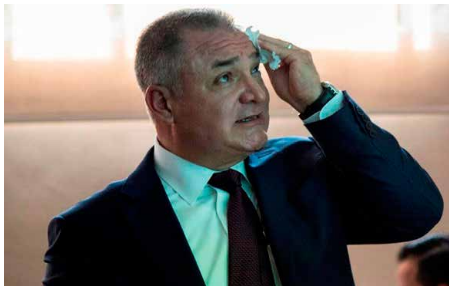
Genaro García Luna, ex secretario de Seguridad.

- A libros electrónicos, softwares, videojuegos, y otros intangibles de este tipo. Importante tener en cuenta que, cuando se firmó el Tratado de Libre Comercio hace veinticinco años