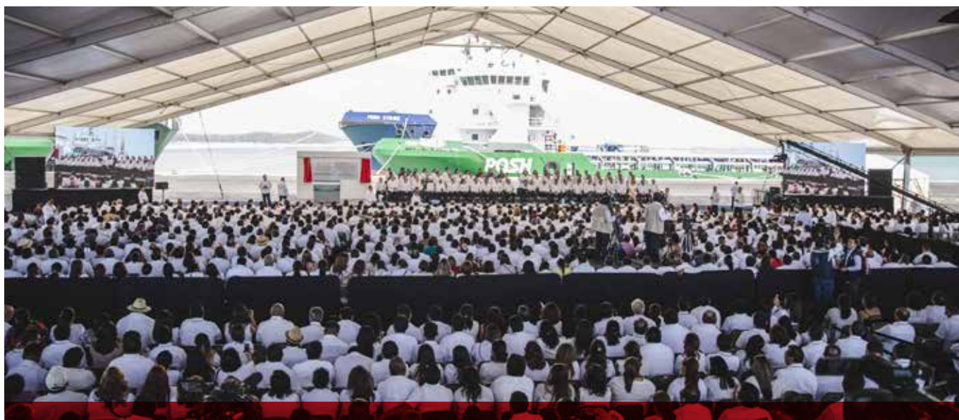
Ante funcionarios de los tres órdenes de gobierno, el presidente de la República destacó que el financiamiento de la banca de desarrollo permitirá acelerar la actividad productiva y la extracción de hidrocarburos para recuperar la actividad que se tenía en el pasado.