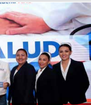
Mauricio Vila Dosal, candidato al Gobierno de Yucatán, presentó sus propuestas de salud ante expertos y especialistas de este sector.