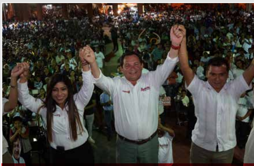
Yucatán no quedará fuera del gran proyecto de transformación de todo el país, afirma el candidato Lopezobradorista.

Las propuestas del abanderado de los partidos MORENA, PT y PES, en materia de salud, educación, turismo, el campo, entre otros, es que los programas de fomento y apoyo lleguen completos, para que todos aquellos que lo necesitan tengan oportunidades parejas. R