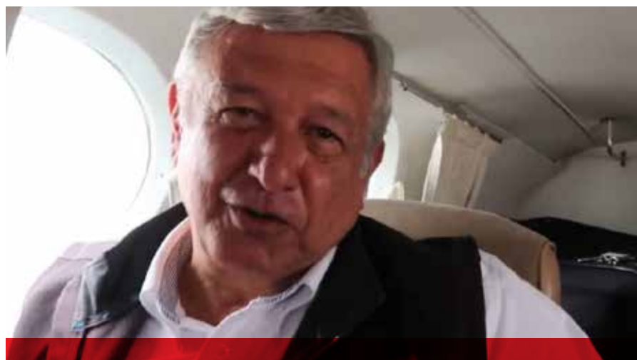
Andrés Manuel López Obrador, desde las oficinas centrales brinda apoyo a Huacho Díaz en lo operativo, asesora territorial y lo necesario para mantener el buen papel que desarrolla, hasta ahora, el vecino del puerto de San Felipe.

habilidad de brindarle la oportunidad de esa posición a alguien que hiciera mejor papel, pero además más con el sello de la braza zapatista. Quizá, se escucha en el ambiente, pueda ser otro logro de la muy mencionada Ortega Pacheco, aunque su figura pueda estar en la desarrollada Europa. En fin, solo les cumplimos a los agentes de los palacios en destacar sus apuntes y estudios de la vida política local. Nada fuera de la ley, nada más, agregó