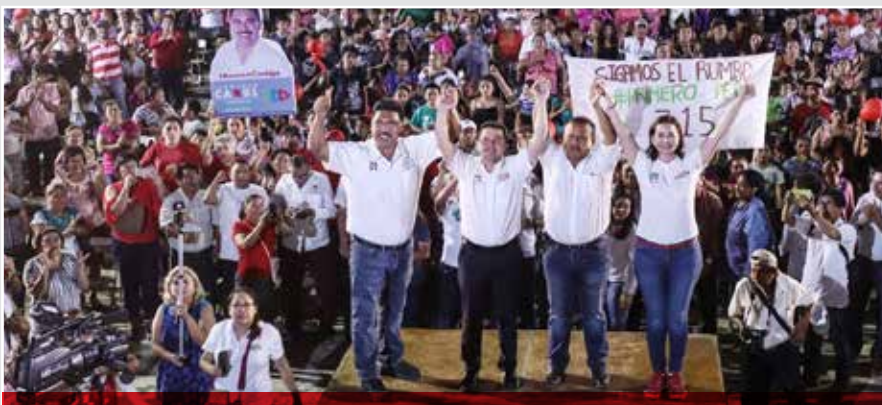
Conozco la ruta, conozco mi estado, señaló el candidato del PRI a la gubernatura.

Refrendó su compromiso de trabajar para mejorar la calidad de vida de las familias que viven con carencias y reforzar la seguridad del estado.