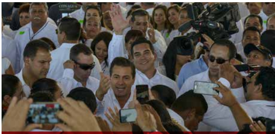
El titular del Ejecutivo federal se dio tiempo para saludar de mano y tomarse fotos con la concurrencia.

Mientras que los trabajos de modernización del puerto de Seybaplaya contemplaron la construcción de un muelle en espigón de 200 metros de longitud en cada banda de atraque, con un ancho de 250 metros; la construcción de un puente con un claro de 22 metros de longitud, pavimentación de 4.13 kilómetros de viaducto y vialidades, además de 400 metros de atraque que garantizarán una mejora en las actividades económicas y turísticas.