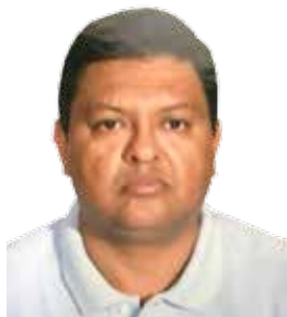
POR FRANCISCO LÓPEZ VARGAS

El 5 de mayo de 2011, un grupo de adherentes al llamado de Sicilia inició su caminata hacia la Ciudad de México partiendo de la fuente de la Paloma de la Paz en Cuernavaca, como un acto