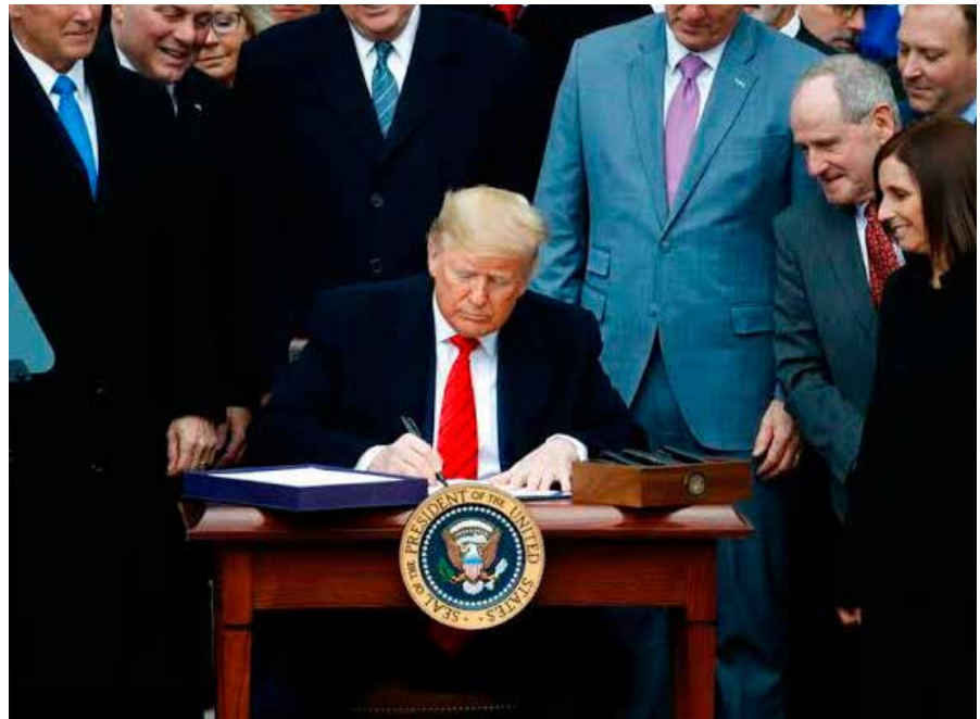
El presidente de EEUU, Donald Trump.

- Quintana Roo es un estado sumamente vulnerable al narcotráfico porque, además de tener una ubicación estratégica para enviar y recibir droga, concentra los destinos turísticos más importantes del Caribe, por lo que el consumo de drogas está al tope, entonces los grupos criminales se disputan el territorio constantemente para poder proveer. Por esto, solucionar el problema de inseguridad en Quintana Roo es más complicado que en otros lados de la república; sin embargo, no parece prioridad de los gobiernos hacer algo al respecto, pues somos testigos de cómo cada día la situación es peor.