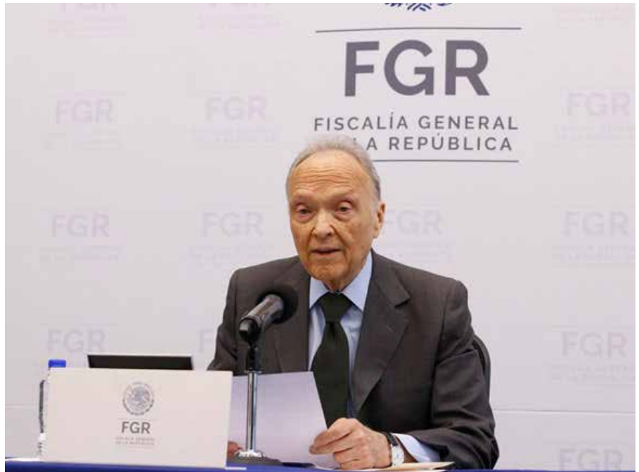
El fiscal General de la República, Alejandro Gertz Manero.

- Los expertos en Derecho con los que he podido hablar del tema critican que se desaparezca la figura de jueces de control, pues estos jueces daban mayor certeza jurídica a la impartición de justicia al poder valorar las pruebas sin tener que emitir una sentencia. Asimismo, están en contra de la implementación del Código Penal Único, porque el país es muy grande y cada región necesita contemplar sus propias peculiaridades dentro de su