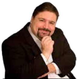
POR FRANCISCO SOLÍS PEÓN

A ELIDÉ, POR UNA IMPECABLE TRAYECTORIA EN EL SERVICIO PÚBLICO LOCAL.