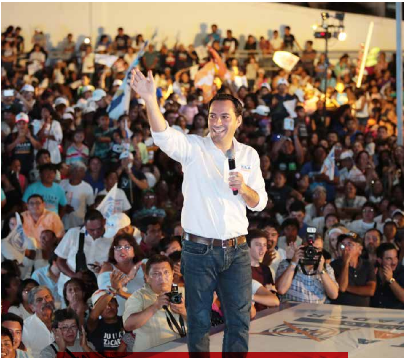
Mauricio Vila Dosal, ganador de las elecciones del 1 de julio de 2018, con lo que se convierte en virtual gobernador de Yucatán..