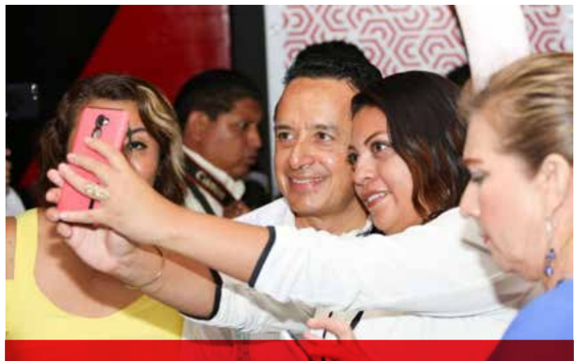
Tener más vuelos beneficiará a prestadores de servicios turísticos y a empresarios, afirmó el gobernador de Quintana Roo, Carlos Joaquín.