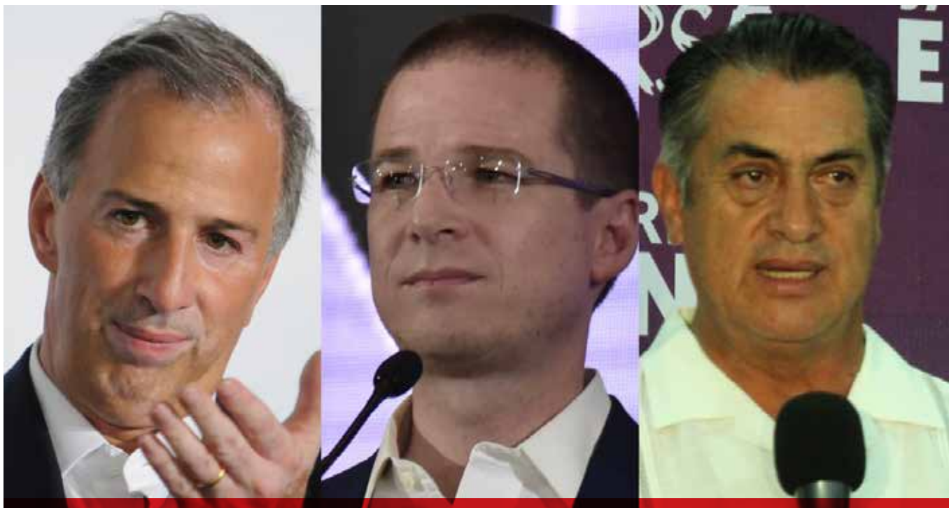
Los candidatos derrotados José Antonio Meade, Ricardo Anaya y Jorge Rodríguez, dieron una muestra de civilidad y congruencia al reconocer, sin condiciones, el triunfo de Andrés Manuel López Obrador.

que desplazó al PRI, en especial, en el territorio nacional a un lugar nada destacado en comparación con las posiciones que aún, a la fecha poseen, pero que ya se acerca también los cambios de estafetas, electas.