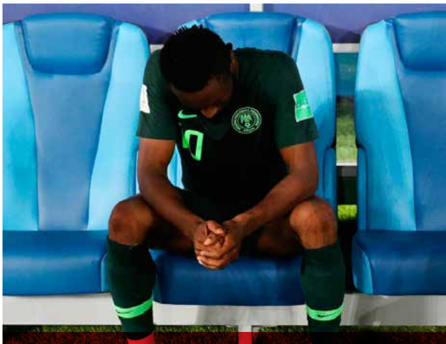
El capitán de las águilas verdes de Nigeria John Obi Mikel jugó contra Argentina mientras su padre era víctima de un secuestro.

Hablando del Grupo F se ha dicho de Alemania que nunca gana en territorio ruso. Lo cierto es que vive un invierno en sus relaciones exteriores con una Angela Merkel impotente ante la intransigencia de Trump. De México todos sabemos: ese partido contra