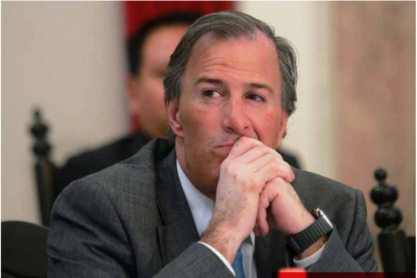
José Antonio Meade Kuribreña, del PRI.

E l pasado regresó a México de mano de una nueva versión del PRI reencarnado en Morena.