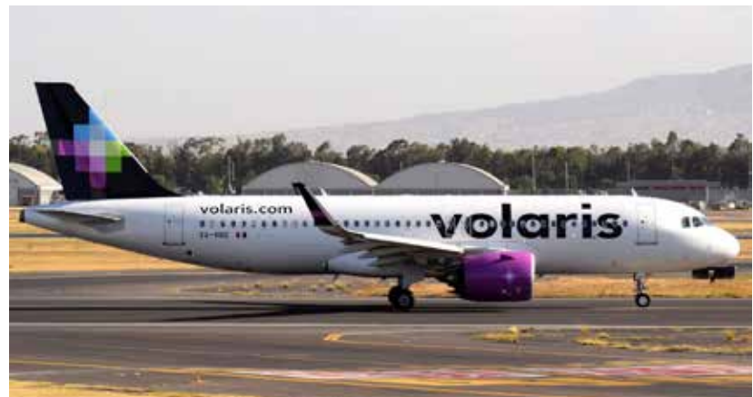
La aerolínea Volaris aumentó sus vuelos entre la Ciudad de México y la capital del Estado.

En la zona sur, Chetumal, Bacalar, Mahahual, Calderitas, Xul Ha y Huay Pix ofertan más de tres mil 600 cuartos en 199 hoteles y eco-villas.