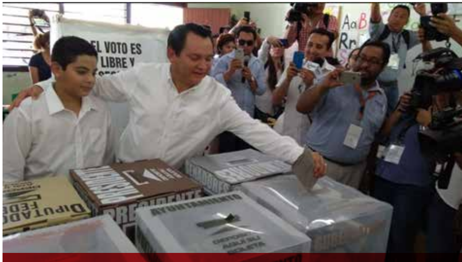
Joaquín Díaz Mena, tal como vaticinó, logró romper el bipartidismo tradicional PRI-PAN en Yucatán.

Los primeros resultados de la elección del domingo pasado colocan un nuevo escenario político en Yucatán en donde de ser la primera fuerza política, el PRI podría acabar en tercer lugar ante lo que sería su derrota en el gobierno del Estado, alcaldía de Mérida y en 6 de los distritos electorales locales relacionados con la ciudad capital.