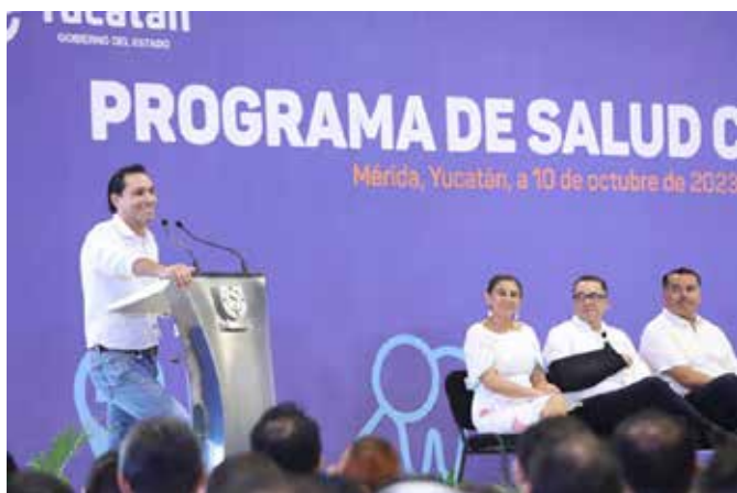
ACOMPAÑADO DEL ALCALDE DE MÉRIDA, RENÁN BARRERA CONCHA, Y DE LA DIPUTADA FEDERAL, CECILIA PATRÓN, EL GOBERNADOR PRESENTÓ LOS DETALLES DE LA TARJETA UNIVERSAL DE SALUD.