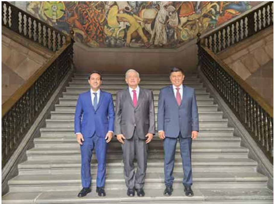
EL GOBERNADOR MAURICIO VILA DOSAL ASUMIÓ LA PRESIDENCIA DE LA CONFERENCIA NACIONAL DE GOBERNADORES (CONAGO), EN LA FOTOGRAFÍA POSA CON EL PRESIDENTE LÓPEZ OBRADOR Y EL GOBERNADOR DE OAXACA Y PRESIDENTE SALIENTE DE LA CONAGO, SALOMÓN JARA CRUZ.

El Gobernador resaltó que no hay que dejar de lado que muchos Gobernadores se encuentran al cierre de sus administraciones, por lo que es de vital importancia que los proyectos y acciones se encuentren en una lógica de coordinación, ya que muchos de ellos serán la base de lo que le permitirá a México ser un país más productivo y más próspero.