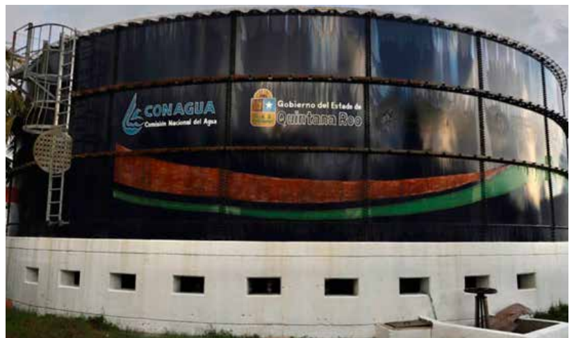
EL TANQUE DE REGULACIÓN DE MIL 500 METROS CÚBICOS DE CAPACIDAD, DE LA COLONIA ALTAMAR, GARANTIZA AGUA POTABLE PARA 8 MIL 800 HABITANTES DE LA ZONA.