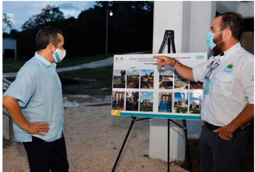
EN LA PLANTA DE TRATAMIENTO DE AGUAS RESIDUALES, SAN MIGUELITO, SE HAN CANALIZADO RECURSOS POR 57 MILLONES 364 MIL 895 PESOS, EN DOS AÑOS.

Finalmente, la comitiva se trasladó a la colonia Altamar, donde el gobernador Carlos Joaquín constató los trabajos de rehabilitación y activación del tanque de regulación de mil 500 metros cúbicos de capacidad de la colonia Altamar, cuyo tanque de agua potable garantiza el servicio óptimo para 8 mil 800 habitantes de la zona. R