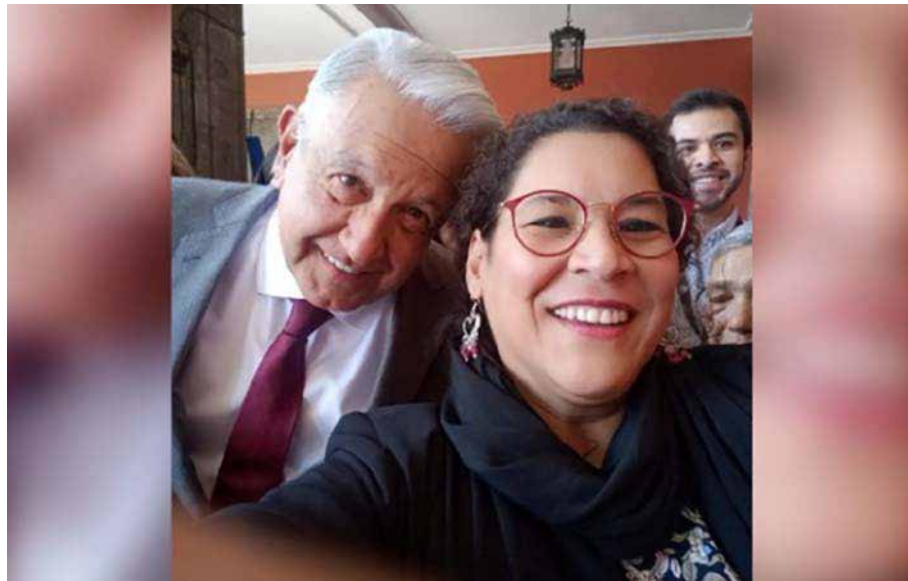
EL PRESIDENTE ANDRÉS MANUEL LÓPEZ Y LENIA BATRES.

CDMX.- ¡Por fin hubo humo blanco! ¡Por fin tenemos nueva ministra de la Suprema Corte de Justicia de la Nación (SCJN)! -exclamó con tono alegre el analista para dar inicio a la plática de esta semana en el Balmoral- Lenia Batres Guadarrama será ministra de la Corte por los próximos 15 años tal y como establece nuestra Constitución.