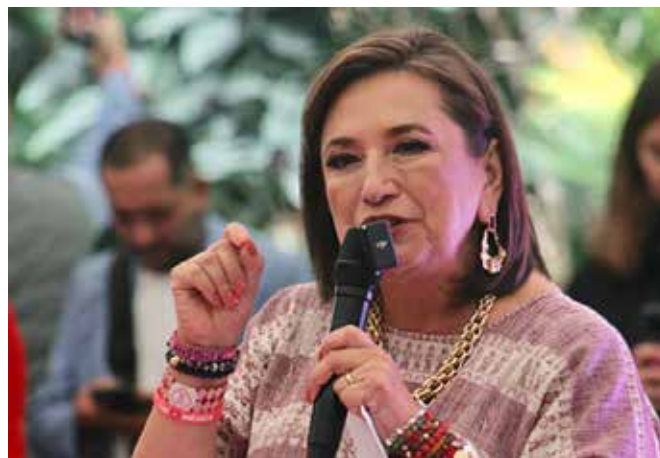
XÓCHITL GÁLVEZ, ADVIRTIÓ QUE LA ENTRADA DE BATRES A LA CORTE SIGNIFICA UN ATENTADO CONTRA DE LA AUTONOMÍA DE ESTA INSTITUCIÓN.

-Si bien, es cierto que existe el riesgo de que la designación de Batres termine por afectar de manera negativa la autonomía de la Corte, me parece que sería incorrecto dar por hecho que eso sucederá pues, como bien dice nuestro amigo político, los ministros que han sido propuestos por López Obrador se han posicionado en contra del mandato presidencial cuando ha sido necesario. -concluyó la abogada- Creo es mejor que aprovechemos este momento para celebrar que, por primera vez en la historia, hay 5 de los 11 ministros son mujeres. Sin duda es un momento histórico para nuestro país. R