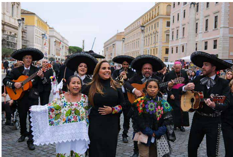
UNA EXHIBICIÓN DE 40 FOTOGRAFÍAS QUE ILUSTRAN LA HISTORIA, EL TURISMO Y LA VIDA EN COMUNIDADES INDÍGENAS DE QUINTANA ROO, SE MONTÓ EN LA VÍA DE LA CONCILIAZIONE, DURANTE LA CELEBRACIÓN DE LOS 15 AÑOS DE LA NAVIDAD MEXICANA EN EL VATICANO.

Asimismo, la Gobernadora encendió el Árbol de Navidad que mide 4 metros y fue decorado con diferentes artesanías en forma de estrella y esferas hechas con bejuco, así como sombreros que usan las mujeres mayas en la danza del Maya Pax y presentó el nacimiento decorado por artesanos de Quintana Roo.