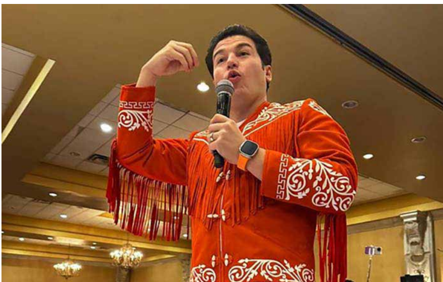
SAMUEL GARCÍA, GOBERNADOR DE NUEVO LEÓN.

-El tiempo dirá cuál será el desempeño y las prioridades que tendrá la ministra Batres en la SCJN. Por mientras, ella es la quinta persona que López Obrador en entrar a la Corte durante el sexenio de López Obrador. Recordemos que el