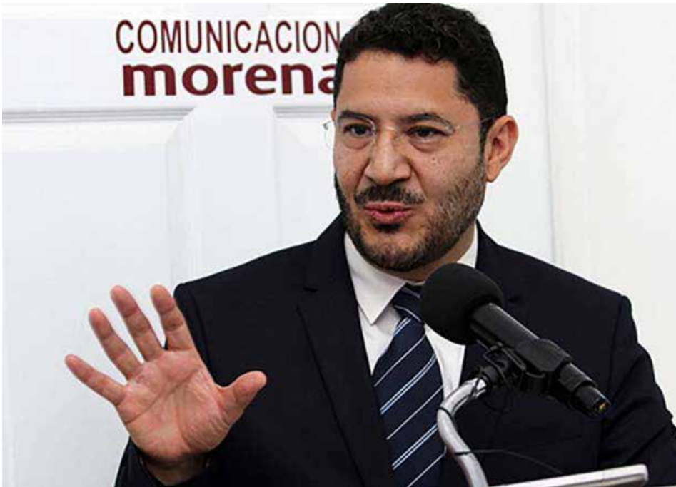
MARTÍ BATRES GUADARRAMA, ACTUAL JEFE DE GOBIERNO DE LA CDMX.

-Que es lo que sucedió en esta ocasión. -comentó el escritor