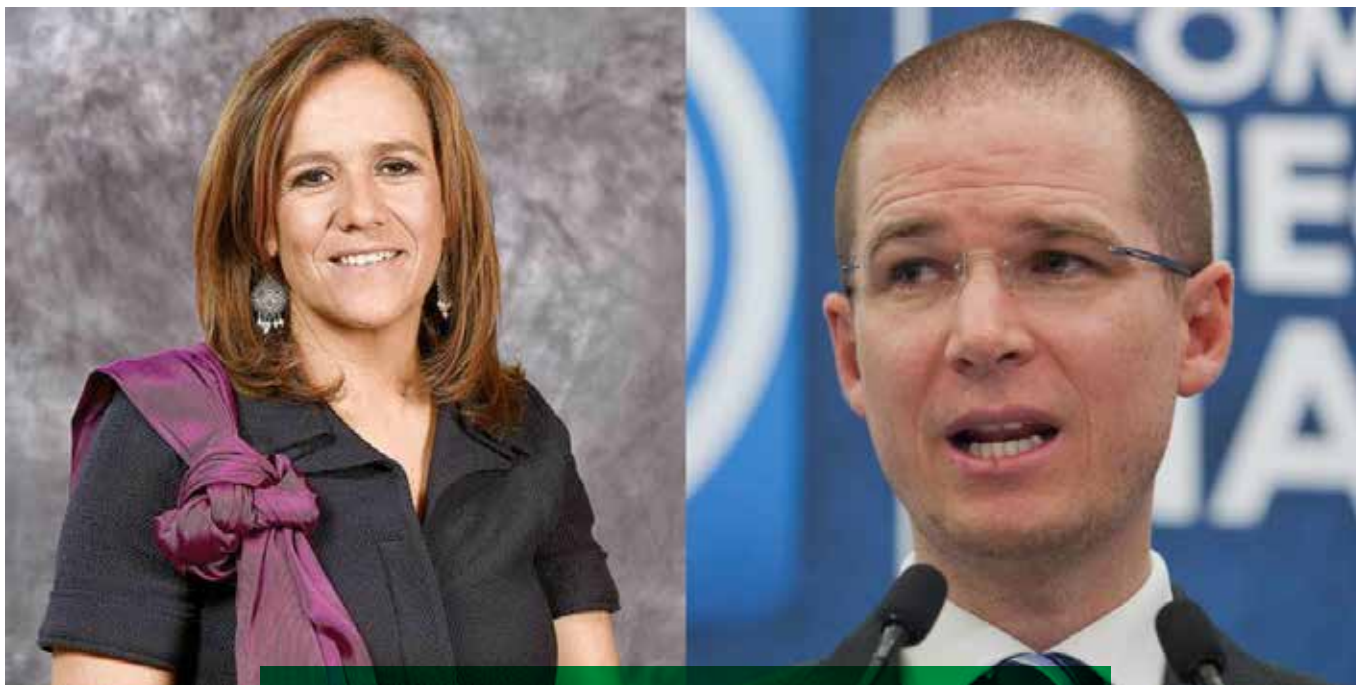
Ni Ricardo Anaya, presidente nacional del PAN vio venir la renuncia de Margarita Zavala.

Enrique Rébsamen y la corrupción que le permitió al malogrado colegio operar sin la supervisión efectiva sobre la seguridad.