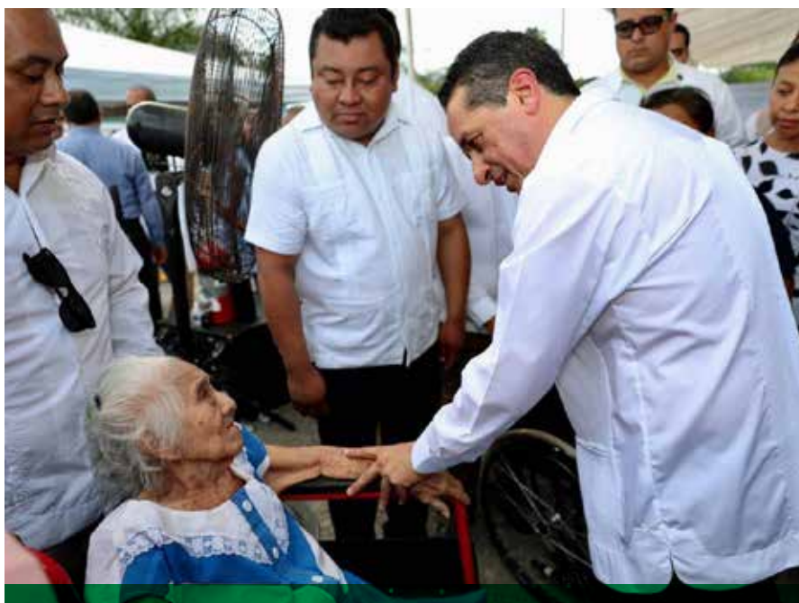
El titular del Ejecutivo encabezó la conmemoración de los 20 años del programa federal "Prospera".

"Cuando iniciamos la administración, el 70 por ciento de los quintanarroenses tenían alguna carencia social y el 20.8 por ciento presentaban tres o más carencias, de acuerdo con el Consejo Nacional de Evaluación de la Política de Desarrollo Social (CONEVAL). La entidad no puede continuar con tal rezago y por ello asumimos la gran responsabilidad de ser el gobierno del cambio, el que administre y aplique los recursos económicos, llevando