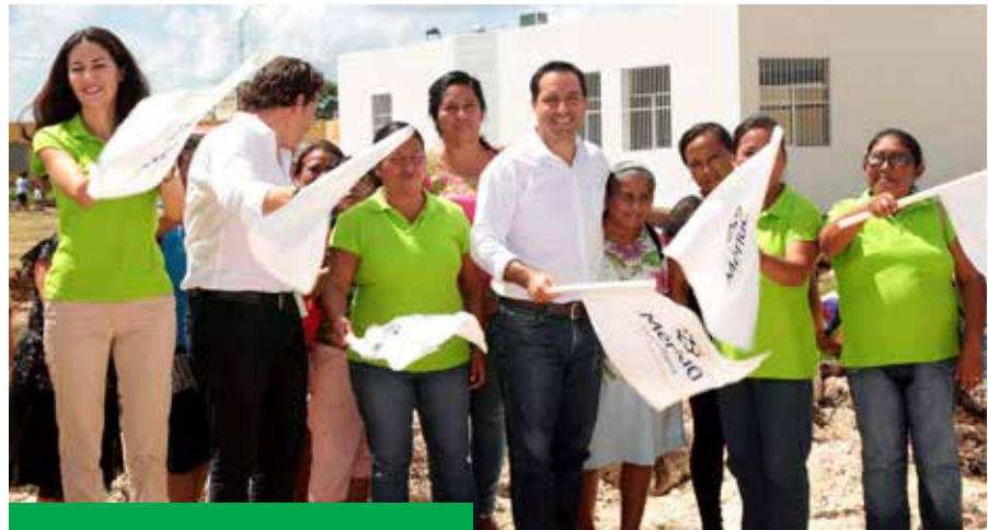
El alcalde Mauricio Vila Dosal supervisó el inicio de la construcción del Centro Integral del Sur.

El Centro Integral del Sur, en el que se invirtieron $15 millones y beneficiará