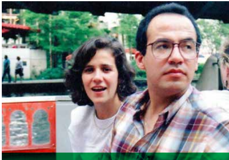
Margarita Zavala y Felipe Calderón.