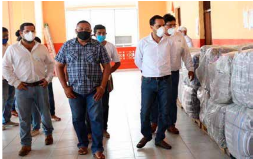
EL GOBERNADOR MAURICIO VILA DOSAL.

En el anuncio del martes por la noche, se puede analizar y opinar desde diferentes visiones. Lo que sí quedó claro, es que Don Mauricio Vila, ante la presión que pudiera tener con tanta carga de trabajo, no le ha hecho perder el enfoque en el matiz de gobierno. Se dictaron medidas que deben ayudar a las estrategias implementadas por su gobierno, ante las cifras, la realidad por dura que sea, es cuando se tiene que sacar ese valor que implica encabezar en buena parte el destino de casi dos millones de habitantes de Yucatán . Sus colaboradores especializados en las áreas de salud y sus colaterales preparados, leales y firmes; tienen el sólido compromiso de olvidarse, por el momento, de cualquier distracción, incluso la partido-electoral; hoy es tiempo de agrupar lo mejor de su grupo y sacar de la mejor manera