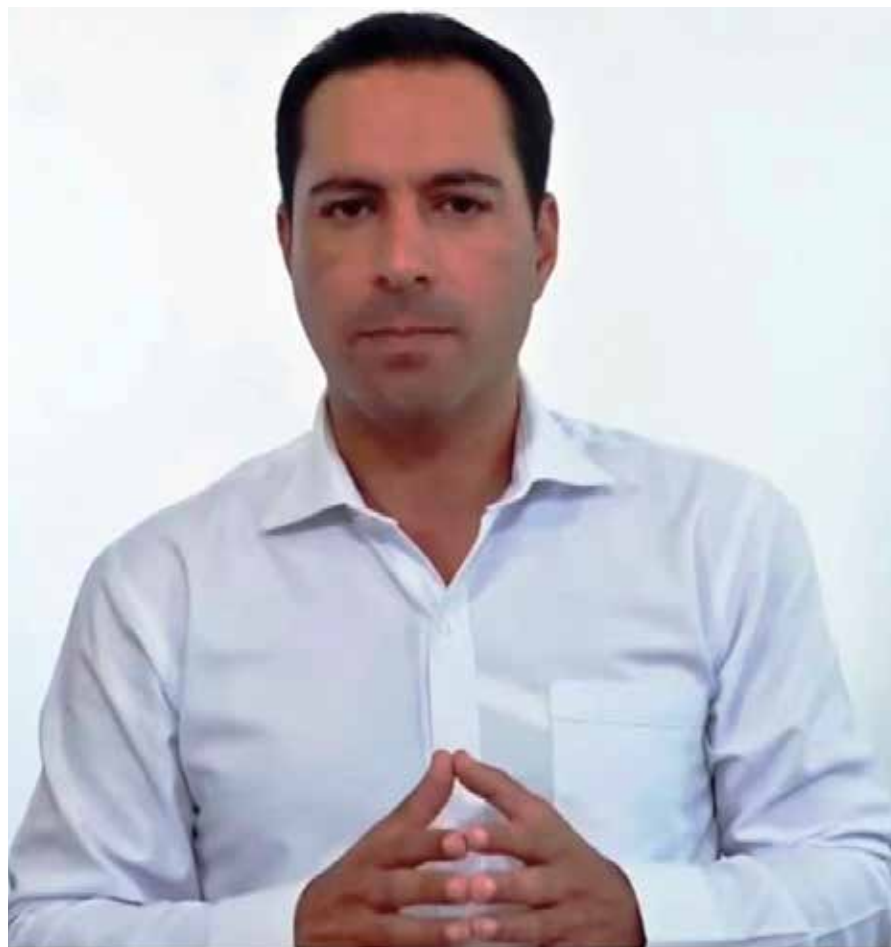
El gobernador, Mauricio Vila Dosal emitió un energético mensaje a la sociedad yucateca.

- En general se percibió una respuesta positiva a la decisión, pues se entendía que era necesario mitigar los contagios; de hecho, el gobernador ganó popularidad luego que fuese criticado hace algunas semanas por actos como la iluminación del muelle de Progreso a favor de los trabajadores de la salud, lo cual fue recibido como un acto de frivolidad. – respondió la empresaria – Creo que influyó que la medida no se haya presentado como un toque de queda, sino como un tipo de restricción vial, para que haya sido