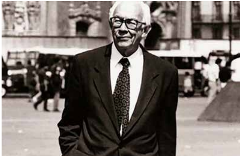
HEBERTO CASTILLO MARTÍNEZ, INGENIERO Y POLÍTICO MEXICANO, CANDIDATO PRESIDENCIAL POR EL PARTIDO MEXICANO SOCIALISTA EN LAS ELECCIONES FEDERALES DE 1988. FUE MIEMBRO FUNDADOR DE VARIOS PARTIDOS, ENTRE ELLOS EL PROPIO PMS, EL PARTIDO MEXICANO DE LOS TRABAJADORES Y EL PARTIDO DE LA REVOLUCIÓN DEMOCRÁTICA.

A su vez, Heberto Castillo relata cómo fue encañonado en el estacionamiento de San Lázaro por haber querido acceder al salón de sesiones por la entrada que usa desde el inicio de la 53 Legislatura. Afirma que se había abierto paso, pese a que un militar le había advertido que dispararía sobre él. “Quienes no nos dejaban pasar eran dos chamaquitos armados”, relatará más tarde al reportero y avezado cronista