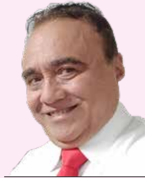
POR ISMAEL MÉNDEZ CAMARGO

Empezó la llamada cuota de enero, luego de un mes lleno de gastos y despilfarros con motivos navideños y fiestas decembrinas, que las familias disfrutaron con el apoyo de bonos especiales, aguinaldos y engañosas promociones, que a nivel nacional invadieron el panorama de las compras, con ofertas engañosas de las tiendas departamentales, y nuestra Mérida no podían escapar de tentaciones subyugantes, sin pensar que en el año que empezó vendrían unas cascadas de pagos y erogaciones como cada principio de año, que volvieron a la triste realidad a muchas familias que ahora reniegan de todo lo que se llame pagos de toda índole, y los prediales acaparan el escenario monetario del dos mil veintitrés.