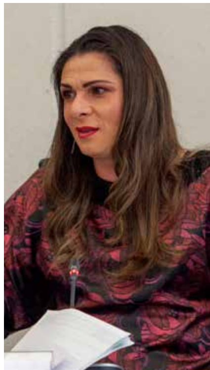
Ana Gabriela Guevara, titular de la Conade, sigue en el ojo del huracán.

de Energía, el Instituto Federal de Telecomunicaciones, y la Comisión Federal de Competencia Económica. – informó la reportera – Ignoro si fue coincidencia, o si el senador supuso que ya contaba con la mayoría para pedir una sesión extraordinaria, pero lo cierto es que la iniciativa ya se turnó a las comisiones correspondientes del Senado.