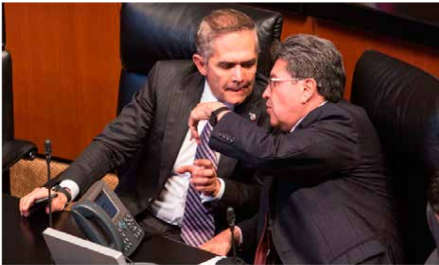
Los senadores, Miguel Ángel Mancera y Ricardo Monreal.

al PRD mantener sus derechos como bancada hasta ahora? – preguntaron en la mesa