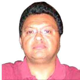
POR FRANCISCO LÓPEZ VARGAS

entregó un día antes dándoles la opción de quitar el nombre del periódico incluido como uno de los promotores de una Frente Amplio Opositor.