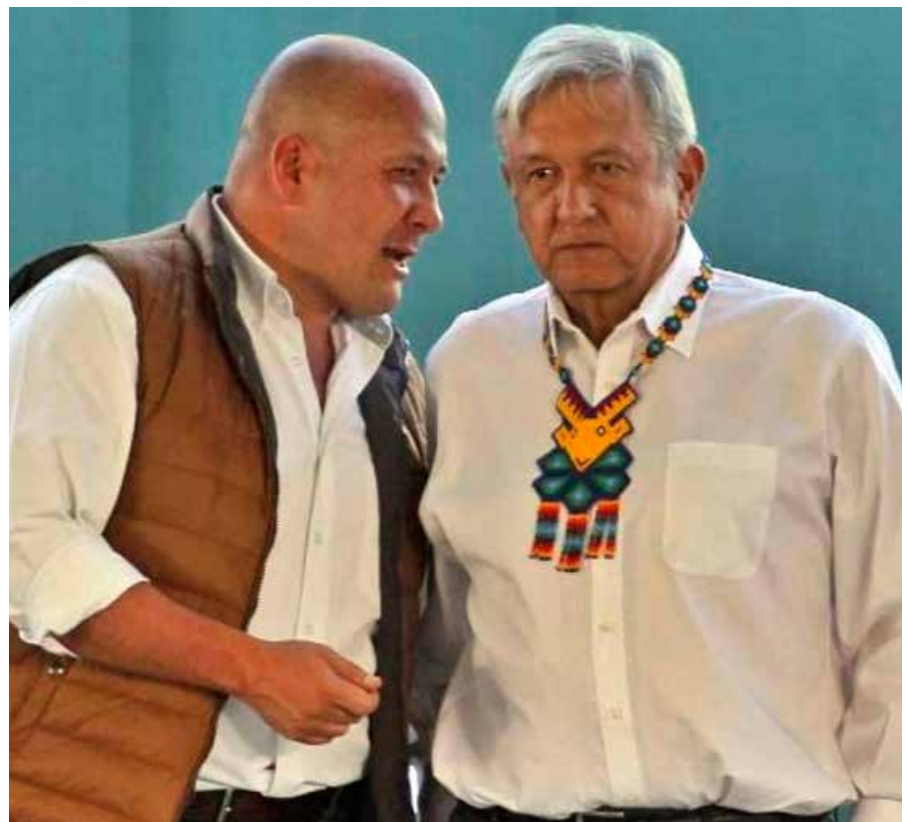
El gobernador de Jalisco, Enrique Alfaro y el presidente López Obrador.