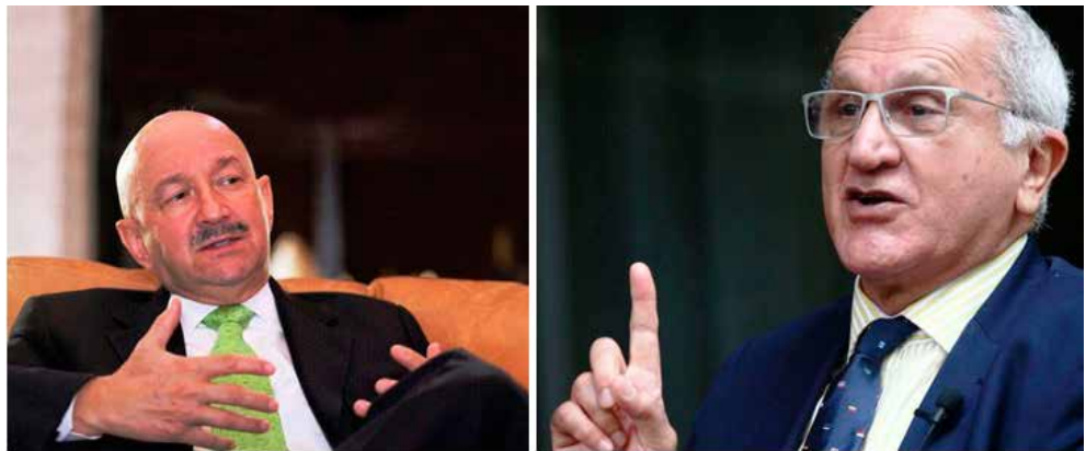
CARLOS SALINAS DE GORTARI Y JESÚS SEADE KURI.

“Estamos ayudando de alguna manera a facilitar el diálogo –me dijo–, pero si no se resuelve vamos a tener consecuencias por todos los lados, porque la economía global hoy está muy interrelacionada. Un tercio de los productos que circulan alrededor del mundo son fabricados en por lo menos dos países; entonces creo que las tensiones entre esos países