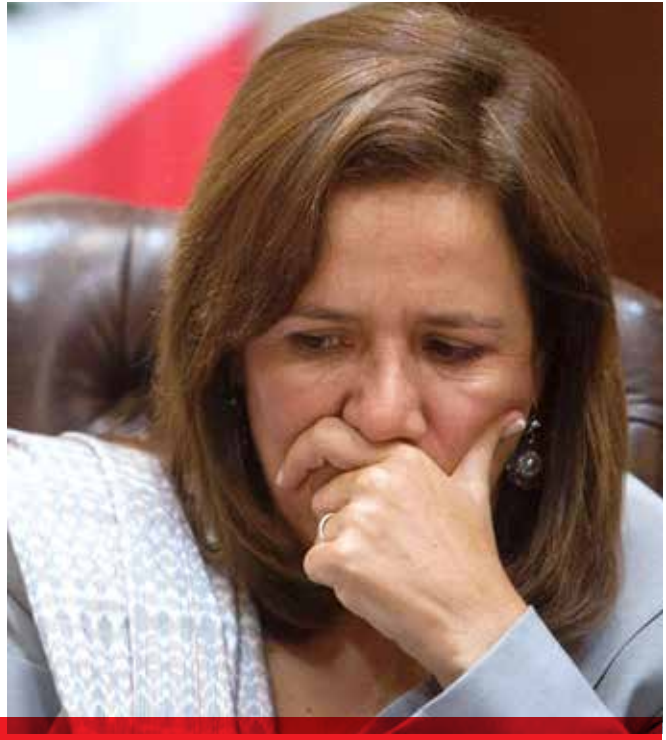
Claudia Ruiz Massieu, secretaria general del PRI, y Margarita Zavala Gómez del Campo, ex candidata independiente a la Presidencia.

Ya con el ambiente a todo esplendor por las fiestas patrias, nuestros enlaces nacionales de la Ciudad de México, se dieron el tiempo para compartir de nuevo esa mesa plural de análisis político y gobierno desde las inmediaciones del Centro Histórico. Comentan que ellos no tienen problema con las medidas de austeridad implantadas en la moda Morenista; pues siempre cada uno de los integrantes de este constante grupo, sacan de sus bolsillos para la tradicional cuenta final y el abultado símbolo de la propina desde hace muchos años. Así que, se sienten adelantados a los formatos actuales referentes a alimentos con dinero de los erarios.