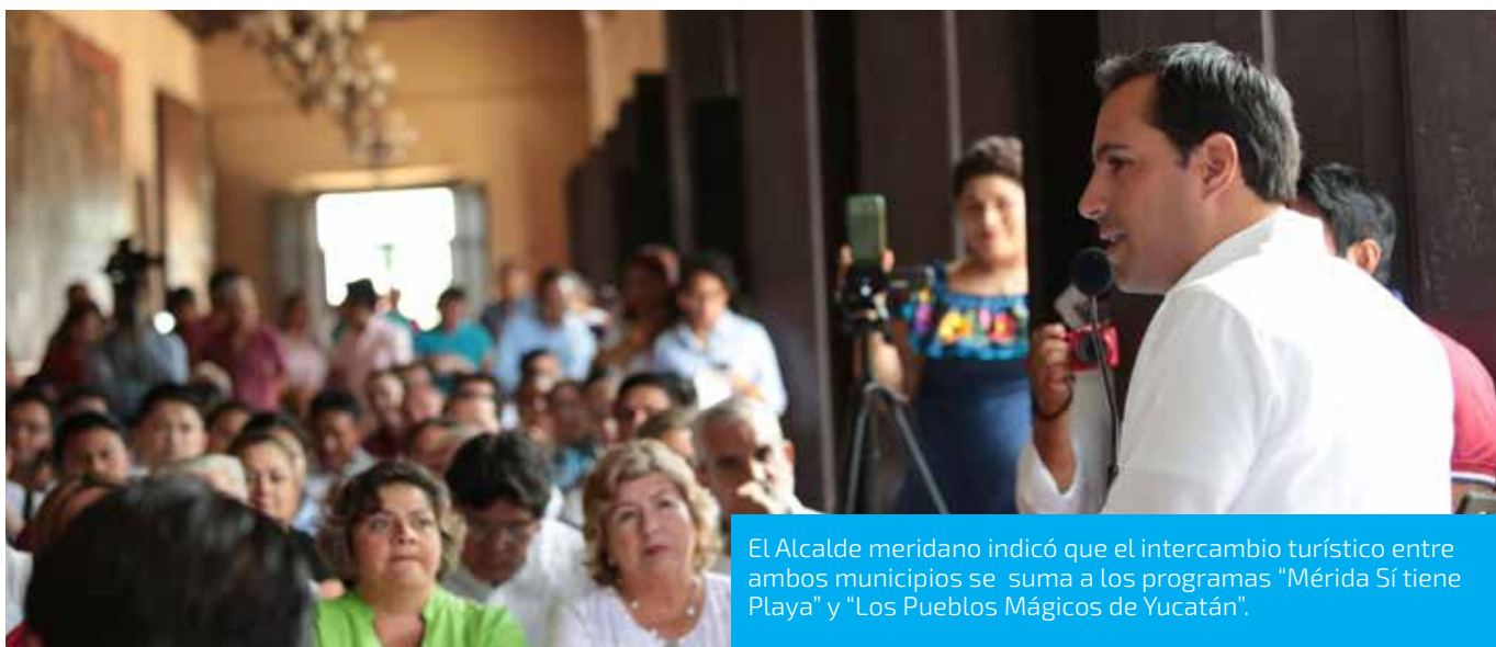
El Alcalde meridano indicó que el intercambio turístico entre ambos municipios se suma a los programas "Mérida Sí tiene Playa" y "Los Pueblos Mágicos de Yucatán".