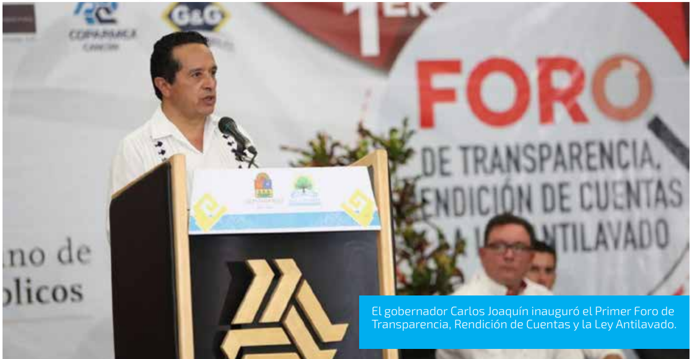
El gobernador Carlos Joaquín inauguró el Primer Foro de Transparencia, Rendición de Cuentas y la Ley Antilavado.