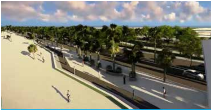
Para Ciudad del Carmen, el mandatario reveló que se construirá el malecón "Nelson Barrera", tendrá un ancho de 34 metros y dará una nueva imagen a esta zona de la ciudad.

informó, con una inversión de prácticamente 100 millones de pesos, se colocaron seis mil 851 luminarias tipo LED, en diversos municipios, y Campeche es el primer estado del país en contar con la Estrategia para la Reducción de Emisiones por Deforestación y Degradación.