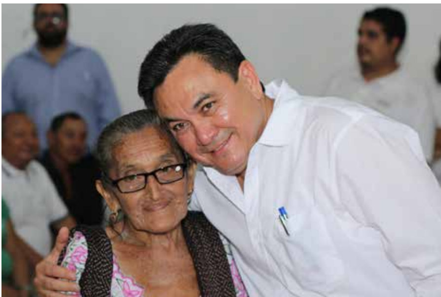
El #AmigoLibo es considerado un "líder" por su ascendencia política en el oriente del Estado.

Finalmente, confió en que su partido, el PRI, determine sus candidaturas en forma transparente y que pueda alcanzar triunfos importantes en las elecciones del 2018. R