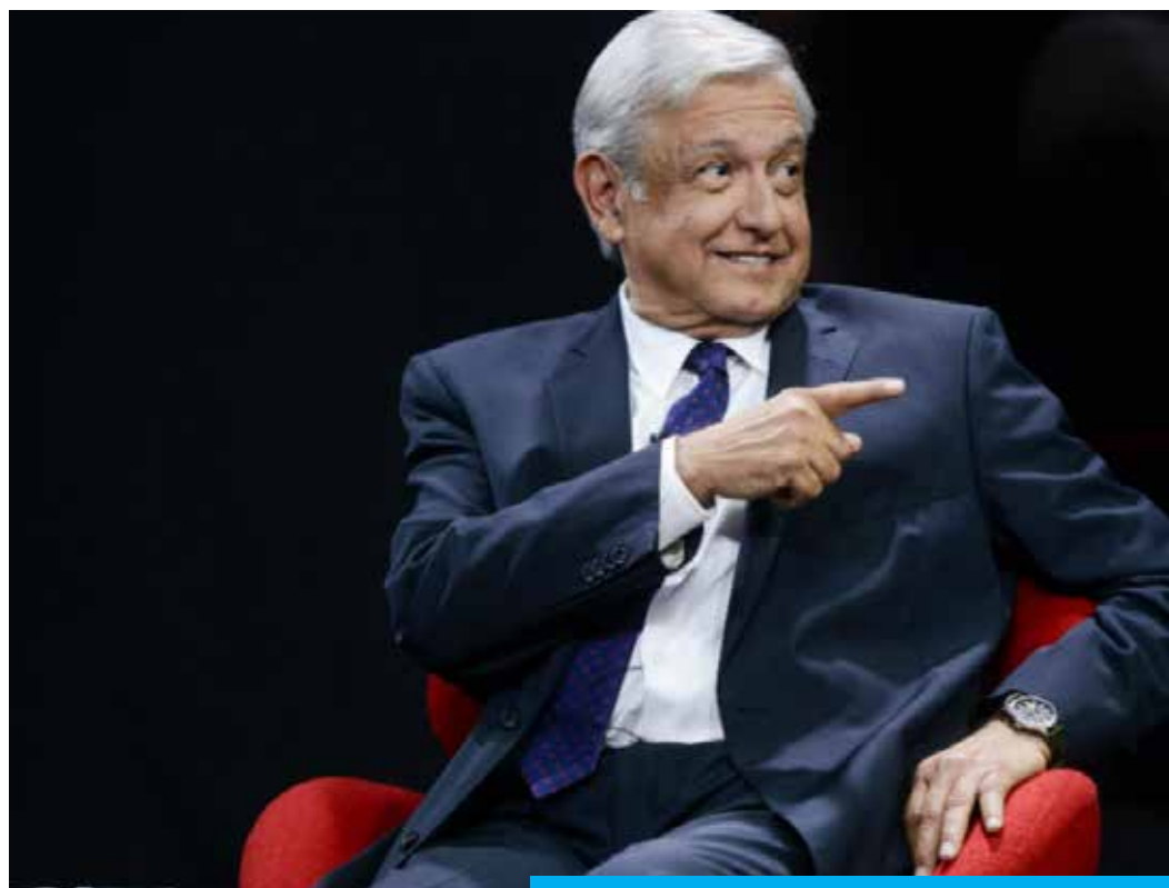
Andrés Manuel López Obrador y Carlos Salinas de Gortari.

abusos ni su corrupción e impunidad. Sin embargo, usando una fantasía, Ivonne Ortega, la desprestigiada ex gobernadora de Yucatán, vende su activismo por “la militancia” pero se niega a aceptar que lo hace para que