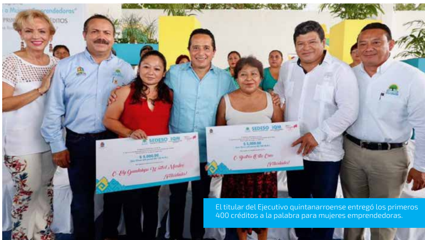
El titular del Ejecutivo quintanarroense entregó los primeros 400 créditos a la palabra para mujeres emprendedoras.