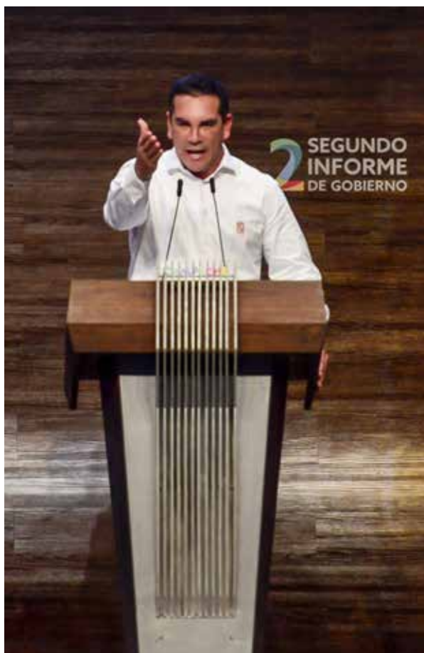
El titular del Ejecutivo envió un mensaje a la sociedad campechana informando sobre las acciones emprendidas para el desarrollo de la entidad.

Desde el Centro de Convenciones "Campeche XXI", donde también se dieron cita políticos y funcionarios nacionales y de otras entidades del país, durante hora y media el mandatario campechano dio lectura a un mensaje que incluyó un video alusivo al Segundo Informe de Gobierno y la presentación de dos renders (video de imágenes digitales de 3D) de obras comprometidas y que ya están en ejecución, así como de ocho nuevas, las cuales dijo se construirán en los próximos meses y complementarán el proyecto transformador que se ha iniciado en la entidad.