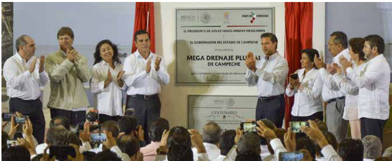
El presidente Enrique Peña Nieto y el gobernador Alejandro Moreno Cárdenas develaron la placa inaugural del megadrenaje de la ciudad de Campeche.

construcción de la Ciudad de la Mujer, e indicó que luego de siete años de que permaneció cerrado, este día se inaugura el nuevo teatro de la ciudad "Francisco de Paula Toro", cuya rehabilitación integral fue posible con la aportación total del gobierno federal.