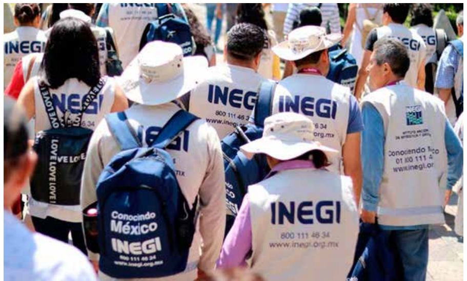
Los encuestadores del INEGI, encargados del censo 2020 se tuvieron que regresar a sus casas ante la contingencia sanitaria.

- Cuando se reconoció la emergencia sanitaria y se inició la campaña de Sana Distancia, el Instituto Nacional de Estadística y Geografía dispuso no cancelar el censo poblacional, sino tomar medidas de seguridad para continuarlo, pero tras declarar la alerta sanitaria, el Consejo de Salubridad General optó por suspenderlo. - explicó el consultor