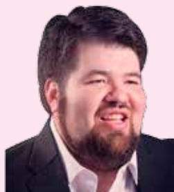
POR EDWIN CARCAÑO GUERRA Instagram: @ecarcanog

El día 30 de marzo de 1965 una fuerte explosión sacudió la Embajada Americana en Saigón. El ataque perpetrado por el Vietcong dejó 22 muertos y 183 heridos. La Guerra de Vietnam es un episodio muy oscuro de la historia.