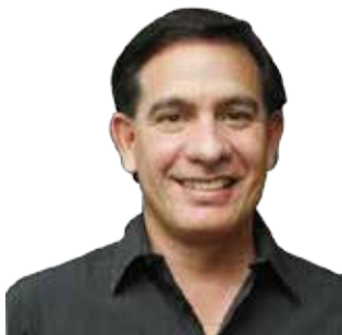
Por Carlos Mena Baduy