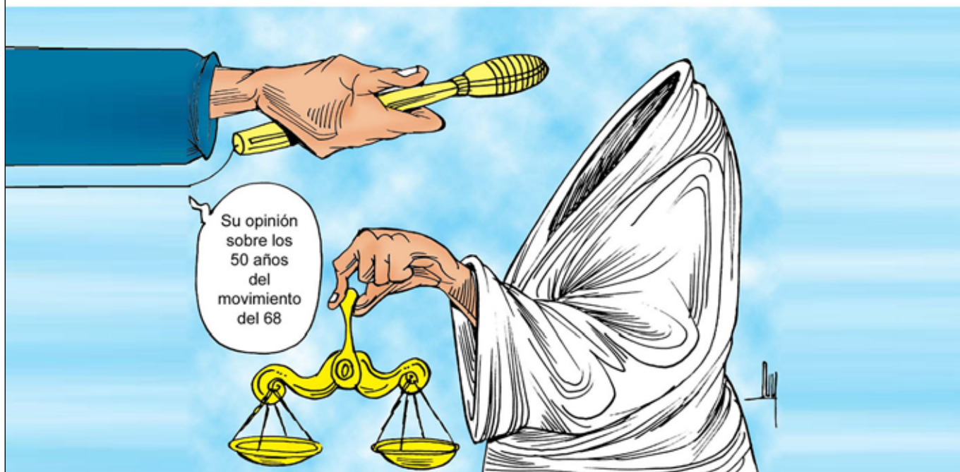
IMAGEN DE TLATELOLCO LUY