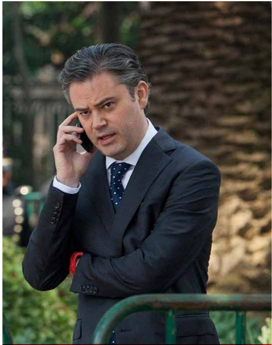
Aurelio Nuño Mayer, coordinador de campaña de José Antonio Meade.

Mientras López Obrador cobija a todo aquel que se le acerca, en ello hay que decir que no toda esa suma |R▶