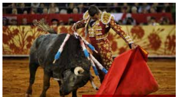
José María Manzanares.