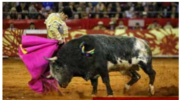
Julián López "El Juli".