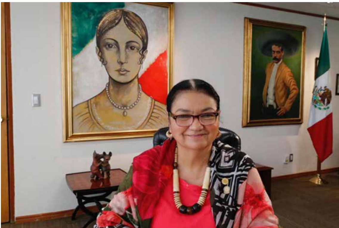
LA DOCTORA DULCE MARÍA SAURI RIANCHO, ACTUAL DIPUTADA FEDERAL.

El pasado sábado 6 de mayo, el Consejo Político del PRI Yucatán se reunió con el objetivo de definir el método que habrá de utilizar para la renovación de su dirigencia estatal. Con una contundente mayoría, las y los consejeros yucatecos votaron en favor de un proceso de consulta a la base priista para elegir a las personas que encabezarán la Presidencia y la Secretaría General del tricolor en el Estado.