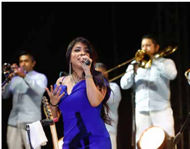
LOS DE IZTAPALAPA COMPARTIERON LO MEJOR DE SU REPERTORIO CON LAS MAMÁS DE MÉRIDA.