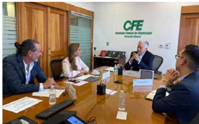
LA GOBERNADORA MARA LEZAMA GESTIONA ANTE LA CFE LA RECLASIFICACIÓN DE TARIFAS.

Tras una reunión con el director general de la Comisión Federal de Electricidad (CFE) Manuel Bartlett Díaz, la gobernadora Mara Lezama Espinosa gestionó y obtuvo una inversión de