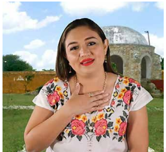
HISELLE DÍAZ DEL CASTILLO. PRESIDENTA MUNICIPAL DE CONKAL, Y DIRIGENTE ESTATAL DE LA FEDERACIÓN NACIONAL DE MUNICIPIOS DE MÉXICO (FENAMM).