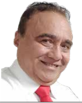
POR ISMAEL MÉNDEZ CAMARGO

EL PROYECTO ESTRELLA DEL PRESIDENTE LÓPEZ OBRADOR FUE DESDE UN PRINCIPIO EL TREN MAYA.