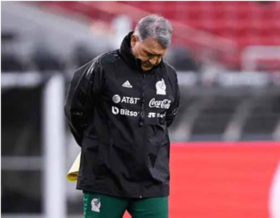
GERARDO "TATA" MARTINO, DIRECTOR TÉCNICO DE LA SELECCIÓN, PRINCIPAL RESPONSABLE DEL FRACASO DE LA SELECCIÓN MEXICANA DE FÚTBOL.

-Así es, amigo editorialista. -asintió la periodista- Para que México pasara a la siguiente ronda, necesitaba ganarle a Arabia Saudita por diferencia de 3 goles y también necesitaba que Argentina venciera a Polonia por diferencia de 2 goles. Esto porque, en ese caso, Polonia y México hubiesen empatado en puntos y la diferencia de goles le hubiese permitido a nuestra selección clasificarse.