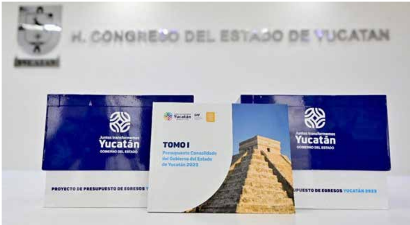
IMAGEN DEL PAQUETE ECONÓMICO 2023, QUE INTEGRAN LA LEY DE INGRESOS, LEY DE HACIENDA, EL PRESUPUESTO DE EGRESOS Y LOS CRITERIOS GENERALES DE POLÍTICA ECONÓMICA, QUE SERÁ SOMETIDO A ANÁLISIS Y APROBACIÓN EN EL CONGRESO DEL ESTADO.

El proyecto contempla la modernización de la educación, al aumentar su presupuesto en 1,364 millones de pesos (11%), con clases de inglés, la ampliación de matrícula en ciencias de la computación y con la apertura de la ingeniería en ciberseguridad.