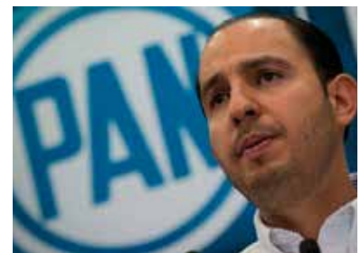
MARKO ANTONIO CORTÉS MENDOZA, LÍDER NACIONAL DEL PAN.