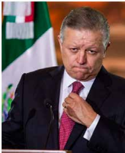
Alejandro Gertz Manero y Arturo Zaldívar, Fiscal General de la República y Presidente de la SCJN, respectivamente.

que lo hayas olvidado, te recordaré las partes más importantes del discurso de Andrés Manuel. –propuso el consultor – Inició su discurso hablando justamente del combate contra la corrupción, al afirmar que no se han hecho persecuciones facciosas ni venganzas políticas, lo cual podemos constatar todos al ver que a Emilio Lozoya se le ofreció un criterio de oportunidad para que México pudiese saber más del saqueo que se hizo al presupuesto nacional.