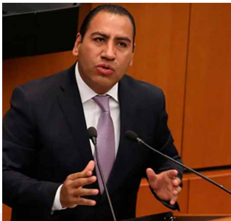
EDUARDO RAMÍREZ, LÍDER DE LA BANCADA DE MORENA EN EL SENADO.