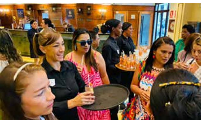
IMÁGENES DE IBEROSTAR PARQUE CENTRAL, DE LA HABANA, UNO DE LOS HOTELES QUE INCLUYÓ LA AGENDA DE VISITAS DEL SEMINARIO ORGANIZADO POR EL INSTITUTO INTERNACIONAL DE PERIODISMO "JOSÉ MARTÍ", QUE RESULTÓ TODO UN ÉXITO.