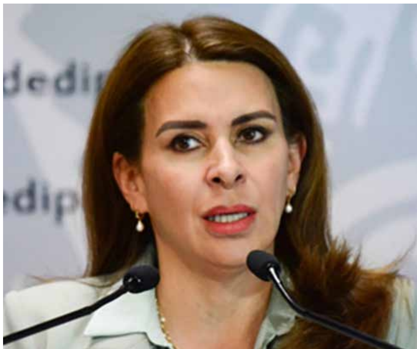
LA SECRETARIA GENERAL DEL PRI, CAROLINA VIGGIANO.

-Definitivamente, las renunciaciones generaron gran revuelo en el panorama político y pusieron en una posición incómoda al Frente Amplio por México pues están en un momento en el cual buscan mostrar una cara de unidad ante el electorado. -concluyó la empresaria- Vale la pena seguir atentos al actuar de los senadores que renunciaron y cómo su decisión impactará en el futuro del PRI y de la oposición en México. R