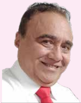
POR ISMAEL MÉNDEZ CAMARGO

La obtención de los condones se hace cada día más difíciles ante la ignorancia de ciertos sectores de la población que se oponen a la distribución de los mismos, con el argumento de que solo es facilitar los contactos sexuales entre la juventud y se ha comprobado en las farmacias del sector privado que la venta de los preservativos ha ido aumentando al evolucionar dichos