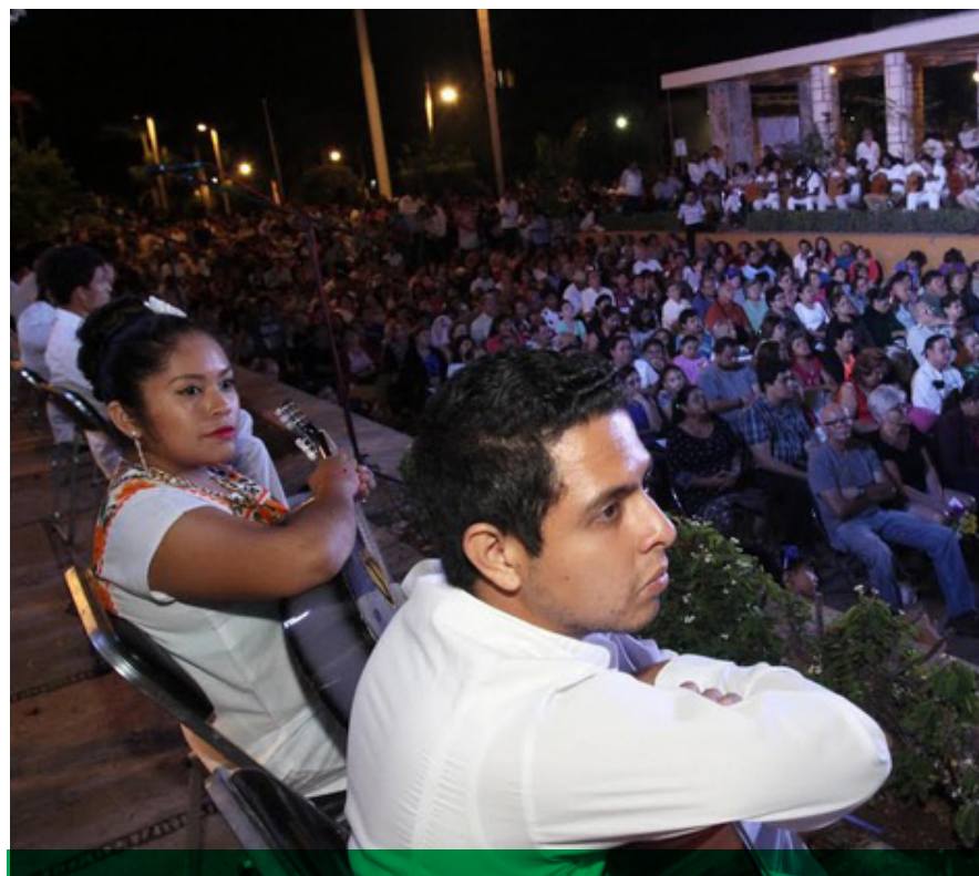
Más de 300 artistas, en su mayoría jóvenes dieron muestra de su arte y su generosidad al brindar una noche espléndida.