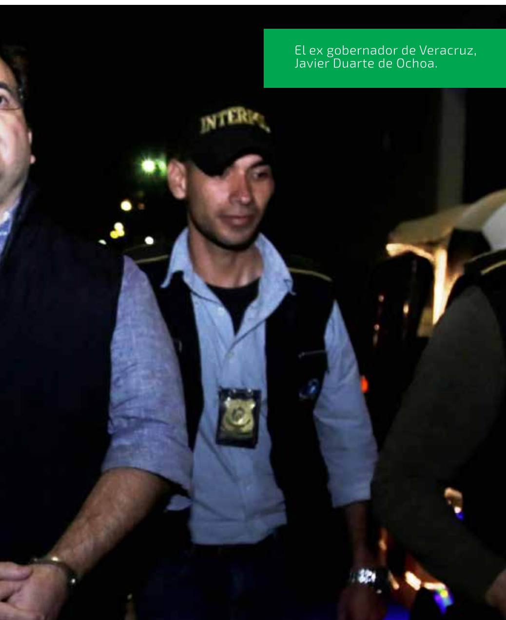
El ex gobernador de Veracruz, Javier Duarte de Ochoa.

Y el pueblo de México ya dio muestras de solidaridad ante decisiones del gobierno en beneficio del país. R