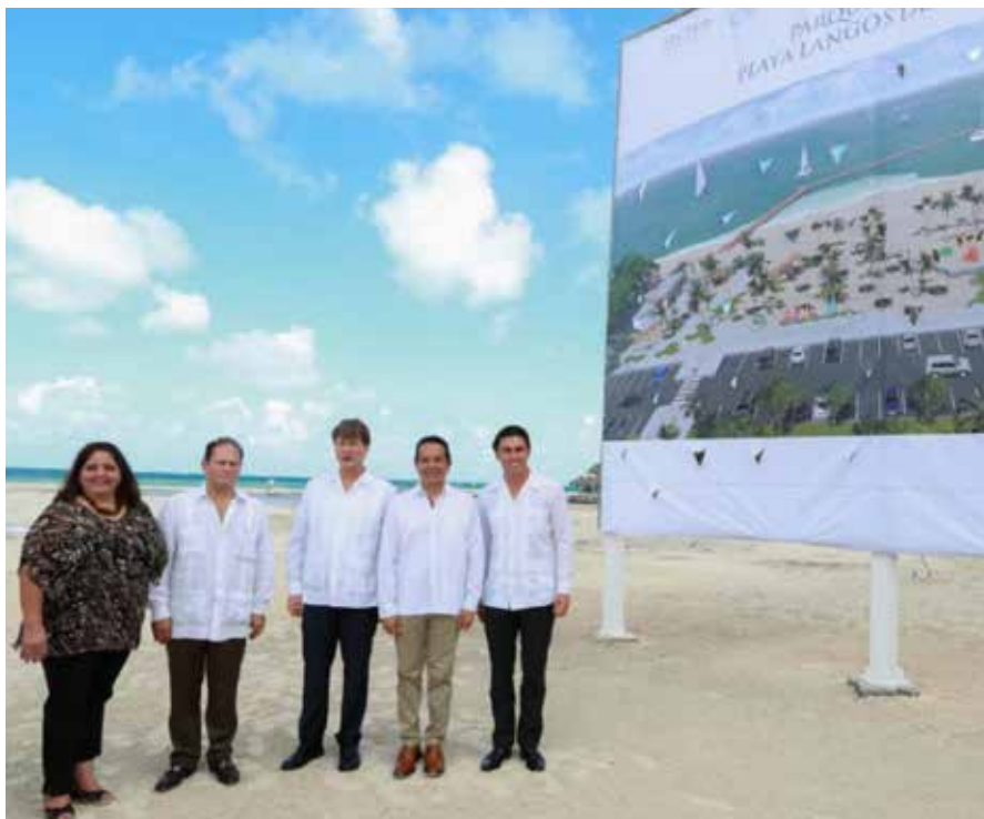
Las calificaciones de playas limpias y de excelencia se han logrado durante la administración del Gobernador Carlos Joaquín.

Una de las mayores preocupaciones que tiene la gente hoy en día es encontrar un empleo seguro, y bien pagado. Que además de brindarles la