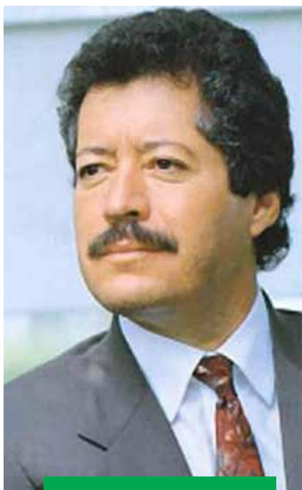
Luis Donaldo Colosio

También es cierto que el México que Luis Donaldo vio ese día esplendoroso, nos sigue convocando para atender