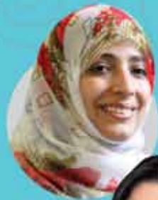
Tawakkol Karman, Premio Nobel de la Paz 2011

50 Líderes de opinión Concierto + Carrera por la paz