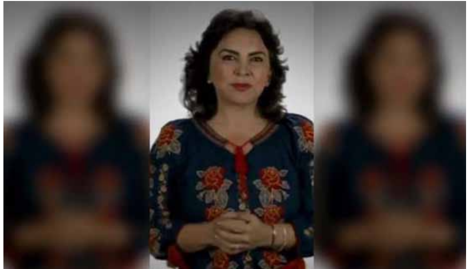
Ivonne Ortega Pacheco, ex gobernadora de Yucatán.

– Las manifestaciones son un reflejo de la realidad, y después de que semana a semana repasamos las noticias y observamos la magnitud de violencia contra la mujer presente en esta ciudad, me sorprende que no haya habido mayores disturbios. La situación actual es verdaderamente indignante, y el gobierno se había mostrado frío. Ahora ya hay mayor disposición del gobierno capitalino a actuar, y no fue sino por las demostraciones violentas de hace una semana.