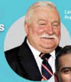
Lech Wałęsa, Premio Nobel de la Paz 1983

+3,500 Asistentes +2,000 Universitarios +27 laureados