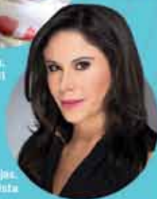
Paola Rojas, periodista