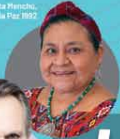
Rigoberta Menchú, Premio Nobel de la Paz 1992

+3,500 Asistentes +2,000 Universitarios +27 laureados