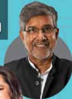
Kailash Satyarthi, Premio Nobel de la Paz 2014

50 Líderes de opinión Concierto + Carrera por la paz