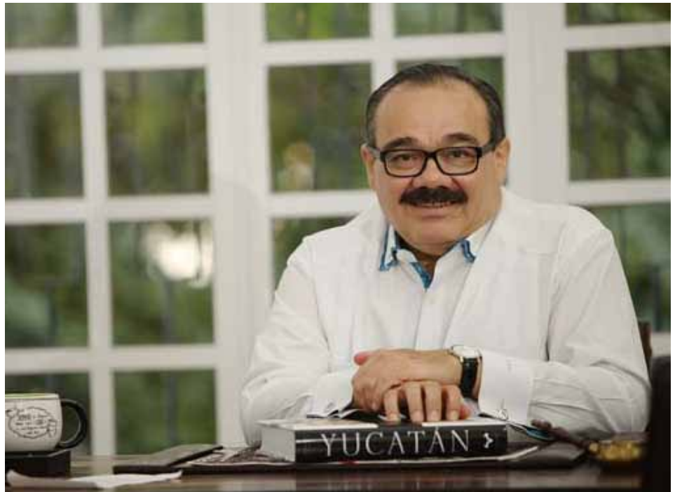
El senador, Jorge Carlos Ramírez Marín.

- Después de escucharla en Milenio el mismo día que presentara su renuncia, estoy seguro que no tenía un plan de acción claro, lo que significa que actuó bajo presión. En esta entrevista, cuando le preguntaron sobre su futuro dijo que mantendría su lucha en la militancia, y al percatarse de que parecía aludir a la mili-