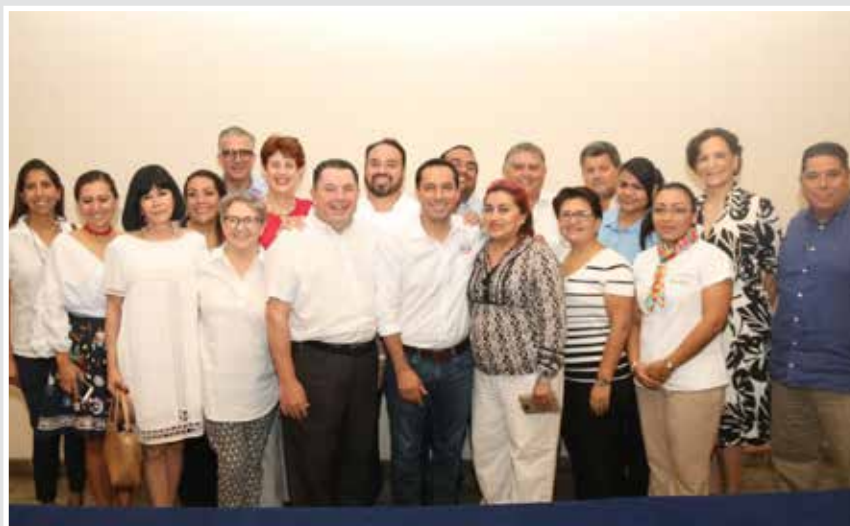
El abanderado del PAN y MC, propuso gestionar la denominación de Pueblo Mágico para San Felipe, Río Lagartos, Las Coloradas y otros siete puntos de Yucatán.

Al respecto, los integrantes de CETUR coincidieron en que la denominación de Mérida como Capital Americana de la Cultura denominación impulsó la proyección turística y cultural de la capital yucateca, gracias a la labor de promoción internacional que se hizo en 25 países de América y Europa y que hoy sigue dando frutos. R