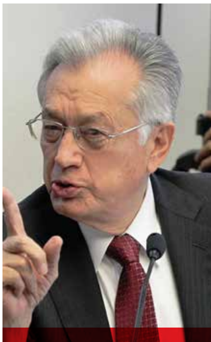
Manuel Bartlett, la mano dura del priismo de finales de los 80's y principios de los 90's, hoy en las filas de López Obrador.

Con Miguel de la Madrid la inflación llegó a 4 mil 30 por ciento con precios que cambiaban durante el día y una devaluación del 3 mil 100 por ciento. Eran las consecuencias del populismo de dos sexenios anteriores de despilfarro económico y de corrupción. De créditos nunca usados en obra pública y de saqueo de las paraestatales y de Pemex. Poco ha cambiado.