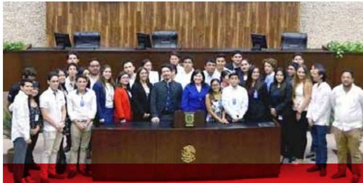
Estudiantes de las universidades: Modelo, Vizcaya, Anáhuac Mayab, Marista, Universidad Autónoma de Yucatán participaron en el Primer Congreso Joven en la sede del Legislativo.

La presencia de estudiantes en el Congreso de Yucatán, dónde se hacen y reforman las leyes del Estado es prueba de que los jóvenes no somos apáticos o indiferentes ante la política, estamos interesados en los problemas de la sociedad, por lo que celebramos la apertura de los diputados porque nos interesa conocer lo que hacen y también defender con convicción nuestras ideas y posturas, afirmaron universitarios al concluir el Primer Congreso Joven en la sede del Legislativo.