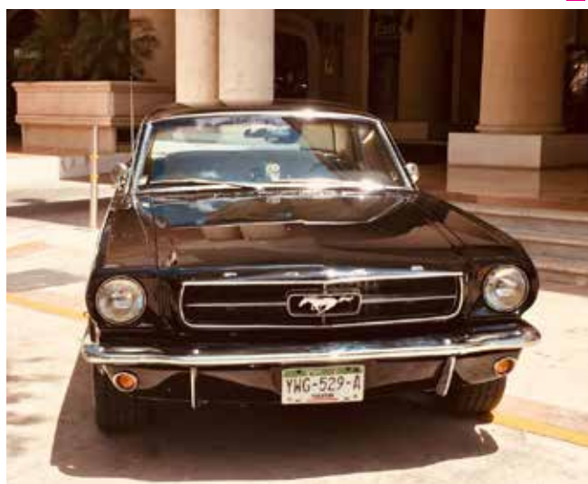
En el Rally Maya México 2018 se podrán admirar automóviles con más de 40 años y distinguidos por categorías de antigüedad de 1915 a 1975.