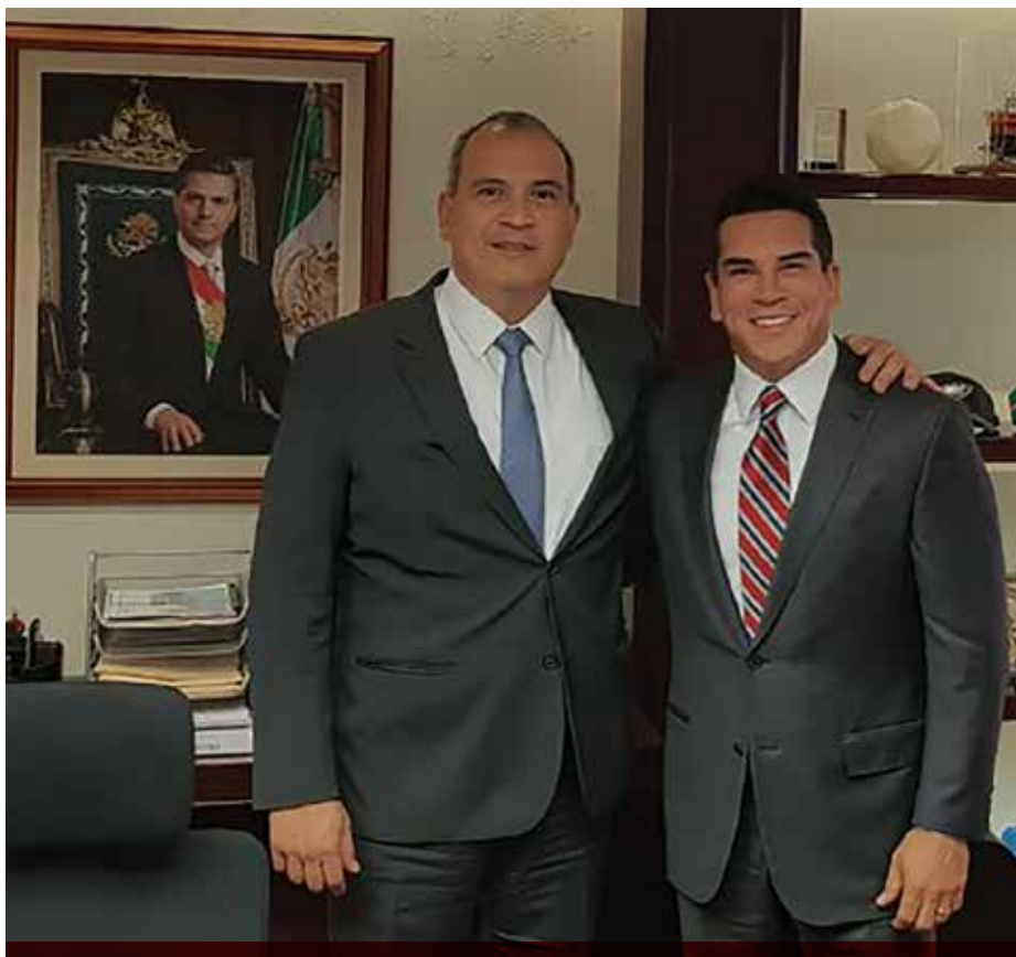
El gobernador Alejandro Moreno Cárdenas se reunió con el director general de Petróleos Mexicanos, Carlos Treviño Medina, en la CDMX.

La paraestatal ha mantenido su compromiso de trabajar en coordinación con las autoridades estatales a fin de contribuir a mejorar las condiciones de vida de los campechanos con mayor infraestructura, herramientas y equipo.