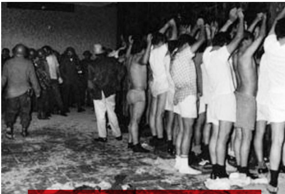
La matanza de Tlatelolco, violento episodio de la historia reciente de México.

H an pasado 60 años desde que en octubre de 1968 el gobierno mexicano ordenó la masacre de estudiantes en Tlatelolco porque se atrevieron a protestar por los abusos del régimen hegemónico.