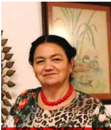
Dulce María Sauri Riancho, ex gobernadora del estado.

interina, Dulce María Sauri Riancho , ella, sí logró una posición en la próxima legislatura federal, claro, de la mano del experimentado Jorge Carlos Ramírez Marín . A ella, ya se le ve un semblante diferente, participación en el mayor número de eventos del PRI, hasta vestimenta más a modo y reconfortando el sentido de sus escritos y dichos. Nada más observen. Dos mujeres priistas. Dos equipos diferentes y dos pesas en las definiciones. Los tiempos y circunstancias de nuevo presentes. Coincidieron nuestros enlaces locales.