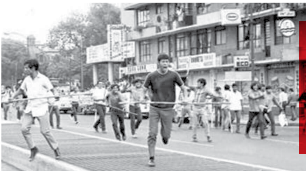
El "Jueves de Corpus" o el "Halconazo", otro tristemente célebre capítulo de represión.

No sé por quien votar, pero sí se que no lo haré por López Obrador. Sus actos hablan más de quien es que lo que ofrece y eso que sus compañeros de viaje él mismo los ha demeritado. No quiero un México de un solo hombre, eso ya lo sufrimos. R