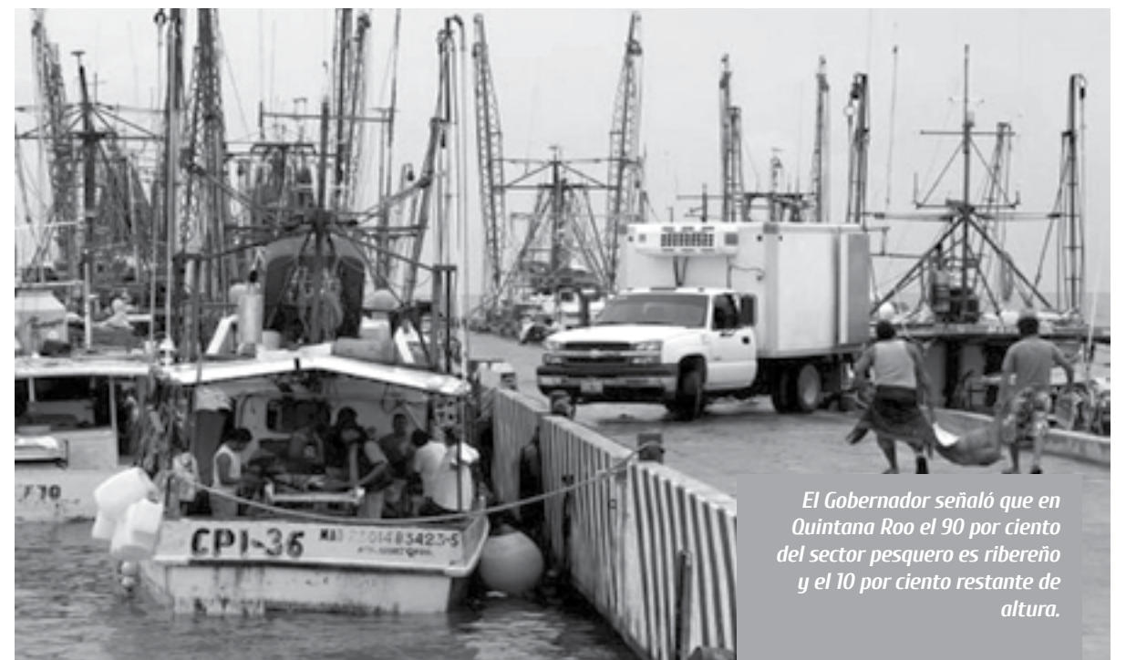
El Gobernador señaló que en Quintana Roo el 90 por ciento del sector pesquero es ribereño y el 10 por ciento restante de altura.