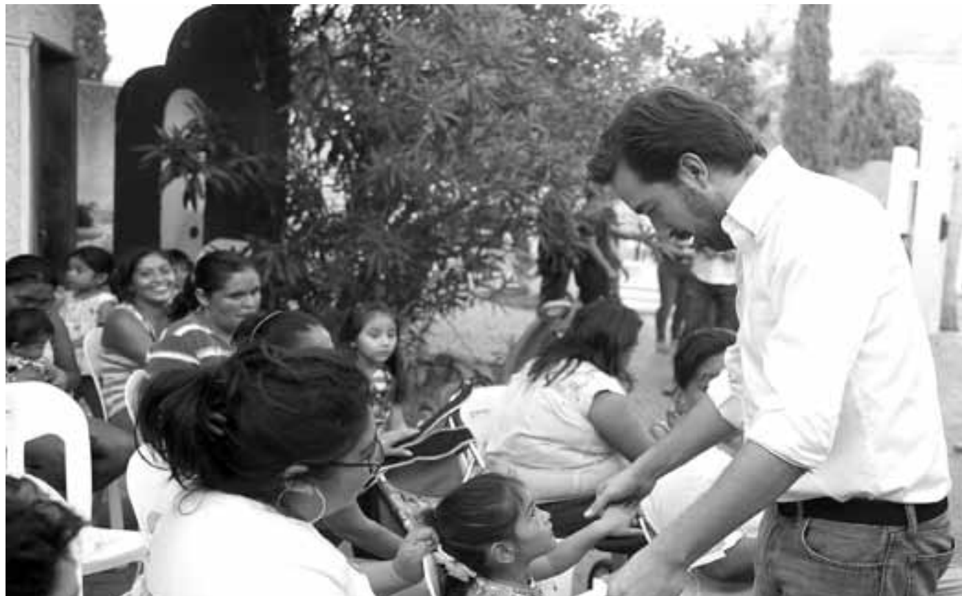
“Confianza para el Bienestar Social es lo que hoy compartimos con ustedes”, expresó el legislador.

“Los vecinos del Tercer Distrito Federal y de todo Yucatán cuentan con su Legislador. Estamos cumpliendo con hechos y esa es la R ►