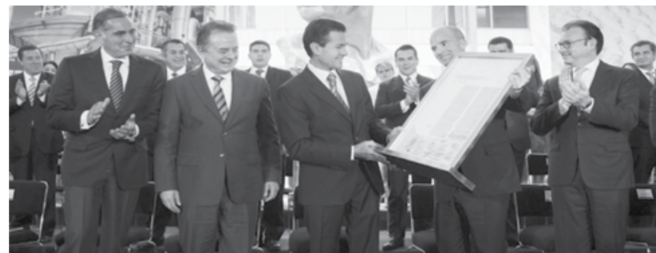
El gobernador Alejandro Moreno Cárdenas acompañó al presidente Enrique Peña Nieto, en la ceremonia del 78 aniversario de la Expropiación Petrolera.

"Pemex cuenta con dos fortalezas: la reforma energética y el total e invariable respaldo del Gobierno de la República", aseguró Peña Nieto. R