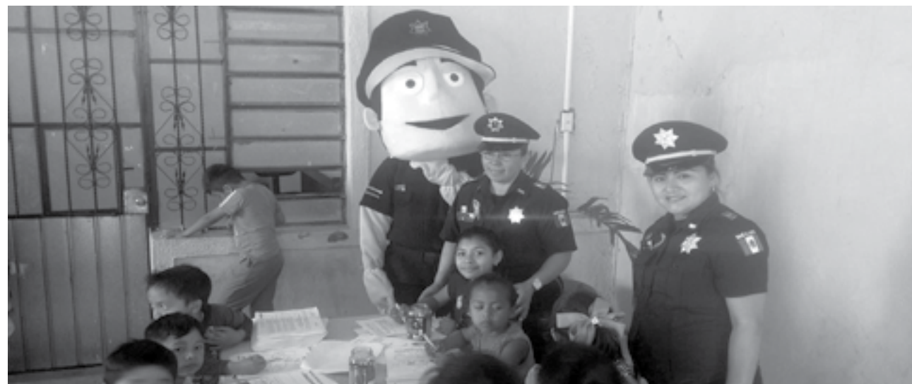
Se impartieron charlas que tuvieron como objetivo brindar consejos en materia de seguridad y prevención.

Género, en el municipio de Sudzal, en el estado de Yucatán. Niños y habitantes del municipio yucateco, presenciaron demostraciones del trabajo realizado por personal de la División de Fuerzas Federales, la cual exhibió la labor de los bino- ▶