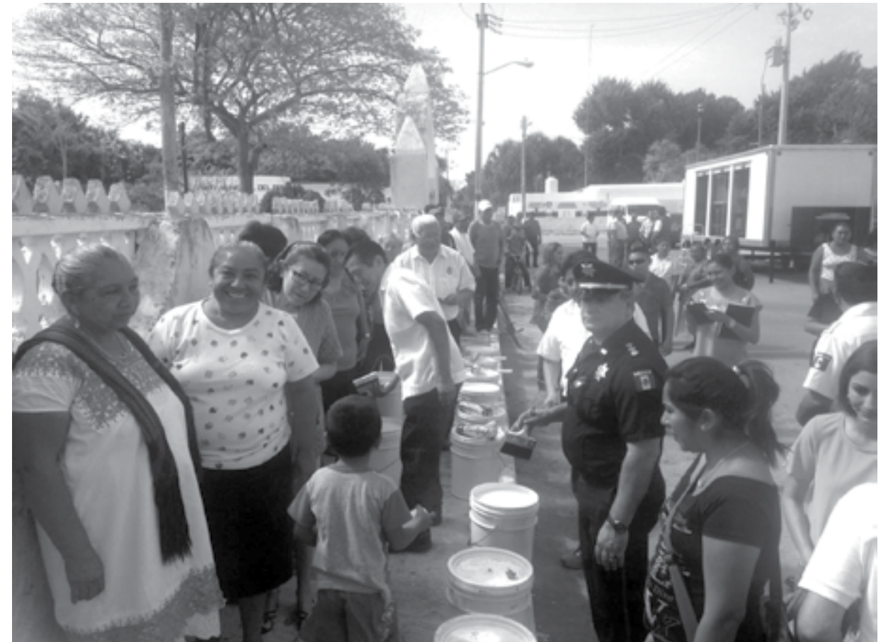
De manera conjunta con la Secretaría de Desarrollo Social se iniciaron los trabajos de pintura en la iglesia del municipio.

Cabe señalar que de manera conjunta con la Secretaría de Desarrollo Social se realizó la entrega de la Planta de Distribución de agua purificada del Instituto Tecnológico de Motul, Yucatán, y se iniciaron los trabajos de pintura en la Iglesia del municipio de Sudzal, Yucatán. ■