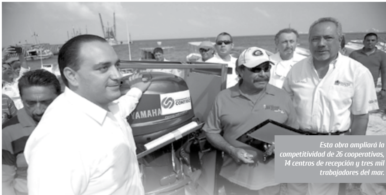
Esta obra ampliará la competitividad de 26 cooperativas, 14 centros de recepción y tres mil trabajadores del mar.