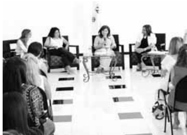
A la Expo Foro se dieron cita mujeres de negocios procedentes de Cancún, Cozumel, Chetumal, la Riviera Maya, Ciudad del Carmen y Yucatán.