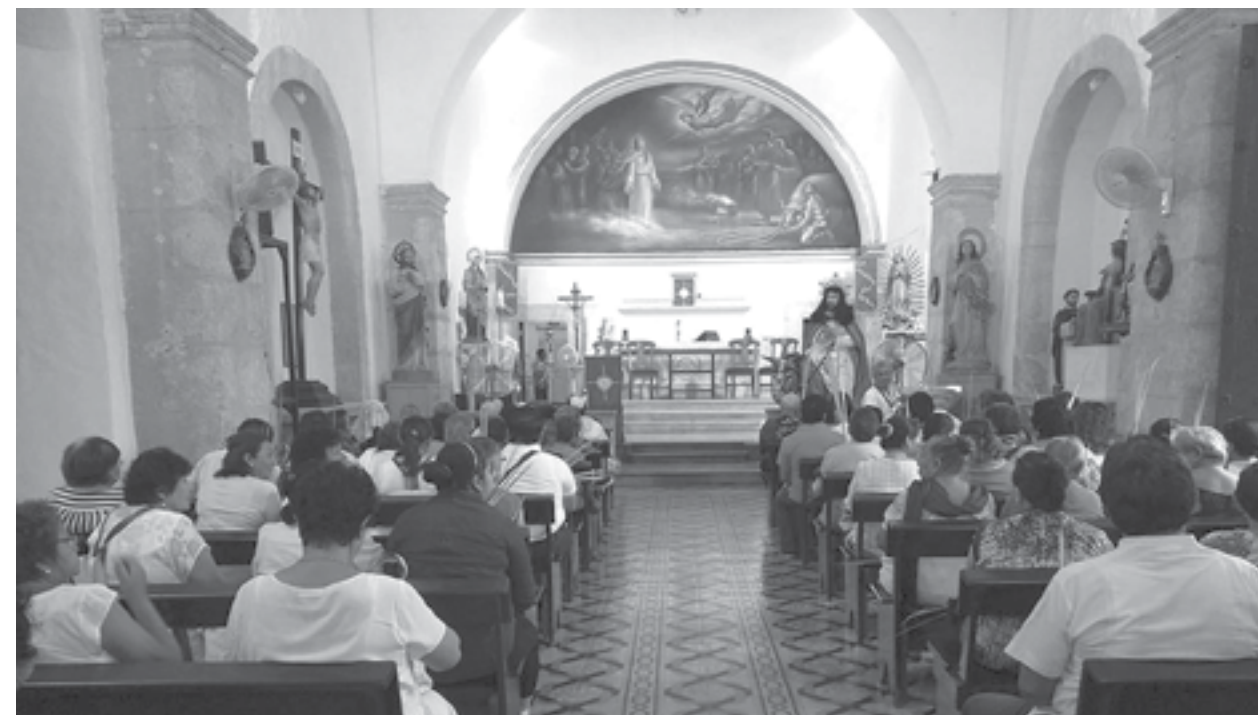
Los cristianos, en sus diversas ramas, acuden a sus templos a manifestar su fe, orar y participar en diversos servicios religiosos para recordar lo que el Mesías hizo en este mundo.

“La Semana Santa son los días más importantes para los ▶