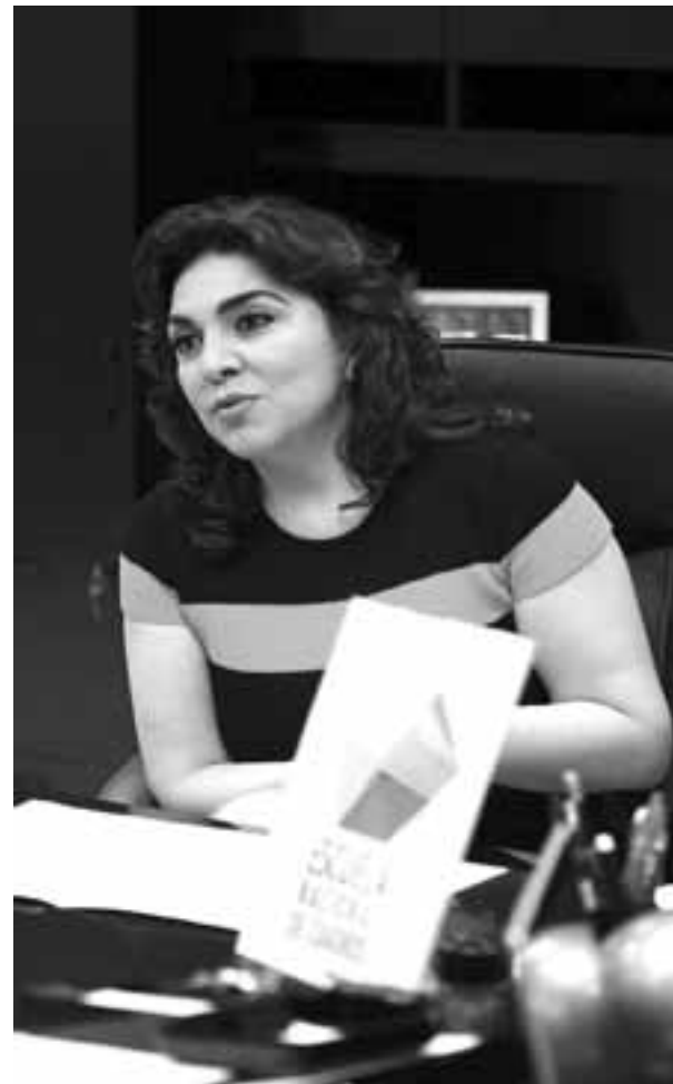
Sincera, la diputada federal Ivonne Ortega Pacheco señaló que a lo largo y ancho del país ha hecho amigos y aliados que pudieran ayudarla a seguir en sus aspiraciones presidenciales.

Verdad o mentira el hecho es que a Ortega Pacheco no le ha importado incluso la mofa que algunos o muchos realizan en Facebook o Twitter de lo que dice o comenta, pero ella, IR ►