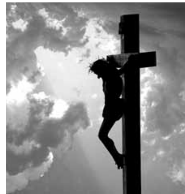
"La cruz se convierte de alguna manera en una oportunidad para poder ofrecer el sacrificio por amor a nuestros hermanos".

"Cada quien desde su misma fe, ratificar su compromiso con la palabra de Dios, creer en él y sus enseñanzas y ejem- IR ▶