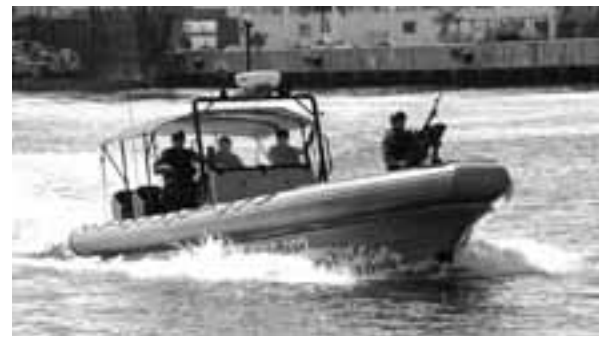
En donde también habrá vigilancia en estas vacaciones es en la costa yucateca, pues elementos de la Secretaría de Marina prácticamente realizan operaciones de "alcoholímetro" en altamar.

De esto y más estaremos pendientes. Recibimos correos con firmas en yazrodriguez@gmail.com