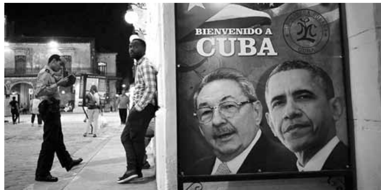
Obama puso mucho énfasis en el acceso a internet a lo largo de toda la isla como uno de los factores que les permitirá detonar su crecimiento y bienestar económico.

Síguenos en Twitter @DineroEnImagen y Facebook, o visita nuestro canal de YouTube