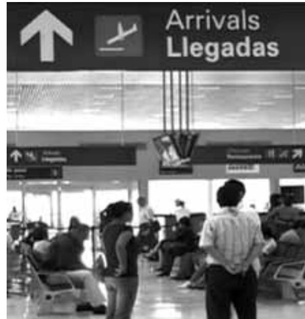
El Aeropuerto Internacional de Mérida se ha vuelto un verdadero "bunker", ya que la seguridad se ha reforzado impresionantemente en estas vacaciones de Semana Santa.