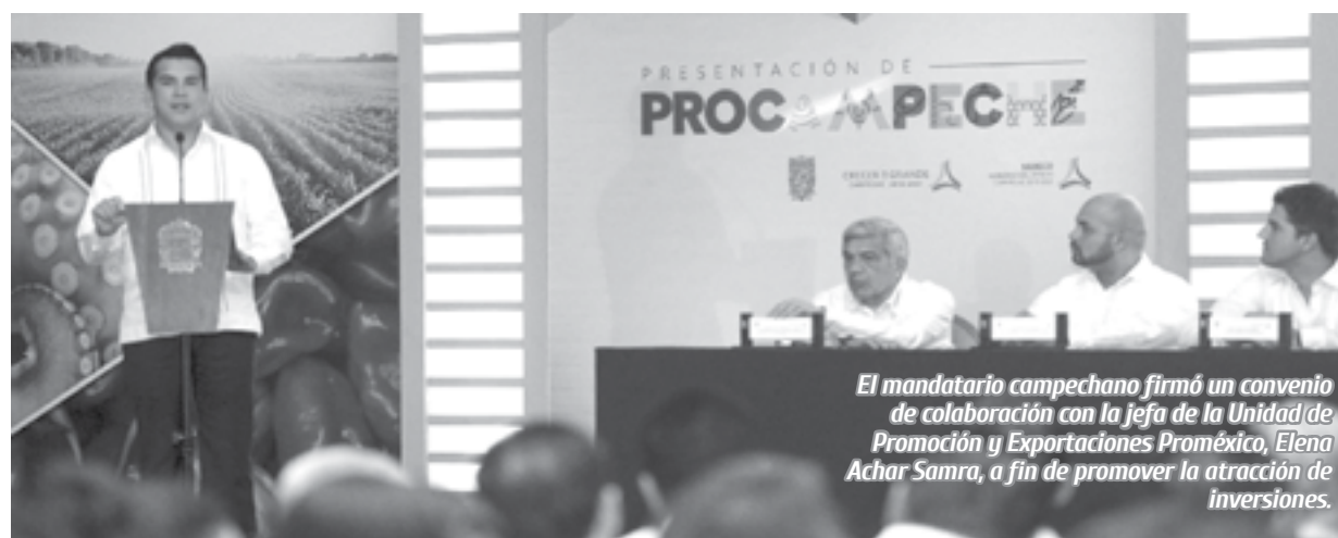
El mandatario campechano firmó un convenio de colaboración con la jefa de la Unidad de Promoción y Exportaciones Proméxico, Elena Achar Samra, a fin de promover la atracción de inversiones.