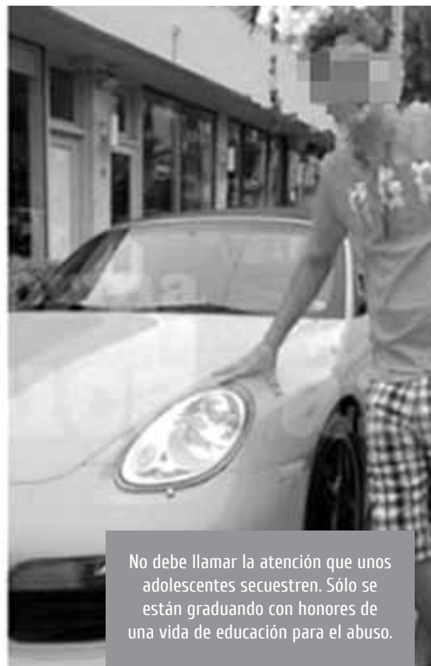
No debe llamar la atención que unos adolescentes secuestren. Sólo se están graduando con honores de una vida de educación para el abuso.