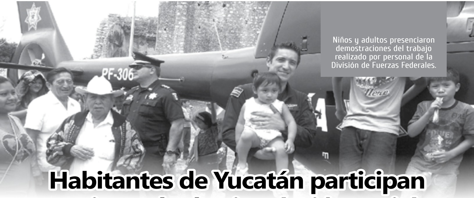
Niños y adultos presenciaron demostraciones del trabajo realizado por personal de la División de Fuerzas Federales.