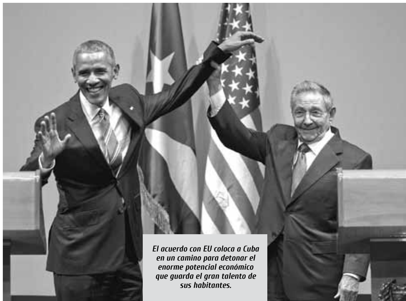
El acuerdo con EU coloca a Cuba en un camino para detonar el enorme potencial económico que guarda el gran talento de sus habitantes.