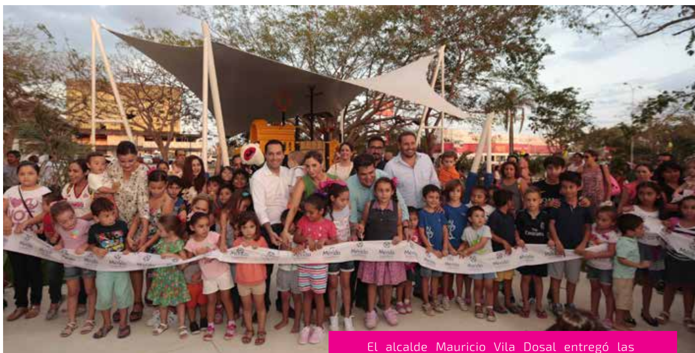
El alcalde Mauricio Vila Dosal entregó las obras de remodelación del parque de Kalia.

Este parque ya cuenta con 6 mil metros de áreas verdes, plantamos 30 árboles nativos y mil 500 plantas de ornato, es un espacio totalmente renovado acorde con las necesidades de los usuarios y compatible con el entorno ambiental