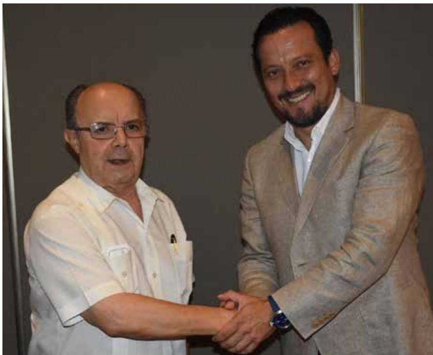
El yucateco Plinio Escalante Bolio, actual presidente de la Liga Mexicana de Béisbol presentó a Javier Salinas, quien le sucederá en el cargo al término de la presente temporada 2017.

Cuando Plinio Escalante Bolio asumió la presidencia de la LMB la afluencia a los estadios era de 2 millones de espectadores por temporada y ahora, tras 11 años en el cargo, esa cifra rebasa los 5 millones.