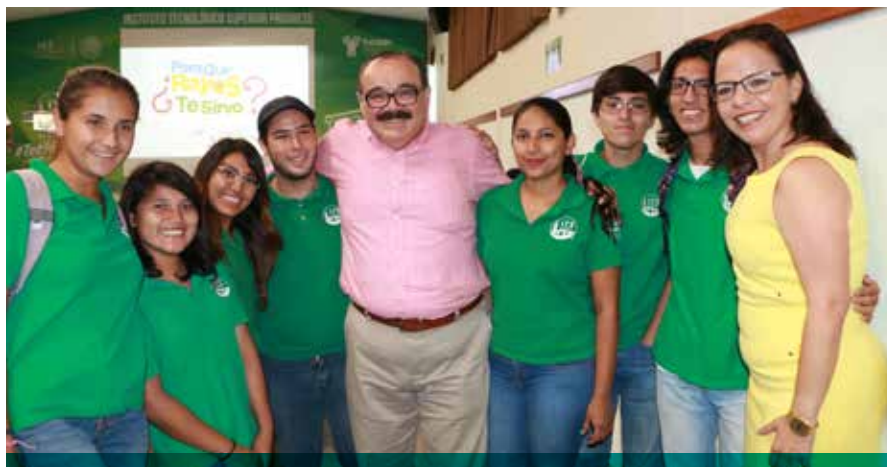
Apostar por los jóvenes es apostar por Yucatán, afirma el legislador yucateco.

También con el apoyo de la empresa yucateca Misión Admisión, el diputado puso en servicio la plataforma: www.misionadmisión.com/simulador , para ofrecer cursos propedéuticos a los jóvenes que desean ingresar a las universidades y los tecnológicos que aplican el Exani II. Es tanto para los que