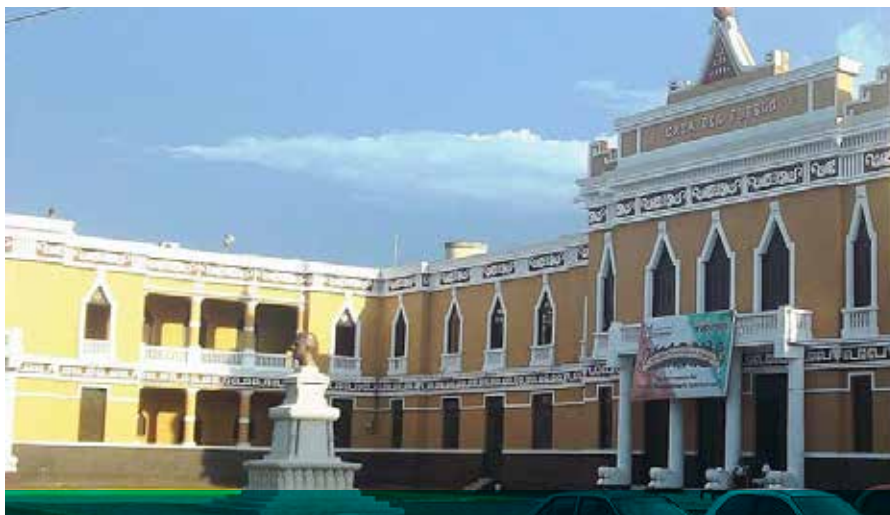
La otrora Casa del Pueblo, ahora sede del Partido Revolucionario Institucional del Estado.

del PRI se afina día a día, hay un trabajo eficiente y constante, bajo la premisa de que hay trabajo para todo y espacio para todos y analizan con lupa y cabeza bien fría, quien garantiza mejores resultados para población y sin perder el tiempo en los rumores normales del tiempo, de que ya definieron a tal o cual aspirante como el candidato o que ya eliminaron a tal o cuál.