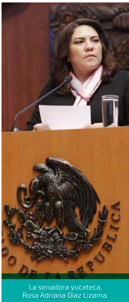
La senadora yucateca, Rosa Adriana Díaz Lizama.

El tequila, el mezcal, el sotol, la talavera, el mango ataulfo, el café de Chiapas y el de Veracruz, y el chile habanero, entre otros pocos productos, tienen Denominación de Origen, pero el pulpo maya, por ejemplo, está en una de sus primeras