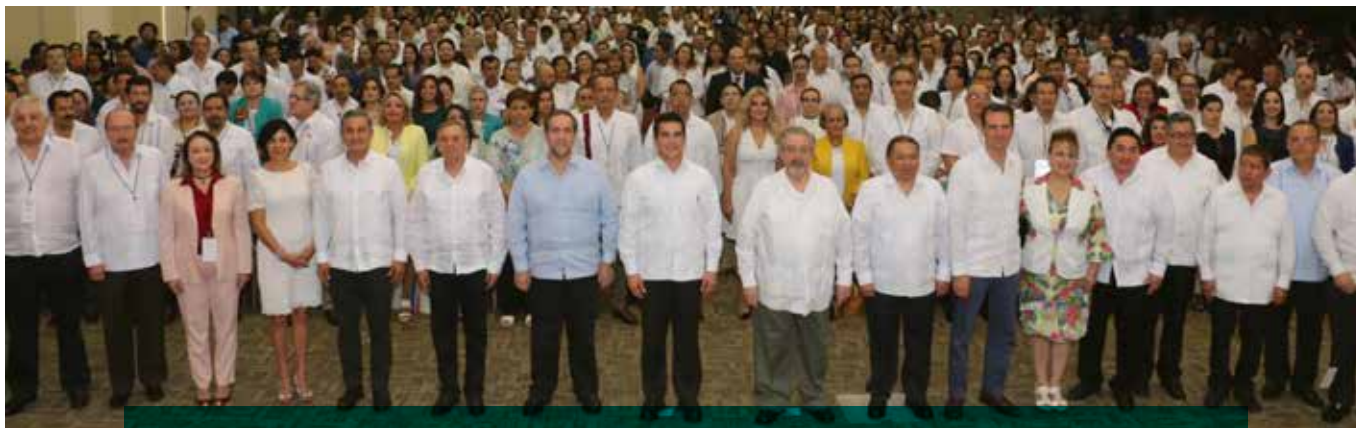
El mandatario estatal, hizo un reconocimiento al compromiso que tienen las instituciones judiciales de todo el país con la fortaleza del sistema democrático.

debe permitirse. Todo dentro de la ley, nada por encima de ella", citó.