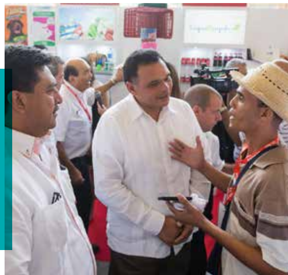
El Mandatario yucateco destacó el hecho de que acudan 40 firmas de la entidad a este evento internacional realizado en la capital cubana.

Entre las empresas yucatecas que asistieron a la Feria Internacional de La Habana están: Hidrogenadora Yucateca, salsas El Yucateco, Ecosolutions, Expomayab, Paragua de la Península, Air Temp, Procomex, Nea Industrias Ambientales, GPI de México, Maya Shuttle, El Niplito, Bomssa, Galletas Dondé, Nutrigo, entre otras.