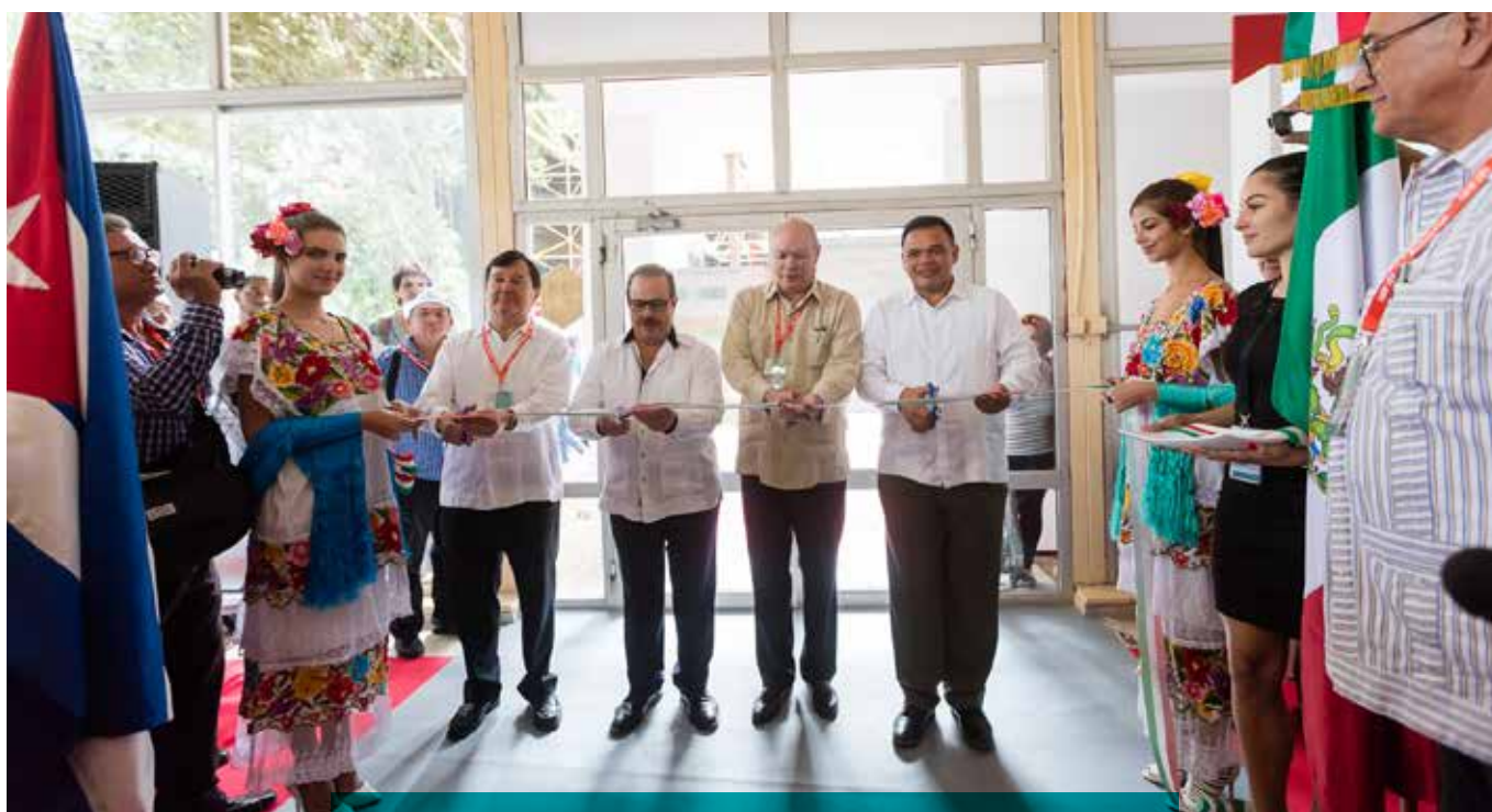
El gobernador Rolando Zapata Bello inauguró el Pabellón de México en la Feria Internacional de la Habana.