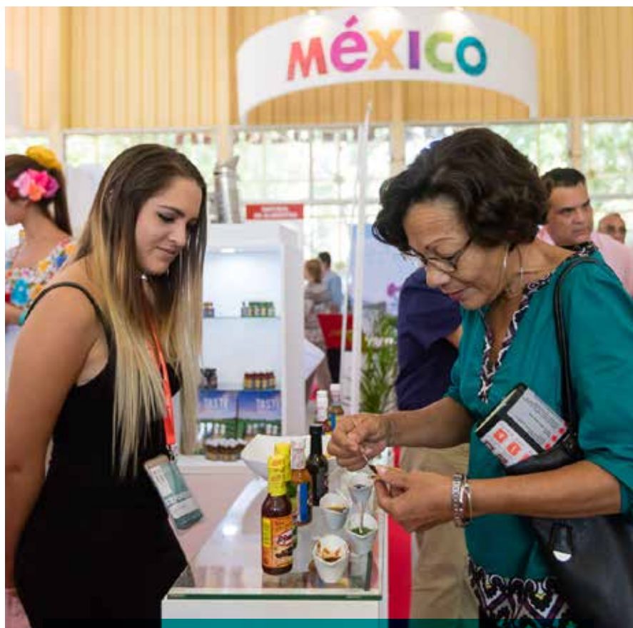
Yucatán aprovecha el gran impulso al turismo que vive Cuba y su nueva dinámica de crecimiento.

Además, en el evento la compañía Paragua de la Península entregó 30 toneladas de alimento para cerdo a porcicultores cubanos afectados por el huracán Irma para que se recuperen de los daños. R