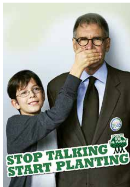
Harrison Ford Actor y Productor de Cine vocero oficial

La pregunta no es vacua ante la cauda de compromisos incumplidos que se le señalan en la protección de derechos humanos o anticorrupción como parte de la crítica. Ahí lo relevante es su reprimenda, que pone de manifiesto el ánimo y las motivaciones con las que cerrará su administración. Sus expresiones, más allá de su desacierto, parecen hablar de un presidente dispuesto no sólo a manejar el "destape" del PRI, sino a meterse a la elección a defender su futuro con la continuidad de su partido y grupo cercano; de un presidente dispuesto a jugar para contribuir al triunfo de sus intereses en las urnas y buscar la continuidad de las reformas de su administración. Peña Nieto no parece el presidente abatido al final de su sexenio por el peso de la crítica y los fracasos, sino el jugador dispuesto a intervenir en su destino hasta el final de la partida y tratar de ganar una zona de seguridad que lo cubra cuando deje la Presidencia en 2018. R