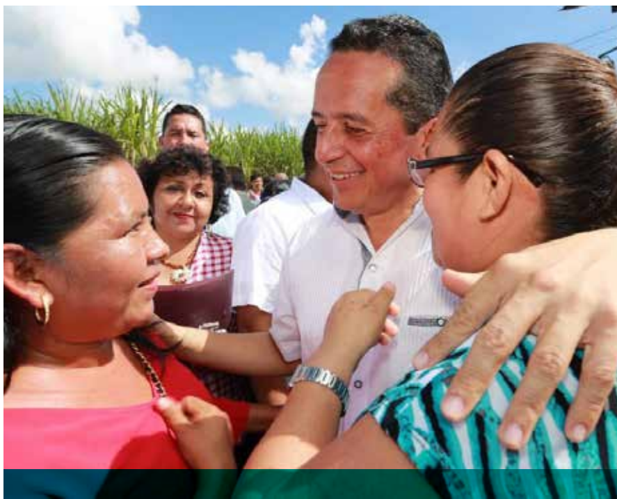
El Gobierno de Carlos Joaquín cumple con su compromiso de transparentar el 100 por ciento del gasto público y la rendición de cuentas.

Con relación al pago de servicios de transportación aérea revelados recientemente, el gobierno estatal precisó que los datos incluyen tanto