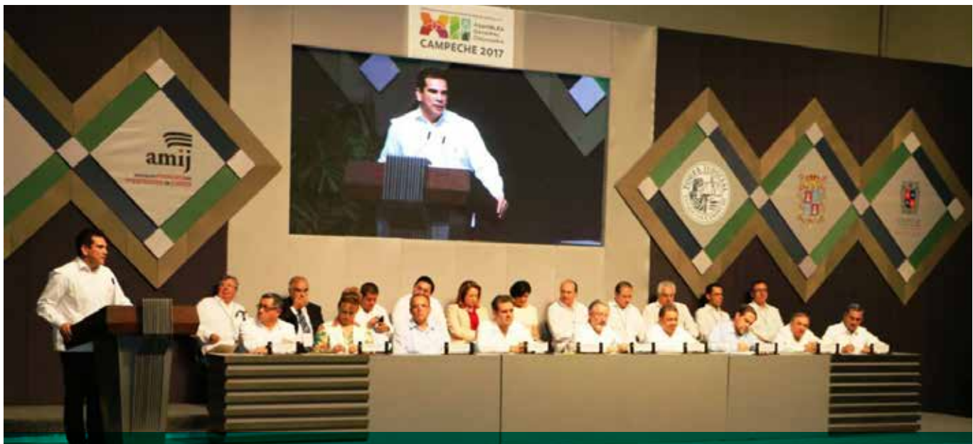
El gobernador Alejandro Moreno Cárdenas hizo un llamado a fortalecer la justicia y la democracia en México, tras inaugurar la XII Asamblea General Ordinaria de la Asociación Mexicana de Impartidores de Justicia (AMIJ).

A l inaugurar la XII Asamblea General Ordinaria de la Asociación Mexicana de Impartidores de Justicia (AMIJ), el gobernador Alejandro Moreno Cárdenas hizo un llamado a fortalecer la justicia y la democracia en México, pues sólo así se podrán lograr mejores condiciones de desarrollo para la sociedad.