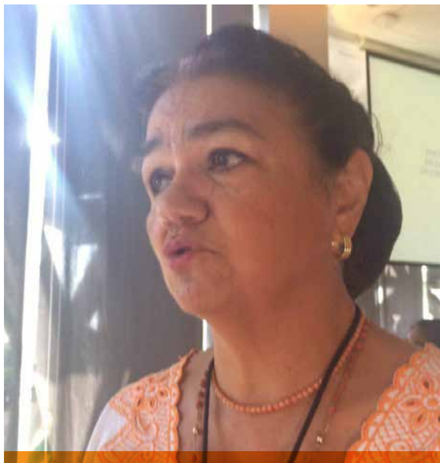
La ex gobernadora, Dulce María Sauri Riancho.

-Mas que convencernos, la plataforma de Nueva Alianza que está incluida como gobierno es a donde vamos a ir-recalcó.