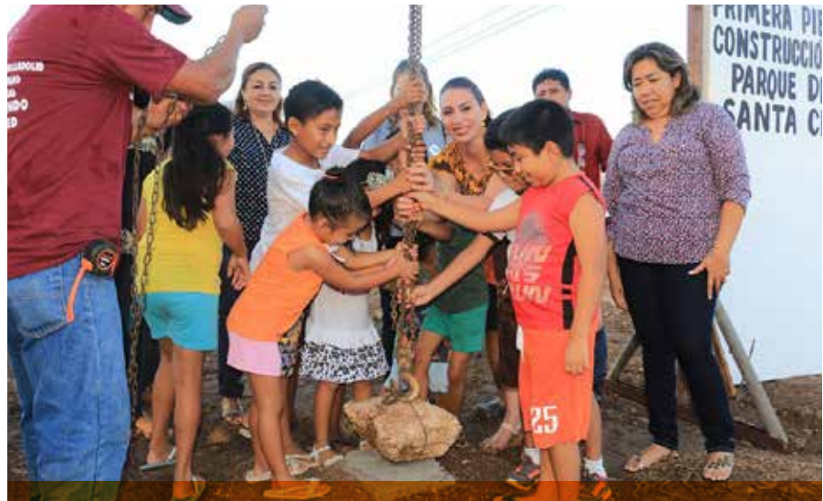
La alcaldesa vallisoletana, Alpha Tavera puso la primera piedra para la construcción del parque en el fraccionamiento Santa Cruz, que tendrá una inversión de 3 millones 270 mil pesos.

Siguiendo sus actividades, la primera autoridad del municipio, Alpha Tavera, se dirigió hasta el fraccionamiento Santa