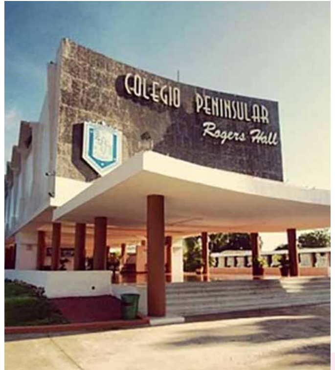
"EL VIERNES 9 DE JUNIO HUBO REUNIÓN FAMILIAR: TODOS LOS EX ALUMNOS DEL COLEGIO ROGERS HALL NOS REUNIMOS A CELEBRAR".