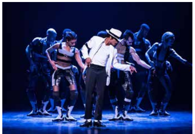
DURANTE LA DÉCADA DE LOS OCHENTA VIMOS SURGIR AL REY DEL POP MICHAEL JACKSON.