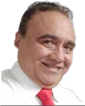
POR ISMAEL MÉNDEZ CAMARGO