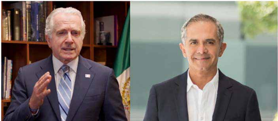
SANTIAGO CREEL Y MIGUEL ÁNGEL MANCERA.

competirá. La idea principal es que la sociedad civil pueda participar en esa elección primaria. ¿No son los partidos políticos los representantes de la ciudadanía? Ya veremos porque las dirigencias de los partidos políticos se cuecen aparte.