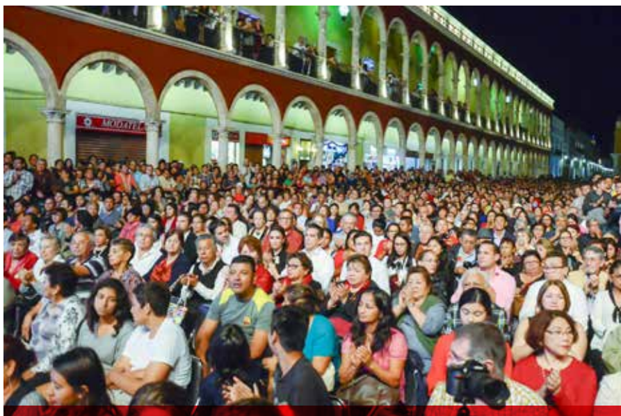
Miles de campechanos así como turistas nacionales y extranjeros asistieron al Magno Concierto de Navidad, que se llevó a cabo en el Atrio de la Iglesia Catedral.

“Con estas acciones lograremos fortalecer a Campeche en turística y aumentar la derrama económica para el beneficio de los campechanos”, finalizó el titular de la SECTUR. R