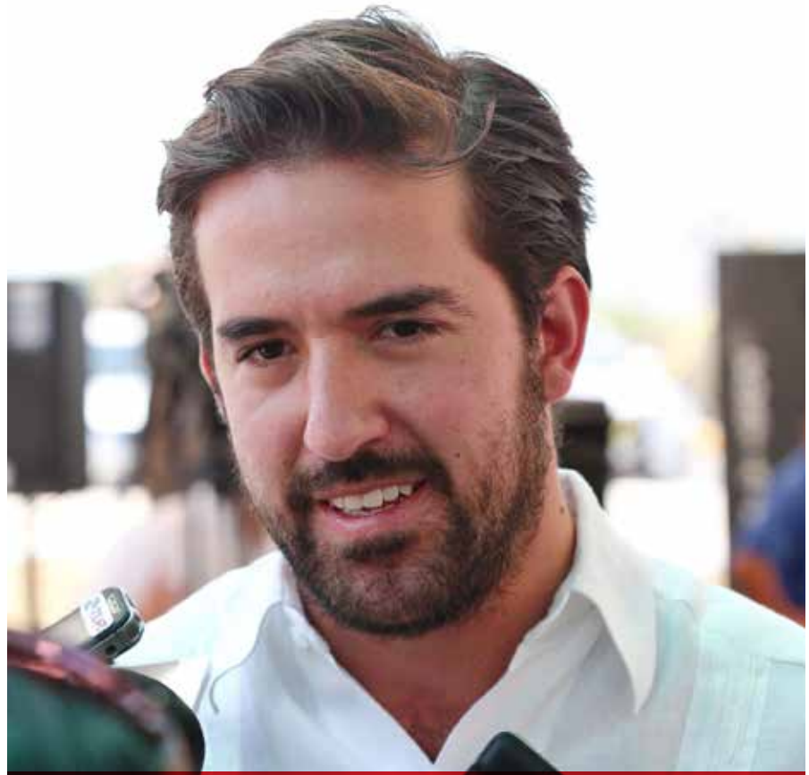
El diputado federal Pablo Gamboa Miner aspira a competir por un escaño en el Senado de la República.

Por otro lado, en Acción Nacional tampoco les está yendo del todo bien, pues aunque el ex alcalde de Mérida, Renán Barrera Concha acató la disposición de que Mauricio Vila Dosal, sea el precandidato a gobernador, hay otros más que se quedaron en espera de diputaciones federales, senadurías y la candidatura