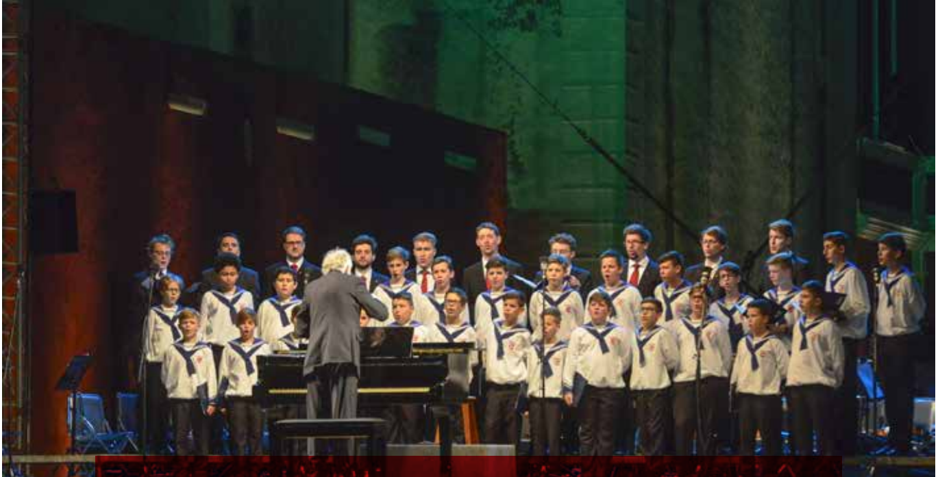
Los Niños Cantores de Viena cerraron con broche de oro el Festival Internacional del Centro Histórico (FICH).