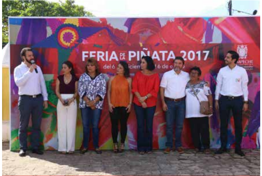
La Feria de la Piñata se instaló desde el pasado 6 de diciembre y permanecerá en la Alameda "Francisco de Paula Toro" hasta el día 6 de enero.

La Feria de la Piñata se instaló desde el pasado 6 de diciembre y permanecerá en la Alameda "Francisco de Paula Toro" hasta el día 6 de enero. R