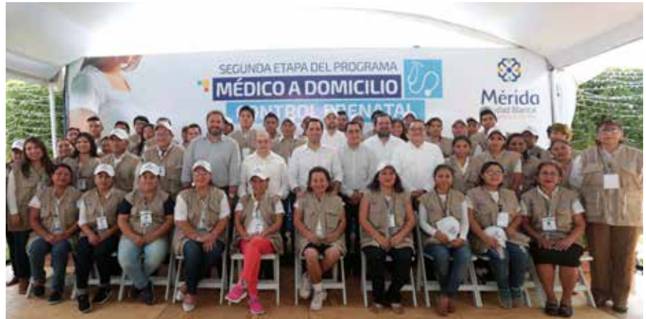
El alcalde de Mérida, Mauricio Vila Dosal anunció la segunda etapa del programa Médico a Domicilio, que incluirá la atención prenatal a mujeres embarazadas.

Respecto al control médico a mujeres gestantes, detalló que se está enfocando a dos grupos de población: 1) Aquellas que no son derechohabientes de ninguna institución pública de salud y por tanto carecen de la seguridad social en esta materia, y 2) Las que si son derechohabientes pero por alguna