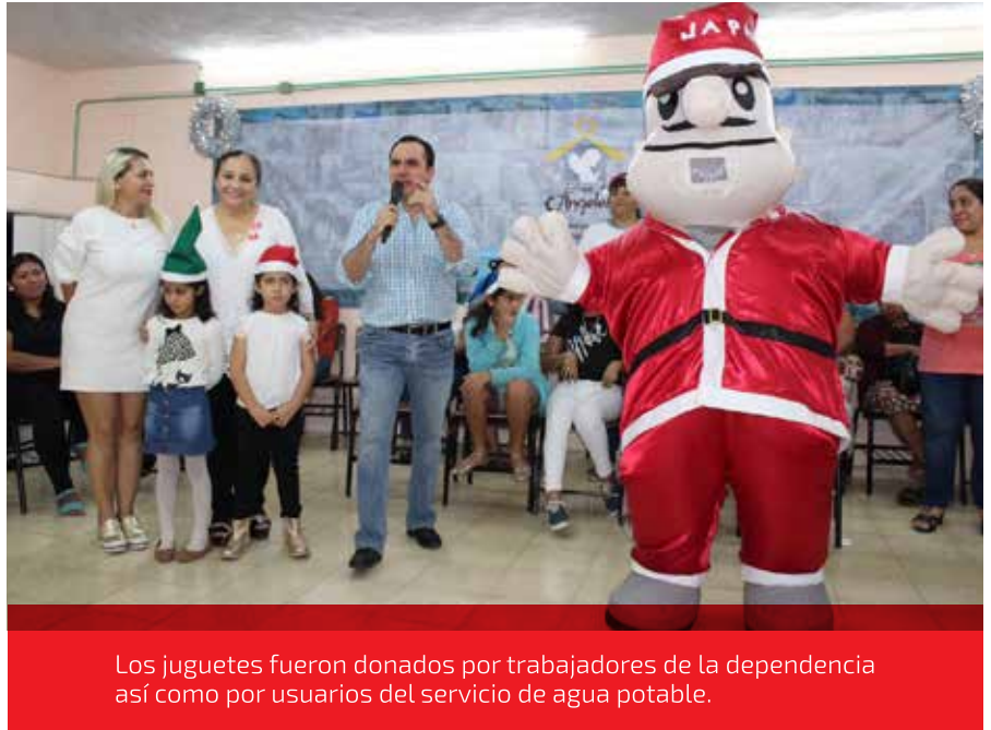
Los juguetes fueron donados por trabajadores de la dependencia así como por usuarios del servicio de agua potable.

Durante la entrega, Carrillo Esquivel estuvo acompañado de Japayito Claus, botarga de la dependencia que convivió y alegró a los infantes durante el evento. El director aprovechó la ocasión para desearles