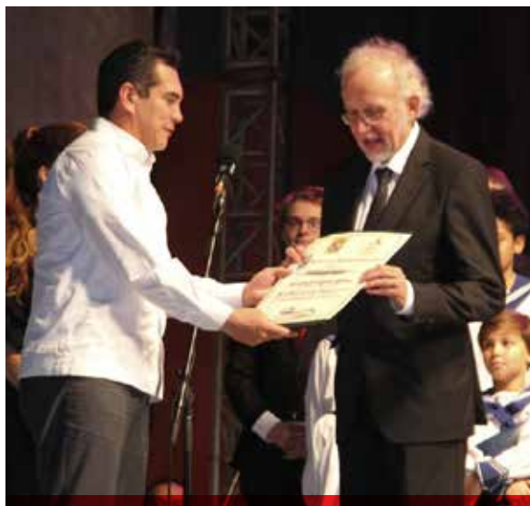
El jefe del Ejecutivo estatal, Alejandro Moreno Cárdenas entregó un reconocimiento al director del coro por su participación en el FICH.

Por otra parte, el titular de la Secretaría de Turismo del Gobierno del Estado (SECTUR), Jorge Manos Esparragoza, se reunió con empresarios del sector hotelero, restaurantero y tour operadoras, con la finalidad de informar las estrategias de promoción del primer cuatrimestre del 2018, y así redoblar esfuerzos y crear sinergias.