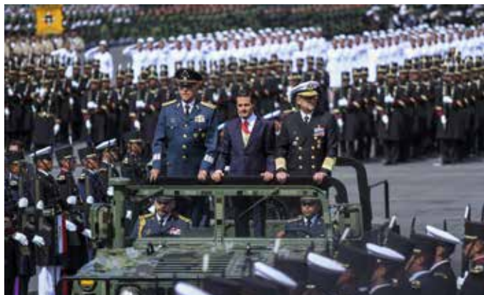
La promulgación de la Ley de Seguridad Interior hoy está en manos del Poder Ejecutivo.

Esto ha provocado un limbo y una laguna legal en la medida