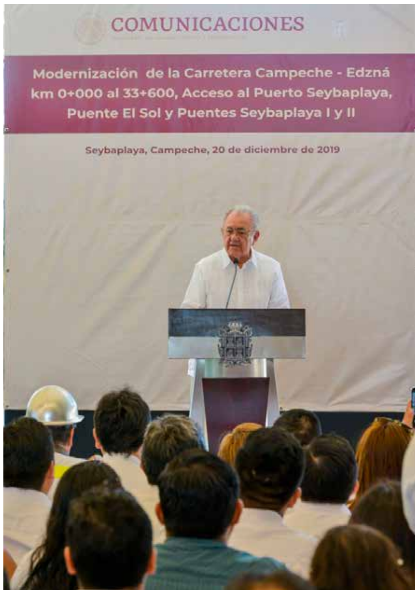
El secretario de Comunicaciones y Transportes, Javier Jiménez Espriú, anunció para el 2020 la construcción del libramiento carretero de Escárcega.