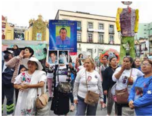
LOS INTEGRANTES DE COLECTIVOS CERRARON SIMBÓLICAMENTE LOS ACCESOS A PALACIO DE GOBIERNO, AVENIDAS, CÉNTRICAS CALLES Y LA ENTRADA AL EDIFICIO DE LA SECRETARÍA DE SEGURIDAD PÚBLICA.