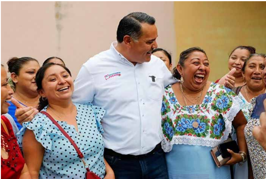
EL PRECANDIDATO DEL PAN, RENÁN BARRERA CONCHA.