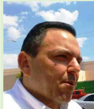
Roberto Rodríguez Asaf Secretario General de Gobierno

El objetivo es uno solo: que todos los habitantes de Yucatán, en especial las mujeres, tengan la seguridad de realizar sus actividades en un ambiente de seguridad y de confianza. Es un esfuerzo que no debe detenerse, y debe de ser en todo el territorio del estado. R