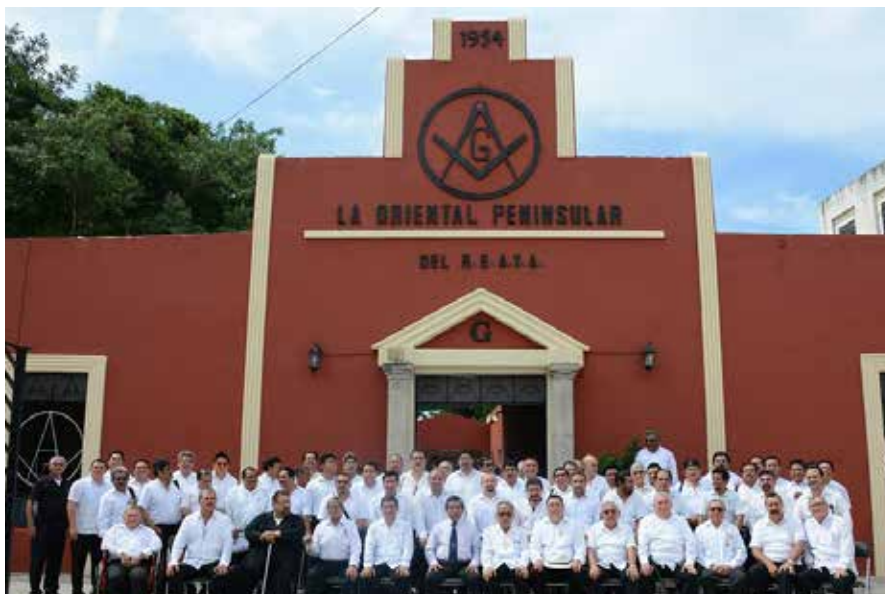
En Yucatán la Gran Logia Unida la Oriental Peninsular está presente en su edificio construido en 1923.

La Masonería regular –recuerda-, se inicia en Londres cuando cuatro logias