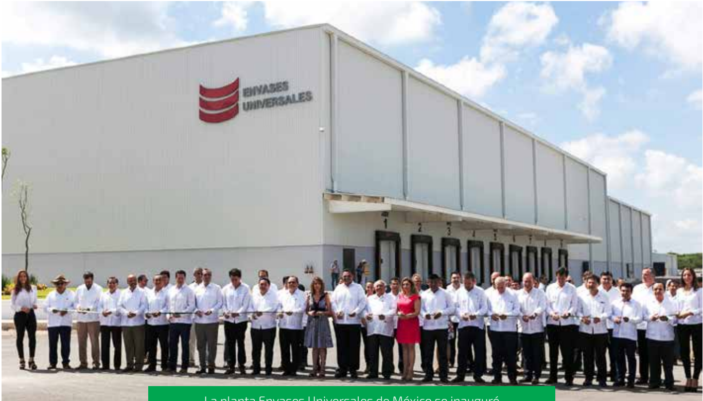
La planta Envases Universales de México se inauguró recientemente en el municipio de Hunucmá.

La reciente apertura de la planta Envases Universales de México en el municipio de Hunucmá, la cual genera actualmente más de 200 empleos directos y mil indirectos para los yucatecos, significa un paso más en la consolidación de Yucatán como un estado con poderío industrial.