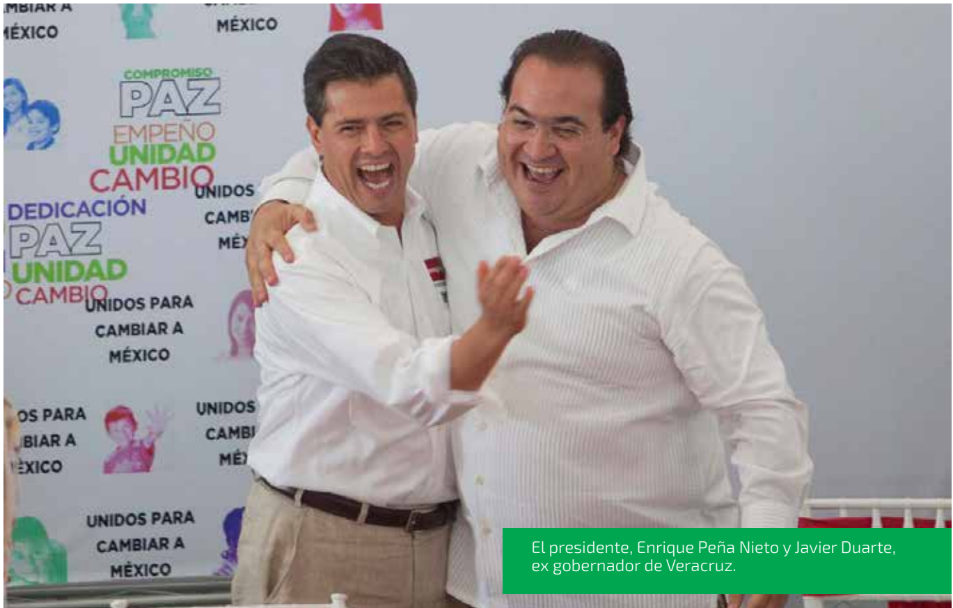
El presidente, Enrique Peña Nieto y Javier Duarte, ex gobernador de Veracruz.

A nte una situación como el caso del ex gobernador de Veracruz Javier Duarte hay diferentes aristas de interpretación y acción. Por un lado, las mediáticas y lecturas políticas. Por otro, la que debería importar que es la jurídica.