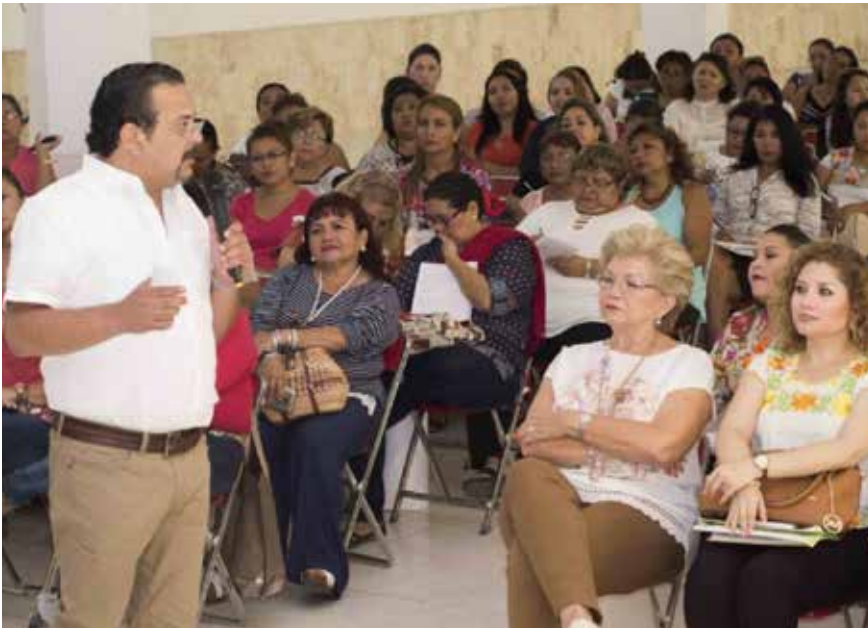
El priismo yucateco necesitará cuando menos 53 damas para postular en las alcaldías de Yucatán.

De aquí al mes de noviembre tendrán los principales partidos políticos, los tiempos aprobados en el marco de la ley, para elegir a sus eventuales abanderados a las alcaldías y diputaciones locales y federales y posiblemente a las senadurías.