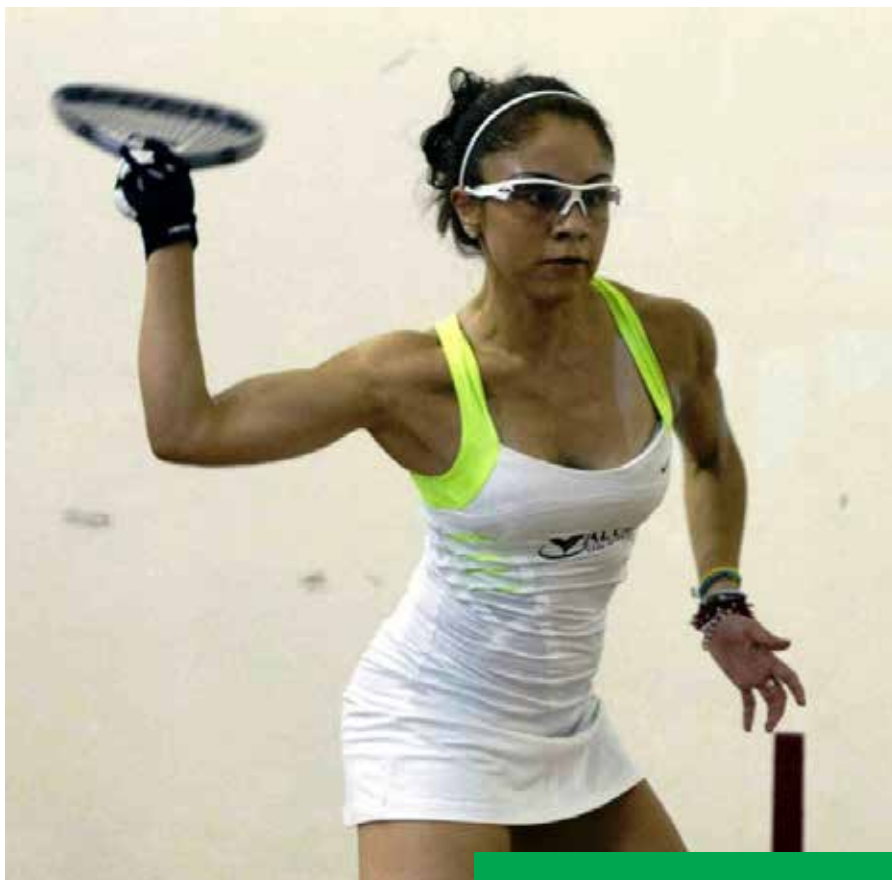
Paola Longoria, es otra deportista mexicana destacada en la disciplina del ráquetbol.

A través del tiempo, el deporte ha evolucionado al igual que lo han hecho las diversas sociedades alrededor del mundo. A partir del siglo pasado, muchas disciplinas deportivas se han institucionalizado, brindando mayor seriedad a las competencias. Tal es el caso de la FIFA, que regula las actividades del fútbol profesional global, por ejemplo.