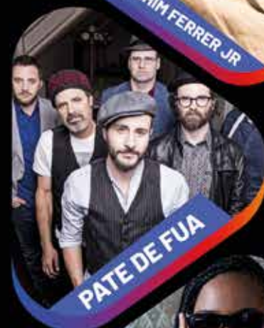
PATE DE FUA