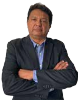
POR FRANCISCO LÓPEZ VARGAS

LA CFE SE CONVERTIRÁ EN EL COCHINITO DEL GOBIERNO PORQUE POCAS CASAS DEL PAÍS CARECEN DE ENERGÍA ELÉCTRICA, NADIE PODRÁ PRODUCIR ENERGÍA Y LA PARAESTATAL SERÁ LA ÚNICA QUE PUEDA COMPRARLA PARA REVENDERLA AL PRECIO QUE SU DIRECTOR DECIDA.